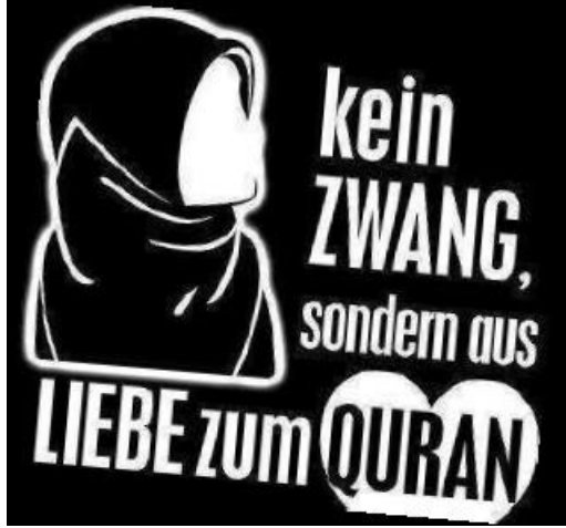
Diři aslanların asrı