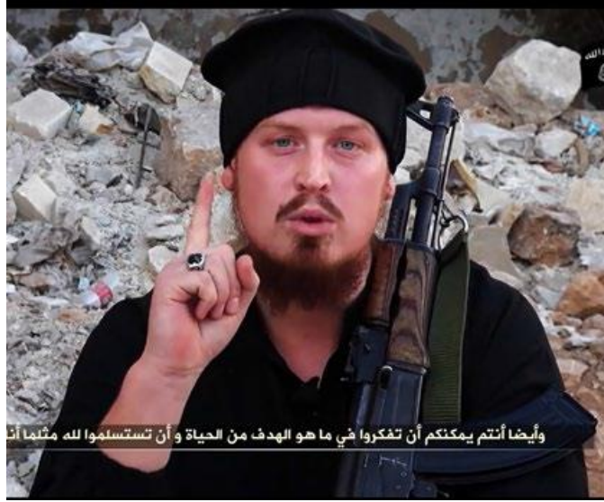
KRW den Youtube’da taraftar bir cihadist.

Selefilere İslami seminer ve dua örneği gibi çoğu kez konutlarda ve özel kiralanmış mekanlarda kapalı etkinlikleri kaçamak yapılmaktadır. “klasik” camii ve ayrıca “arka avlulu camilerde” ortaya çıkmaları Selefilere uygulanan kamusal baskı ve buna bağlı büyük zorluklar nedeniyledir.