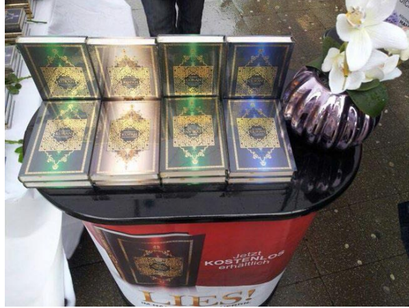
Selefi bilgi standına bir örnek

Dini bilgi materyaliyle Selefiler insanlara yaklaşılmaktadırlar. Buna bir örnek selefi örgütlerin standlarında dağıtılan Kuran nüshalarıdır. Problem bu bağlamda Kuran'ın kendisi değil, dağıtımcı gruplar eliyle mobilize edilmiş etkidir. Dini özgürlükten kötü bir şekilde yararlanılmaktadır.