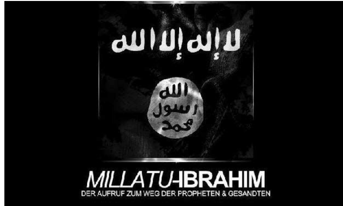
Milleti İbrahim Derneđi'nin 2012'de yasaklanan kelime-i şhadetli logosu