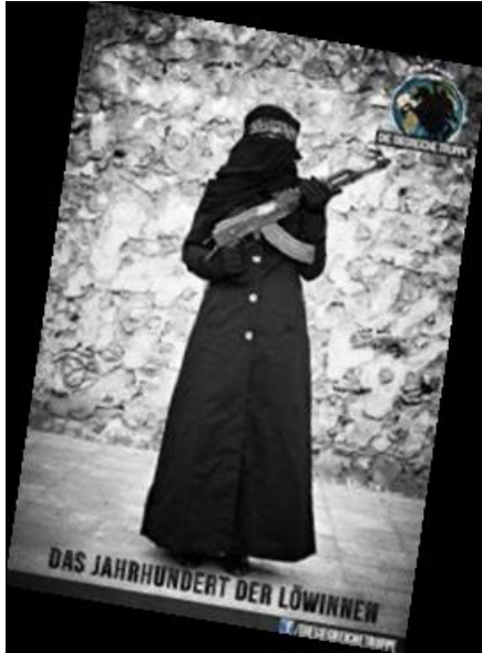
İnternetteki sosyal ağlarda özellikle kadınlara yönelik selefi reklam

Bu ideolojik ve organizeli katılım bununla birlikte bazı kadınlara yeterli olmamaktadır. Anayasayı Koruma Teřkilatı, Kuzey Ren-Vestfalya'dan Suriye savař bölgesindeki cihada erkeklerini desteklemek için göç etmiř kadınların durumunu bilmektedir. Tekil du-