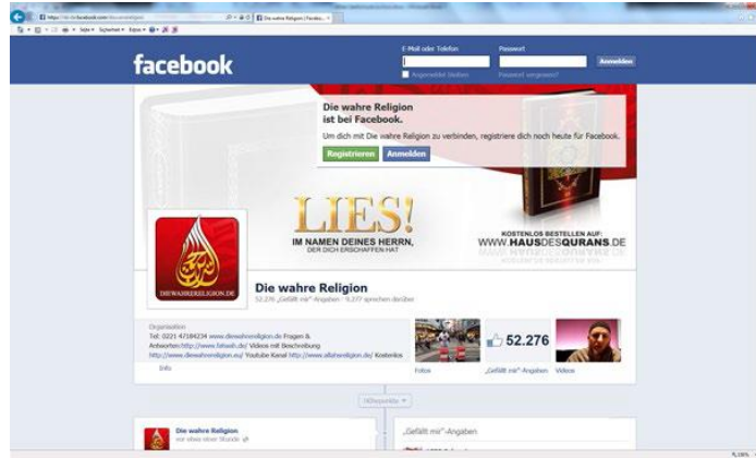
Selefi içerikli bir facebook sayfası örneği

İnternet özellikle sosyal ağlarda ve video portallarında selefi propagandayı kolay elde edilebilir ve sunulabilir vaziyette iyi imkanlar sunar. Genç insanlara vakitlerinin çok büyük bir kısmını geçirdikleri internette ulaşılmaktadır.