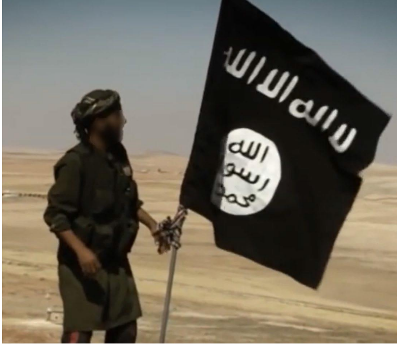
Suriye krizindeki el Kaide bayrağı

Örnek olarak Arap baharı ve Suriye krizi gibi Ortadoğu'daki önemli gelişmeler Kuzey Ren- Vestfalya'daki selefi görüntülerin tartışılma ve tasarımı üzerinde her zaman etkili olmaktadır. Somut bağlantı noktaları aşağı yukarı Mısır'daki politik sisteme yeni aktif katılımlı fikirler selefi partilerin kurulumunu sağlayabilmektedir. Ya da mesela Suriye'deki iç savaşı fırsat bilerek yeni selefi el-Qaide görünümünü kurabilmektedir.