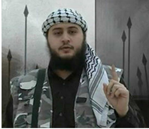
Cihad Propagandacısı Ebu Usame el Garib (Milleti İbrahim Derneđi'nin lideri)