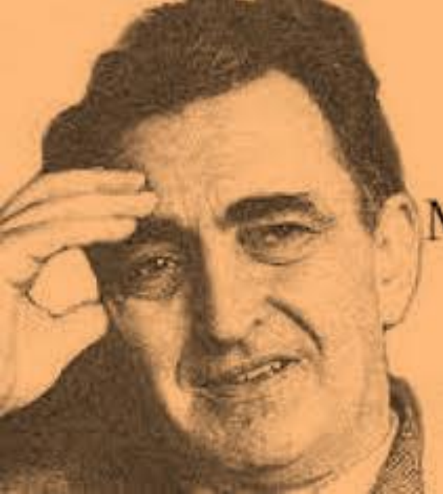
Mustafa Seyit Sutüven

nin su ile ilişkilendirildiği örneklere rastlanılmaktadır. Gülşen Sezen, Klasik Türk Şiirinde Su isimli kapsamlı doktora tezinde birçok divan şairinin suyu mitolojiyle ilişkilendirdiğini örneklerle açıklar. Bu örneklere bakıldığında suyun daha çok klasik Türk şiirinde Fars ve İslami mitolojilerle ilişkilendirilerek kullanıldığı görülmektedir. Mustafa Seyit Sutüven'i bu hususta özgün kılan ise beslendiği kaynağın daha çok Antik Yunan mitolojisi olmasıdır. Sutüven'in şiirinde suyu Antik Yunan mitolojisiyle nasıl özgün bir şekilde ilişkilendirdiğine geçilmeden önce Yunan mitolojisinin "Sutüven" (1934) şiirinin yazıldığı döneme kadar Türk edebiyatındaki serüvenine kısa bir göz atmak yerinde olacaktır: