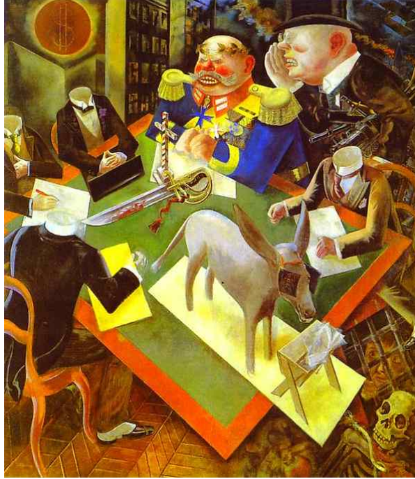
Resim 2. George Grosz, 'Güneş Tutulması/ Eclipse of Sun', 1926, Tuval Üzerine Yağlı Boya, 210 x 184 cm. Heckscher Müzesi, ABD