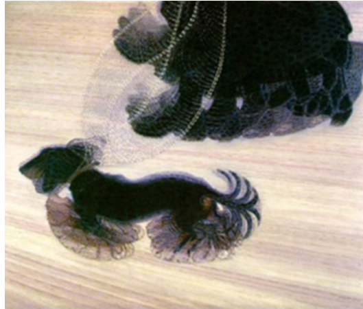
Resim 1. Giacomo Balla, 1912, ‘Tasmalı Bir Köpeğin Dinamizmi/ Dynamism of a Dog on a Leash’, Albright-Knox Art Gallery, Buffalo, New York