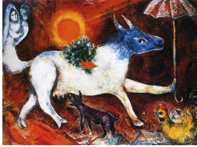
Resim 4. Marc Chagall, 1946, 'The Cow With Sunshade/Güneşlikli İnek' , Yağlı Boya, Boyut: 77.5 x 106 cm, Özel Koleksiyon

Kaynak: http://www.wikiart.org/en/marc-chagall/cow-with-parasol-1946 ( Erişim Tarihi: 01.04.2016).