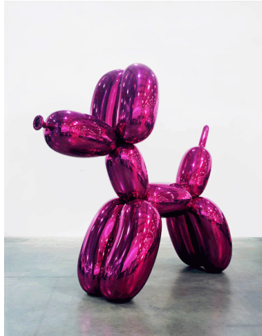
Resim 9. Jeff Koons, 1994-2000, ‘Balloon Dog/Balon Köpek’, Transparan Renk İle Kaplanmış Cilalı Paslanmaz Çelik, 307.3 x 363.2 x 114.3 cm

Kaynak: http://www.jeffkoons.com/artwork/celebration/balloon-dog-0#sthash.zEOJfhBN.dpuf (Erişim Tarihi: 30.03.2016).