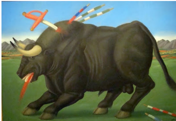
Resim 8. Fernando Botero, 1985, ‘Ölmek Üzere Olan Boğa/Dying Bull’, Tuval Üzerine Yağlı Boya,110x160 cm