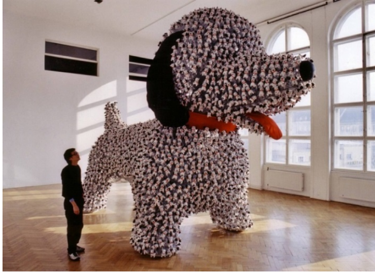
Resim 10. Hung-Chih Peng, 2002, ‘Küçük Danny/ Little Danny’, 430x810x216cm, 3000 Oyuncak Köpek, Metal, Güç Kaynağı, Sensör