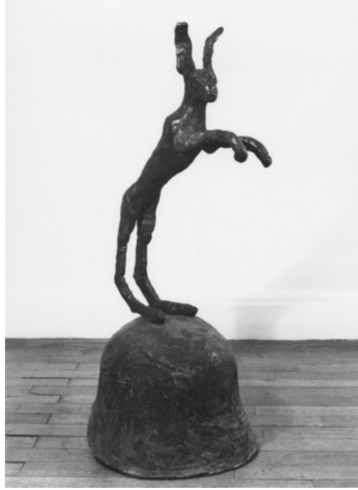
Resim 7. Bary Flanagan, 1980, ‘ Tavşan ve Miğfer I’ /Hare and Helmet I’, Bronz, 119.4 x 54.6 x 61 cm, Özel Koleksiyon, Londra

Kaynak: http://barryflanagan.com/artworks/view/13052/ ( Erişim Tarihi: 30.03.2016).