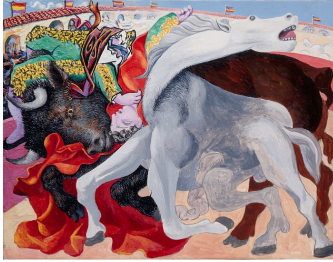
Resim 3. Pablo Picasso, 1933, 'Boğa Güreşi: Boğa Güreşçisinin Ölümü / Bullfight: Death of the Bullfighter', Ahşap Üzerine Yağlı Boya, Ulusal Picasso Müzesi, Paris, Fransa