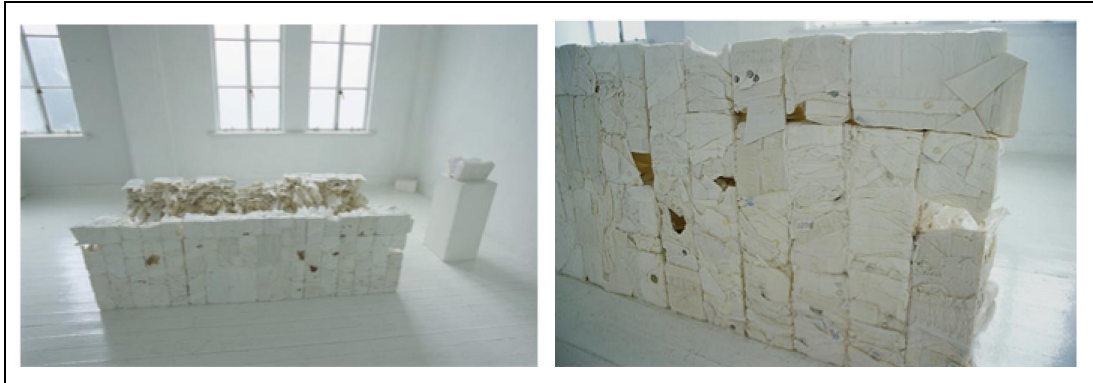
Resim 6. 'White Coffin', 205x85x65 cm, (Yoshimoto,2005)

Japon sanatçı Naoko Yoshimoto beyaz gömlek ve kumaşları kullanarak oluşturduğu bloklarını mekân içine yerleştirerek tekstil sanatına çağdaş bir yorum getirmiştir. Yoshimoto’nun bu çalışmalarında enstalasyon sanatının etkisini izlemek mümkündür (Resim.6).