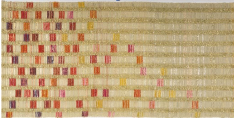
Resim 2. Guermonperez ait çalışma, (Guermonperez, yaklaşık 1963)

Dokuma alanında klasik ve geleneksel algıları ilk değiştirmeye çalışan kişinin Trude Guermonperez (1910-1976) olduğu düşünülmektedir. Çünkü 60ların başında dokumalarında atkı olarak el ile boyanmış benekler şeklindeki harfleri kullanmıştır ve bu bir ilktir. Ayrıca elle boyanmış çözümleri karmaşık yapıları dokularla birleştirerek alışılmadık ötesinde işler ortaya koymuştur (Resim 2).