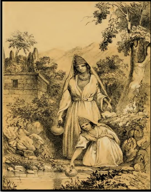
Resim II: Mardin Yakubileri (Badger, 1842: 55).