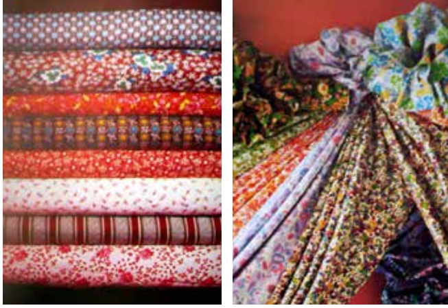
Resim 3. Sümerbank basma ve pazen kumaşları.

olan ilişkisini şekillendirmiştir. Guaj boya ile kağıt üzerine çizilen desenler üretim kapasitesine uygun olması için iki ila dört farklı renk kullanılarak tasarlanmıştır. Nazilli Basma Fabrikasında üretilen kumaşlarda seri üretim kapasitesi dahilindeki lineer geometrik kompozisyonlar ile Anadolu kültürünü temsil eden çiçekli ve folklorik desenler en belirleyici tasarım elemanları olmuştur. Sümerbank basma ve pazenlerinden dikilmiş tipik puanlı ve çizgi desenli pijamalar, okul önlükleri, elbiseler ve gömlekler bir dönemin standartlaşmış günlük giysilerini oluşturmuştur (Himam ve Pasin, 2011: 164). Himam ve Pasin'e göre (2011) kullanışlı, sağlam ve uygun fiyatlı Sümerbank kumaşları karakteristik desenleri ile Anadolu'da Sümerbank maddi kültürünün oluşmasına sebep olmuştur. Sümerbank tarafından üretilen dokuma kumaşlar geleneksel motifleri ve uygun fiyatları ile 1925 yılında gerçekleşen Kılık Kıyafet Devrimi'nin Anadolu'da yayılmasına da vesile olmuştur. İzmir Halkapınar Basma Sanayi İşletmesinde geliştirilen tekstil desenleri İzmir Ekonomi Üniversitesi, Güzel Sanatlar ve Tasarım Fakültesi akademisyenleri tarafından arşivlenerek, 2015 yılında 'Bir Ulusu Giydirmek: 1956 – 2000 Yılları Arası Sümerbank Desenleri' adı ile sergilenmiştir (Bulgun, Adanır ve Himam, 2015).