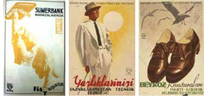
Resim 2. Farklı yıllarda Sümerbank Aylık Endüstri ve Kültür Dergisi'nde yayınlanan İhap Hulusi tasarımı afiş çalışmaları.

Sümerbank Aylık Endüstri ve Kültür Dergisi kapsamında yapılan içerik analizi çalışmasında ve yapılan literatür taramasında görüldüğü üzere Sümerbank fabrikalarında tasarım tekstil, ayakkabı ile porselen ve çini ürünlerinde