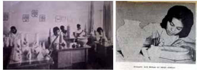
Resim 5. Sümerbank Yıldız Çini Fabrikası dekorasyon bölümünde çalışan Desinatörler.

Süslemeler kendilerinin, bir başkası beğenirse o da arkadaşının süslemesinden yararlanıyor. Desenleri bulmakta, onları işlemekte sanatçılar diledikleri gibi çalışıyorlar (Sümerbank Aylık Endüstri ve Kültür Dergisi, 1961).