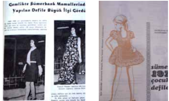
Resim 4. Sümerbank kumaşları kullanılarak Kız Meslek Enstitüleri ortaklığı ile gerçekleştirilen defile haberleri.

1980'lerle birlikte Sümerbank hazır giyim konusunda kendi markalarını yaratma yolunda adımlar atmıştır. Çocuk giyim markası olan özellikle okul önlükleri, yakaları ve ayakkabıları ile tanınan Uçan Balon bunlardan birisidir ve bu marka için ayrı satış mağazaları açılmıştır. Genç ve Genç ile Yeni Çizgi Sümerbank'a ait bir diğer hazır giyim markalarıdır. Ayrıca Çağdaş Çizgi isimli bir de ayakkabı markaları bulunmaktadır.