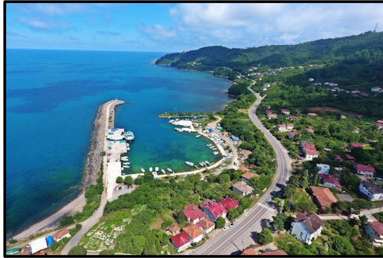
Resim 3. Efirli Camii (URL -4) Resim 4. Mersin Köyü Balıkçı Barnağı (URL -5)

Perşembe; otel, turizm ve konaklama gibi faaliyetler konusunda çok fazla aktif değildir. Genel olarak doğal güzellikleri, denizi, yaylaları, gölleri gibi doğa harikası alanları için bol miktarda günübirlik turist almaktadır. Ekonomik faaliyeti Cittaslow olduktan sonra daha çok yöresel mutfak konusunda aktiflik göstermektedir (Yıldırım ve Karahmet, 2013; Perşembe Belediyesi, 2021).