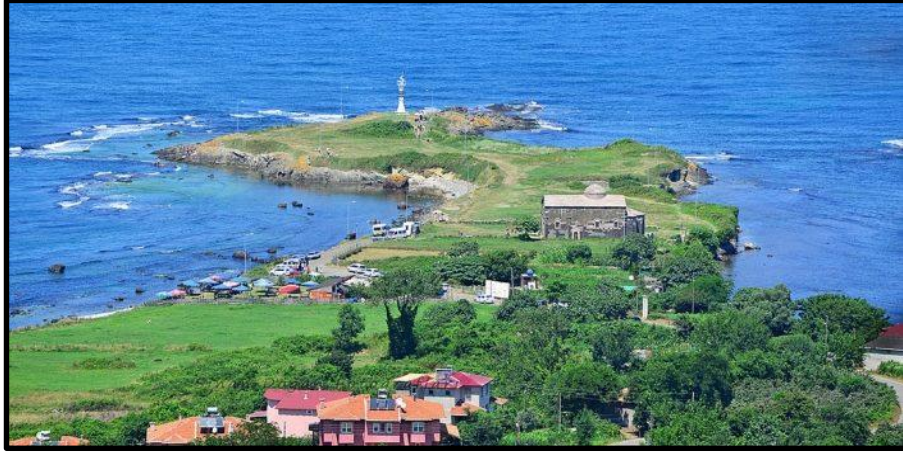
Resim 5.Yason Burnu (URL -6)