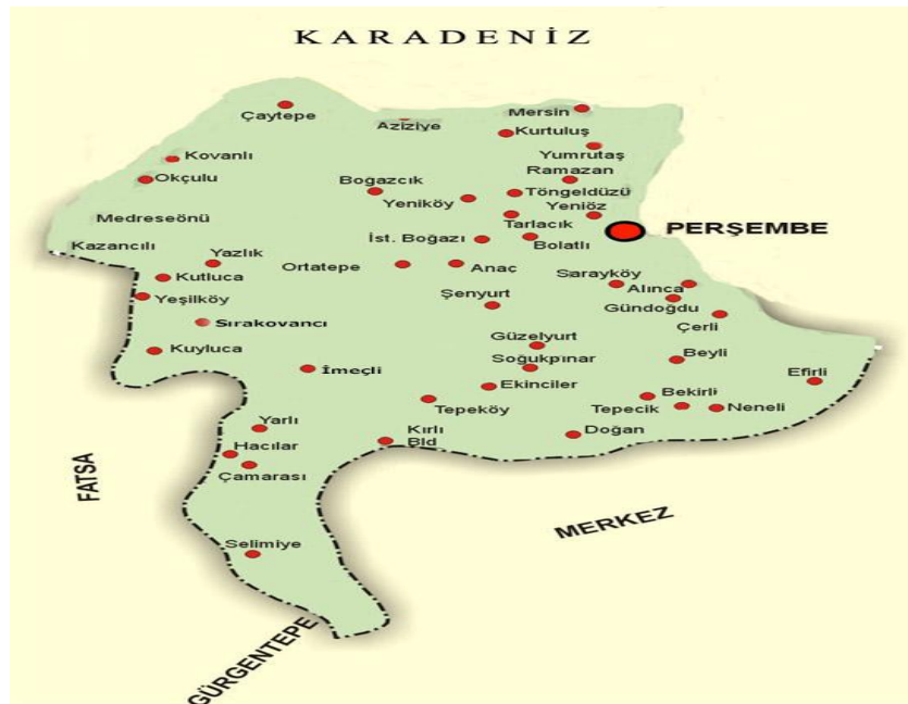
Şekil 1. Perşembe'nin Konumu (URL -1)

Çalışmanın evreni Perşembe ilçesi olarak belirlenmiştir. Perşembe'de bilinen ilk medeniyetler; Paplagonia, Khalybas ve Mossynoikoı'dır. 2021 yılına kadar birçok medeniyete ev sahipliği yapan Perşembe üzerinde geçmiş medeniyetlerden kalma birçok dini ve ekonomik tarih izleri taşımaktadır (Çelik, 2002). Vona 1270-1380 arasındaki yıllarda Türkmen Hacı Emiroğulları Beyliği'nin çabaları fethedilerek Türk yerleşkesi olmuş ve Türkmen bölüklerinin yerleştirilmesiyle Niyabet-ı Satılmış (Perşembe) kurulmuştur. Bölgenin Selçuklu ve Danişmentler tarafından fethedilmesiyle Vona Kalesi'ne sığınan Hıristiyanlar Lozan'a kadar Türklerle birlikte yaşamışlardır (Özdemir, 2005: 497).