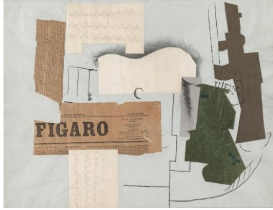
Resim 1. Pablo Picasso, Vieux Marc Şişesi, Kadeh, Gitar ve Gazete, 1913, Kağıt üzerine mürekkep ve baskılı kağıtlar, 46,7 x 62,5 cm, Tate, Londra.