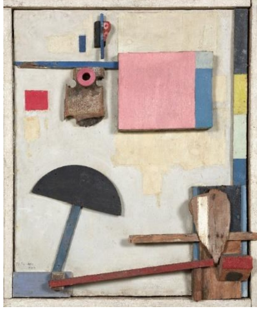
Resim 2. Kurt Schwitters, Merzbild Kijkduin, 1923, Oil, pencil and wood assemblage on cardboard. 74,3 x 60,3 cm, Museo Nacional Thyssen-Bornemisza, Madrid

Biraz daha asamblaj üzerine duracak olursak asamblaj terimi literatürde hiç yokken kullanılmıyor iken Kurt Schwitters (1887-1948) yapmış olduğu bu tarz işlere Merz adını vermiştir. Schwittersin Merz için açıklamaları şu yöndedir; Merz sıkı bir sanatsal çalışma sonucu ortaya çıkmış disiplindir. Sanatsal yaratıcılıkla tüm zorluklardan kurtulmayı hedefleyen bir çalışma şeklidir (Thompson, 2014: 167). Asamblaj terimini literatüre kazandıran isim Jean Dubuffet olmuştur. Karışık tekniklerde birçok işleri olan Dubuffet asamblaj tekniği üzerine sanat tarihine girmiş hatırı sayılır işi olmamasına rağmen asamblaj terimini hayata geçirmiştir.