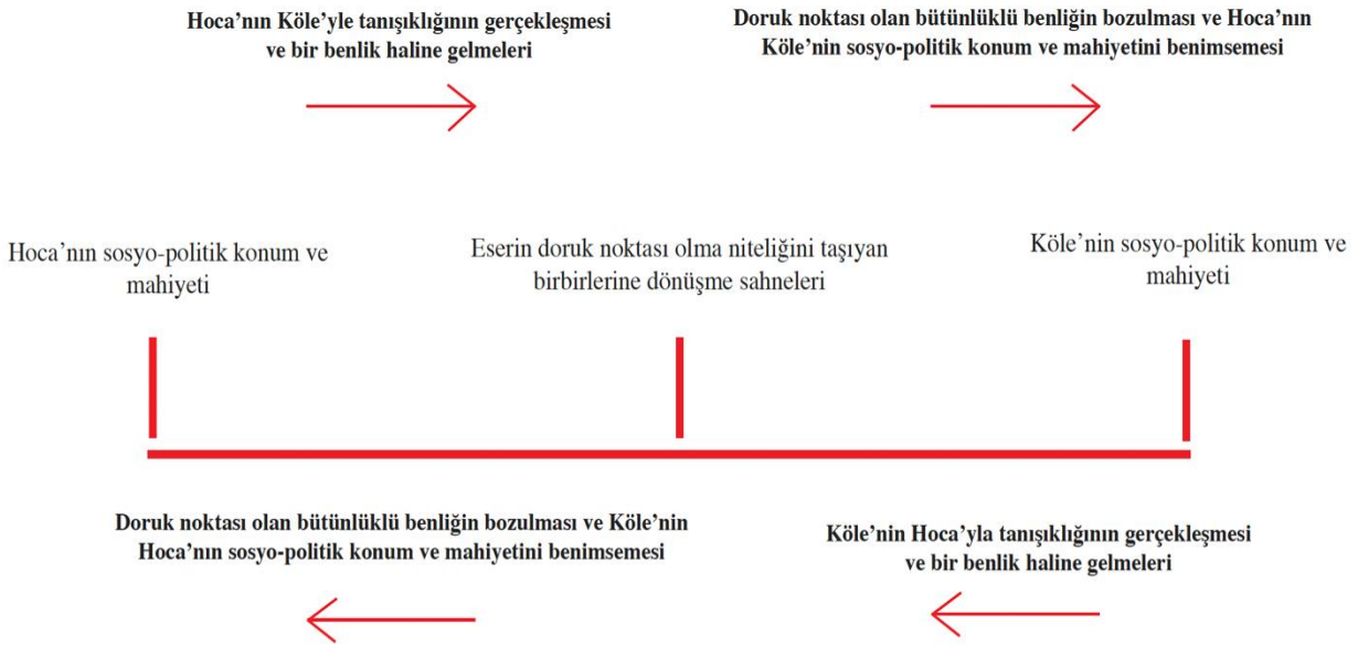
Şekil 3: Eser boyunca Hoca ve Köle'nin yer değiştirme yolculuğu

Verilen alıntıdan anlaşılacağı üzere Köle, Hoca'nın ağzından konuşmaya başladıkça, düal benlik meselesi okuyucu algısında güçlenir ve köklenir. Fakat doruk noktalarının ana elementleri olan düal benlik imgesi, Freytag Piramidi'ndeki “düşüş noktası” işe dâhil olunca bozulmaya başlar. Bu düşüş noktası Osmanlı Ordusu'nun Doppio Kalesi'ni (Beyaz Kale) kuşatmada başarısız olması ile başlar. Silahı başarısız olduğu için Padişah'ın onu idam edeceğinden korkan Hoca, Köle ile yer değiştirmeyi teklif ederek Venedik'e gitmek için yola koyulur. Böylelikle düşüş noktasında karakterlerin yer değiştirme önermesiyle tanışan okuyucu, ilerleyen sayfalarda iki karakterin konum ve mahiyetlerinin yer değiştirdiğine şahitlik eder. Şekil 3'te de görüldüğü üzere, Köle, Hoca'nın anlatıya ilk dâhil edildiği sosyo-politik konuma; Hoca da Köle'nin anlatıya ilk dâhil edildiği sosyo-politik konuma geçer.