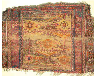
Fotoğraf 18: Döşemealtı Halısı, Halelli, Antalya Arkeoloji Müzesi Etnografya Bölümü, Env. nu: 8.28.73.

162x108cm, Gördes düğümü ile dokunmuştur ve dm2'deki düğüm sayısı 30x30, çözüğü beyaz doğal yün, atkısı kiremit kırmızısı yün, düğümleri ise boyanmış yün ve doğal renkli yündür. Saha çalışmalarında genellikle zemin renginde yeşil ve kırmızı kullanılmıştır. Kenar suyunda "tutmaç, kocasu, develi su nadiren nacaklı su"; göbek kısmında "el, arap, dokuzlu top, halelli" desenleri kullanılmıştır. Halelli Halılar taban ve seccade boyutundadır. Seccade boyundaki halılarda kenar suyu tek sıra kullanılmıştır. Yörede en yaygın dokunan halılardandır (Bkz. Fotoğraf 18).