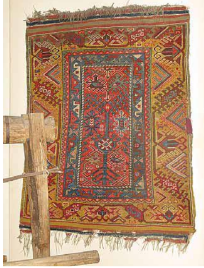
Fotoğraf 17: Döşemealtı Halısı, Halelli, Antalya Arkeoloji Müzesi Etnografya Bölümü, Env nu:1.31.75 (Öznur Aydın, 2009).

118x91cm. ölçülerindedir. Gördes düğümü ile dokunmuştur. Dm2'deki düğüm sayısı 30x30, çözüğü beyaz yün, düğümleri ise doğal renkli yündendir (Bkz. Fotoğraf 17).