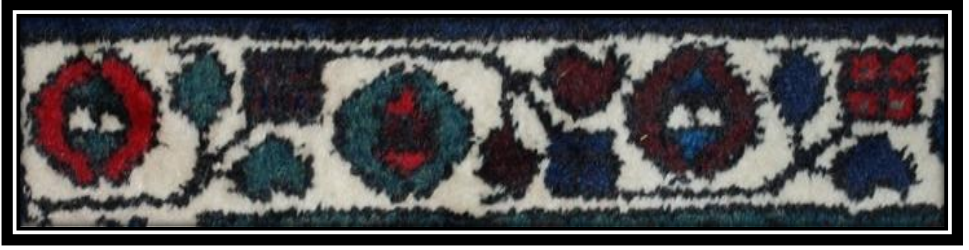
Fotoğraf 3: Büyük Albay Suyu Motifi detay görünümü (Derya Elgün, 2014)

Lâleli Su: Yayvan ve stilize çiçeklerden meydana gelen bir süslemedir.