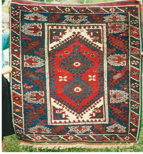
Fotoğraf 28: Döşemealtı Halısı, Akrepli Halı, Kovanlık Köyü (Öznur Aydın, 8 Mayıs 1991).