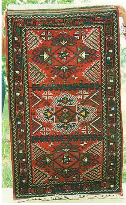
Fotoğraf 33: Döşemealtı Halısı, Kovanlık Köyü (Öznur Aydın, 1991).