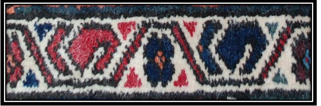
Fotoğraf 10: Küçük Albay Suyu Motifi detay görünümü (Derya Elgün, 2014)

Küçük Albay Suyu: Bir ters bir düz yerleştirilmiş geometrik desenler arasındaki iri stilize çiçek, küçük üçgen dolgular ve geometrik şekillerden meydana gelen bir süslemedir.