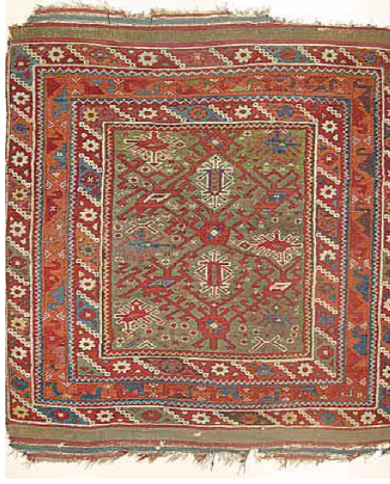
Fotoğraf 23: Döşemealtı Halısı, Sekizkollu yıldız suyu ile bezenmiş, Antalya Arkeoloji Müzesi Etnografya Bölümü, Env. nu:1.10.75 (Öznur Aydın 2009).