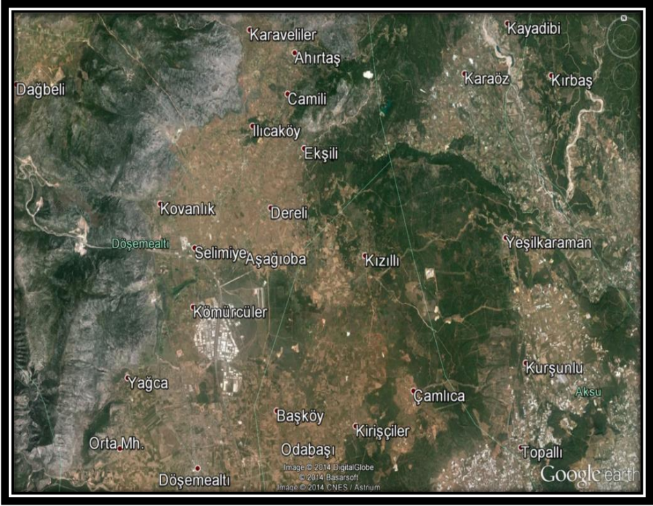
Fotoğraf 1: Döşemealtı ve Köylerinin Konumu (Döşeme Altı Haritası 2019)

Antalya civarında “Teke, Karakoyunlu”, Gazipaşa ve çevresinde “Bahşiş ve Sarıkeçili”, Korkuteli yöresinde Söbüce Yaylası ile Antalya’nın kuzeyinde yer alan Döşemealtı düzlüğünde “Karakoyunlu ve Yeni Osmanlı yörükleri” yaşamaktadır. Ayrıca, çevrede konar-göçer halde yaşayan, yukarıda saydığımız Yörük gruplarına bağlı “Töngüşlü, Çoşlu, Saçıkarcılı, Eski Yörük, Hacı Hamzalı, Hacı Mehmetli, Çakallar, Ötkünlü, Karaevli, Karahacılı, Sarıhacılı, Karatekeli, Hacı Babalar yörükleri” bulunmaktadır. Tüm bu yörük gruplarının kendilerine özgü halı ve düz dokuma yaygı gelenekleri mevcuttur.