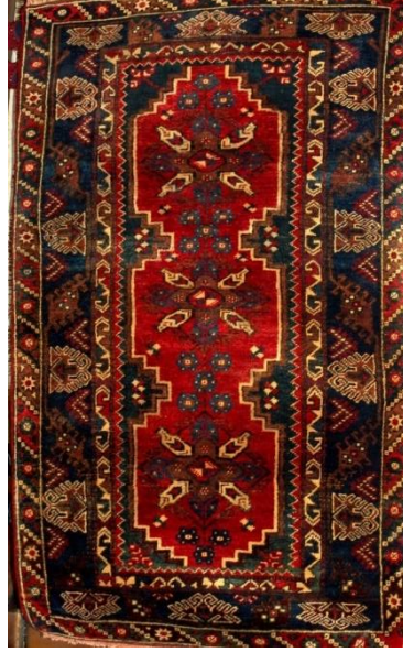
Fotoğraf 40: Antalya – Döşemealtı – Killik Köyü – Ekrem EKİN – 113x187 cm – 24x25 kalite. Kenar suyu; tutmaç, koca sulu, yantır, şingır, develı su, bulanık su ortası terazi toplu, patates çiçeđi, dokuz top (Derya Elgün, 2014).