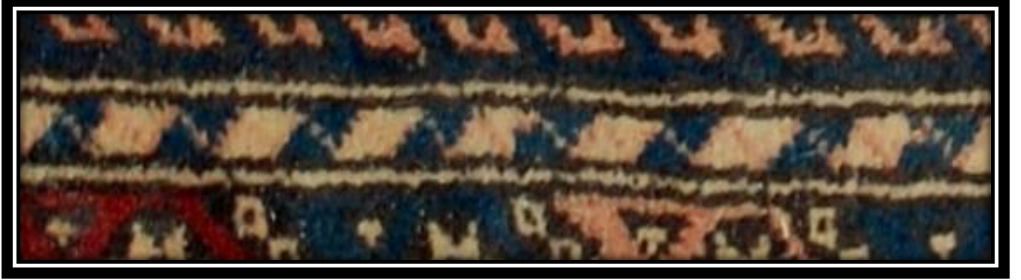
Fotoğraf 9: Motor İzi Suyu Motifi detay görünümü (Derya Elgün, 2014)

Motor İzi Suyu: Birbirine paralel ve vev yerleştirilen kısa hatlardan meydana gelmekte, motorlu bir vasıta lastiğinin bıraktığı izi benzemektedir.