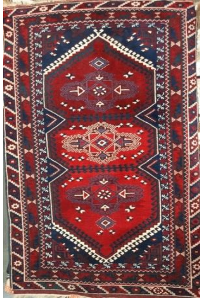
Fotoğraf 34: Antalya- Döşemealtı- Karataş Köyü, Koleksiyoner Halil Börekçi, 122x180 cm / 26x33 kalite. Kenar suyu "tutmaç, develi su, çingilli su, bulanık su ortası kocasulu, heybe suyu, dokuz top, kıvrım, şingır, dikenli top, meme ucu çiçeği" kullanılmıştır (Derya Elgün, 2014).