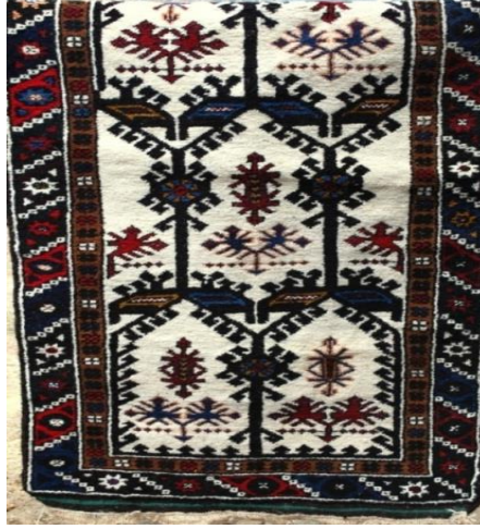
Fotoğraf 22: Antalya- Döşemealtı-Kovanlık-Dudu Gökçe-89x227 cm-21x31 kalite, Kenar suyu; tutmaç, çiçekli su, ortası halelli, arap, el (Derya Elgün, 2014)