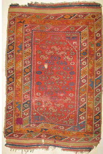
Fotoğraf 16: Döşemealtı Halısı, Yıldızlı, Antalya Arkeoloji Müzesi Etnografya Bölümü, Env nu:8.28.73 (Öznur Aydın, 2009).

162x108 cm. ölçülerindedir. Gördes düğümü ile dokunmuştur ve dm2'deki düğüm sayısı 30x30, çözgüsü beyaz yün, düğümleri ise doğal renkli yündendir (Bkz. Fotoğraf 1Fotoğraf 16).