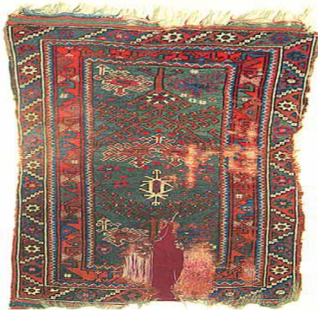
Fotoğraf 20: Döşemealtı Halısı, Halelli, Antalya Arkeoloji Müzesi Etnografya Bölümü, Env. nu: 1.3.79 (Öznur Aydın, 2009).

81x122 cm. boyutlarındadır. Gördes düğümü ile dokunmuştur. Dm 2 'sinde düğüm sayısı 30x30, çözgüsü beyaz doğal yün, atkısı kırmızısı yün düğümleri ise boyanmış yün ve doğal renkli yündür (Bkz. Fotoğraf 20 ve Fotoğraf 21).