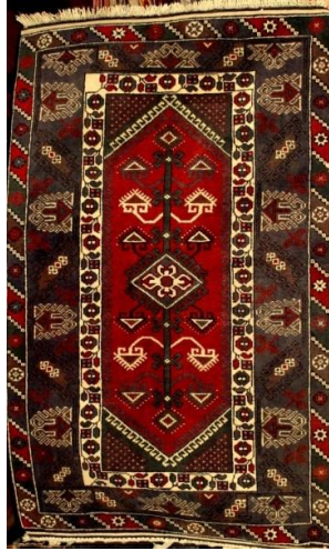
Fotoğraf 32: Antalya-Döşemealtı Dallı Kocasulu Halı-Killik-Ekrem Ekin-113x187 cm / 25x24 kalitelidir. Kenar suyunda, “tutmaç, kocasulu, yantır, meme ucu çiçeği, albay suyu ortası dallı akrepli, kıvrım, para” desenlidir (Derya Elgün, 2014).