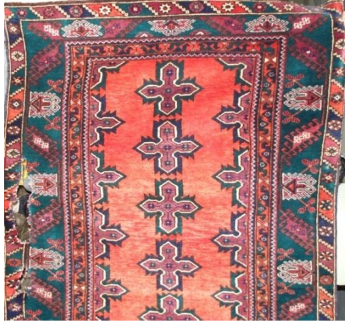
Fotoğraf 26: Antalya- Döşemealtı-Karataş Köyü-Koleksiyoner-Halil Börekçi-145x270cm-28x35 kalite. Kenar suyu; tutmaç, kocasulu, yanır, meme ucu çiçeği, develi su, bulanık su ortası 9 adet toplu, kenarlarda yarım top (Derya Elgün, 2014).