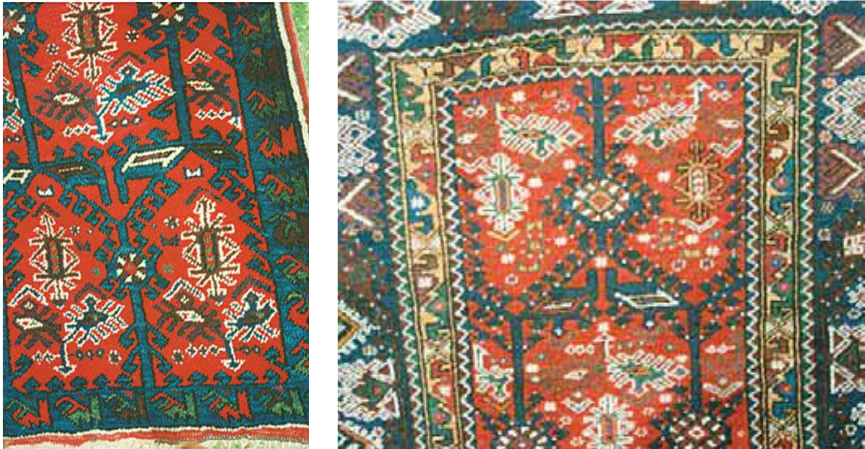
Fotoğraf 24: Döşemealtı Halısı, Halelli yolluk (soldaki) ve seccade halısı (sağdaki), Kovanlık Köyü (Öznur Aydın, 8 Mayıs 1991).

165x126 cm, cm 2 'deki düğüm sayısı 3x4'tür. Kırmızı yeşil, beyaz, mavi, kahverengi renktedir. Zeminde stilize kuş, ala para, Arap eli yıldız, yantır, şingır, mersin topları ve kıvrım motifleriyle süslüdür. Kenar suyunda ise içten dışa doğru tutmaç suyu, bulanık su, develi su, develi su, bulanık su, tutmaç suyu vardır.