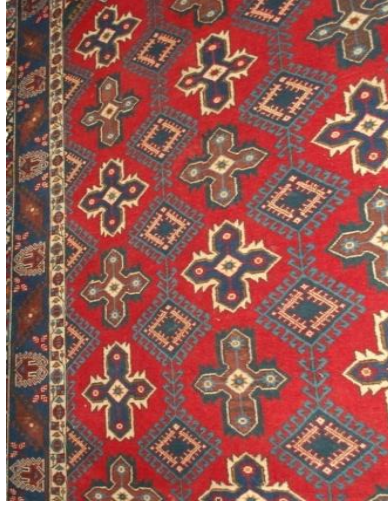
Fotoğraf 27: Antalya- Döşemealtı-Ekşili-Ayşegül Çelik-196x291 cm / 28x26 kalite.

Kenar suyu; tutmaç, kocasulu, yantr, meme ucu çiçeği, albay suyu ortası 18 adet toplu, kıvrım, heybe suyu, şıngır (Derya Elgün 2014).