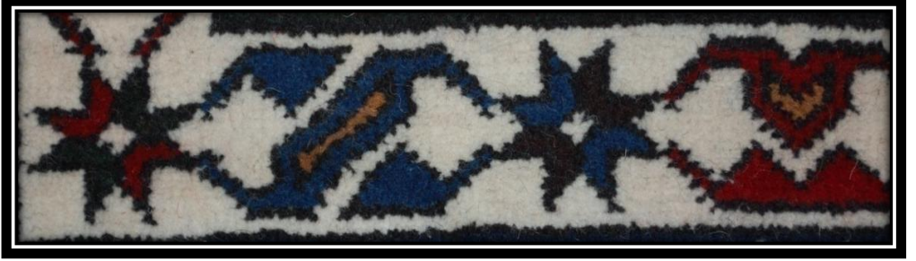
Fotoğraf 6: Çingilli Su (Göynek Yanışı) Motifi detay görünümü

Çingilli Su (Göynek Yanışı): İç su üzerinde kullanılmaktadır. Gömleklerin yaka ve etek uçlarına yapılan kanaviçe deseninden esinlenerek geliştiği söylenmektedir.