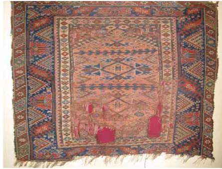
Fotoğraf 14: Döşemealtı Halısı, Kocasulu, Antalya Arkeoloji Müzesi Etnografya Bölümü, Env. Nu: 1.9.78 (Öznur Aydın, 2009).

136x120 cm. boyutlarındadır. Gördes düğümü ile dokunmuştur. Dm2'de 30x30 düğüm vardır. Çözgüsü beyaz doğal yün, atkısı kırmızı yün, düğümleri ise boyanmış ve doğal renkli yündendir. Zeminde çivit mavisi ve kırmızı renk yaygındır. Kenar suyunda "tutmaç, develi su, kocasu ve çingilli su", göbek kısmında "kocasu, patates çiçeği, kıvrım, dokuzlu top, şingır", ortasında ve köşe kısmında "heybe suyu" deseni kullanılmıştır (Bkz. Fotoğraf 14).