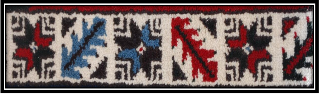
Fotoğraf 7: Mersin Yapağı Suyu Motifi detay görünümü (Derya Elgün, 2014)

Mersin Yapağı Suyu: Yaprak motiflerinden meydana gelen bir süslemedir. Yörede yetişen mersin ağacı yapraklarına benzetilmektedir.