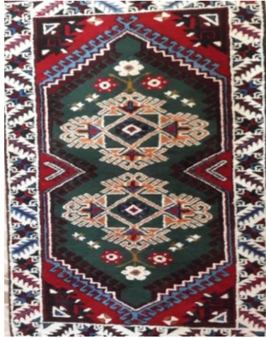
Fotoğraf 39: Antalya – Döşemealtı – Kovanlık Köyü – Fatma YENEN – 76x139 cm – 23x27 kalite. Kenar suyu; mersin yaprağı, ortası kocasu, heybe suyu, kıvrım, şıngır, patates çiçeği (Derya Elgün, 2014).