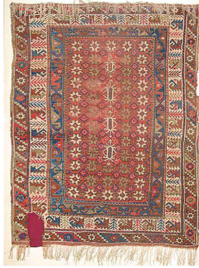
Fotoğraf 19: Döşemealtı Halısı, Tutmaç toplu, Antalya Arkeoloji Müzesi Etnografya Bölümü, Env nu: 2.18.81 (Öznur Aydın, 2009).

Gördes düğümü ile dokunmuştur. Dm 2 düğüm sayısı 30x30 çözgüsü beyaz doğal yün, atkısı kırmızısı yün düğümleri ise boyanmış yün ve doğal renkli yündür, 142x110cm ölçülerindedir (Bkz. Fotoğraf 19).