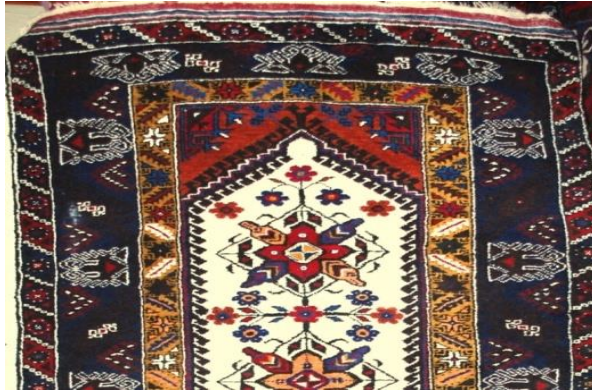
Fotoğraf 30: Antalya- Döşemealtı-Kovanlık-Fatma Yıldırım- 135x260 cm / 21x25 kalite. Kenar suyu “tutmaç, kocasu, yantır, şingır, mersin yaprağı ortası terazili top, heybe suyu, patates çiçeği, meme ucu çiçeği” desenleri ile süslenir (Derya Elgün, 2014).

Zemin renginde beyaz ve turuncu kullanılmıştır. Kenar suyunda “tutmaç, mersin yaprağı suyu, kocasu, develi su, çingilli su ve s’li su”, göbek kısmında “terazili top, patates çiçeği, meme ucu çiçeği, arap, yıldız”, köşelerde de “heybe suyu” motifi kullanılır. Seccade ve taban halısı tipleri dokunmaktadır.