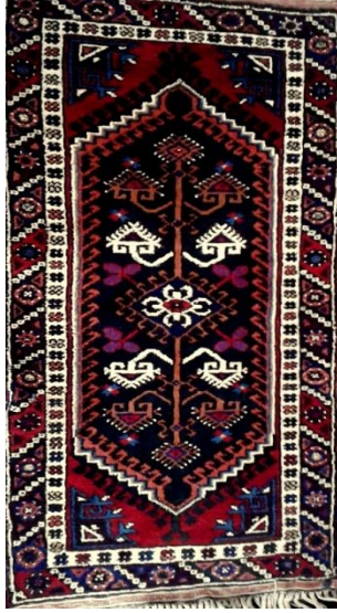
Fotoğraf 38: Antalya - Döşemealtı – Kovanlık Köyü – Fatma YILDIRIM - 76x139 cm 22x32 kalite. Kenar suyu; tutmaç, kedi izi, orası dallı akrepli, kıvrım, mersin yaprağı çiçeği, heybe suyu, dokuz top (Derya Elgün, 2014).

Zemin rengi kırmızı ve çivit mavisi ağırlıklıdır. Kenar suyu motiflerinde "tutmaç, kocasu, mersin yaprağı suyu ve çingilli su"; göbek kısmı motiflerinde de "akrep, dallı, koyun hapı, dikenli top, kıvrım, meme ucu çiçeği, vazolu", köşelerde "heybe suyu" ile karakteristiktir. Taban ve yolluk halısı tipleri görülür.