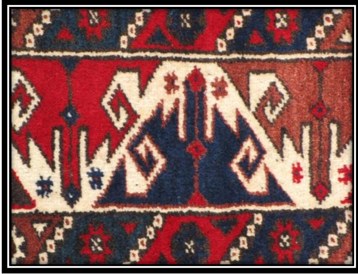
Fotoğraf 11: Nacaklı Su Motifi detay görünümü (Derya Elgün, 2014)

Kedi İzi: Kedi izine benzetilen bir desendir.