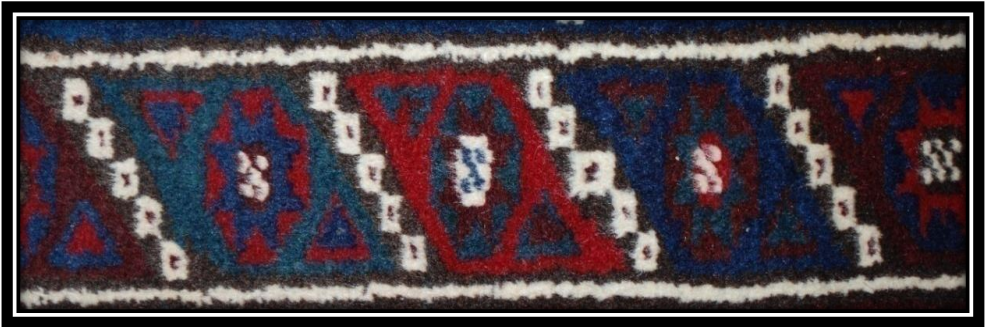
Fotoğraf 5: Tutmaç Suyu Motifi detay görünümü

Tutmaç Suyu: Eski halılarda enli, yeni halılarda dar kenar suyunda kullanılmaktadır. Çok kullanılan ve kökü çok eskilere giden bir su motifidir. Çevre şekilli "koyungözü" dizileri arasına yerleştirilmiş iri, sekizgenlerin çiçek haline getirilmiş yıldızı andıran bir süslemedir. Koyungözü dizilerine "boncuk", yıldızlara "tutmaç topu" ve köşelerdeki şekillere 'bıçak ucu' denilmektedir.