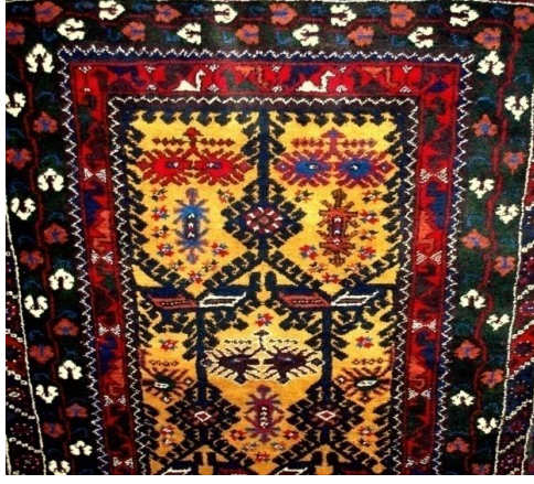
Fotoğraf 21: Antalya- Döşemealtı-Kovanlık Köyü-Fatma Yıldırım-138x239 cm/23x29 kalite. Kenar suyu; tutmaç, koza çiçeği, bulanık su, develi su, ortası halelli, arap, dokuzlu top, el (Derya Elgün, 2014).