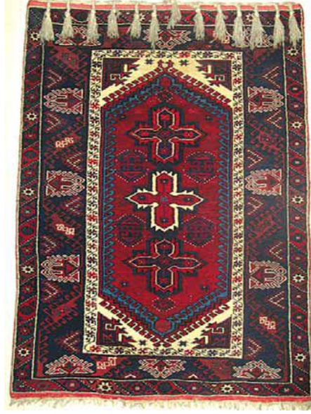
Fotoğraf 25: Döşemealtı Halısı, Üç Toplu Kocasulu, Kovanlık Köyü (Öznur Aydın, 8 Mayıs 1991).

Kovanlık Köyü'nde çeyizlik amacı ile dokunmuştur. 115x164 cm boyutlarındadır. Dm 2 'deki düğüm sayısı 30x40'tır. Renkleri koyu mavi, al, beyaz, yeşildir. Seccadenin orta zemininde top (yıldız), kenar suyunda ise içten dışa doğru kaydırma, tutmaç suyu, dokuzlu yıldızlı top, kaydırma, tutmaç suyu yanışları yer alır.