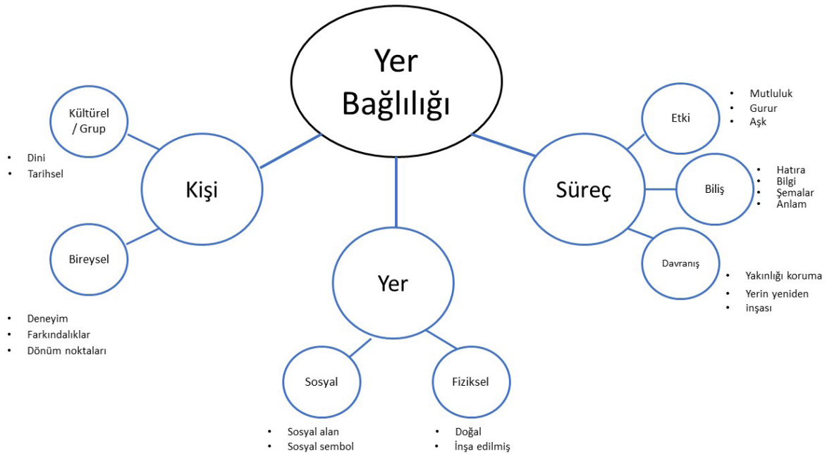
Şekil 1. Yer Bağlılığının Üçlü Modeli (Scannell & Gifford, 2010)

Bu modelde kişi boyutu, kimin bağlılık duyduğunu açıklayarak bireysel ya da kolektif olarak yere yüklenen anlamları tanımlar. Bireysel anlamları, deneyimler ve kişinin hayatındaki önemli dönüm noktaları oluştururken, dini, tarihi ya da kültürel faktörler kolektif anlamları meydana getirir (Scannell & Gifford, 2010). Kişi boyutundaki en önemli unsur deneyimdir (Manzo, 2005). Deneyim ile birey bir yer ile bağ kurmakta ve ilişkisini sürdürmektedir. İkinci boyut olan süreç boyutunda bağlanmanın nasıl oluştuğu sorusuna yanıt aranır ve bağlılığının duygusal, bilişsel ve davranışsal yönlerine odaklanılır (Ayberk, 2018). Bu boyutun alt başlıkların etkilenim ( affect ), bir yere ilişkin olumlu ve olumsuz duyguların bağlılığa etkisini ortaya koyarken; bireylerin veya grupların bağlanma yerleri ile ilişkilendirdiği bilgileri, hatıraları ve anlamları içeren biliş ( cognition ), insan-yer