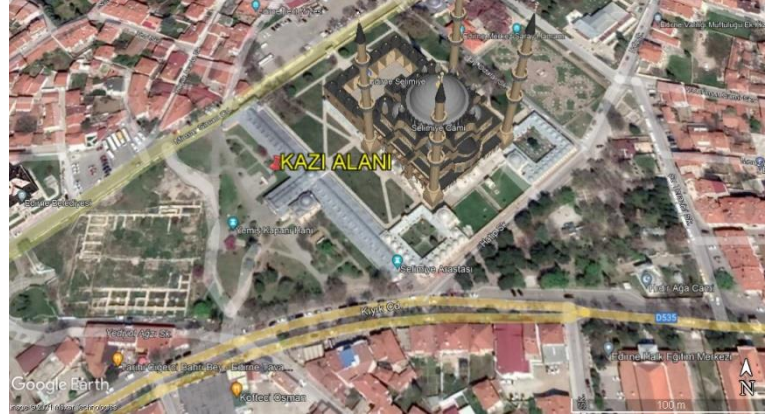
Resim. 1: Selimiye Külliyesi ve Kazı Alanının Konumunu gösteren uydu görüntüsü 4

çalışmaları sırasında ortaya çıkmış, Edirne Müze Müdürlüğü Başkanlığında yapılan kurtarma kazısı ile açılmıştır 3 .(Res. 1)