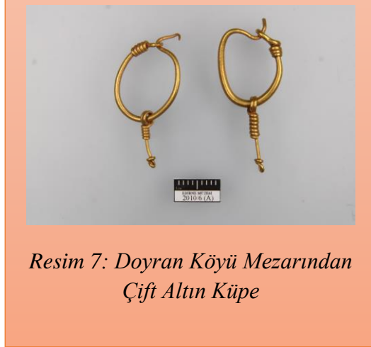
Resim 7: Doyran Köyü Mezarından Çift Altın Küpe

Örneğin Hasanağa köyündeki sanduka mezar kazısında bulunan bir adet bronz sikke, yoğun korozyonlu yapısına rağmen okunmuş ve MS. III. yy'a tarihlenmiştir 25 .