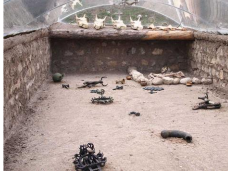
Resim 9: Alacahöyük Mezarlarından Birinin İç Sergileme Düzeni

Bunlardan konumuz için ideal bir çalışma görünümündeki Alacahöyük Kral Mezarları, ciddi bir örnek teşkil etmektedir. Alacahöyük'ün görkemli mimari kalıntılarının yanı sıra, önemli bilgiler edindiğimiz buluntu topluluğuna sahip on üç adet mezardan oluşur. Kenarları taşla örülmüş mezarlar, ahşap hatıllarla kapatılmış, damları üzerine kurban edilen sığırların başları ve bacakları yerleştirilmiştir. Prens ve prenseslere ait olduğu düşünülen ve Eski Tunç Çağı'na tarihlenen bu 13 mezarda süs eşyaları, güneş kursları, geyik ve boğa heykelleri, kama, kılıç, balta gibi savaş aletleri ile pişmiş toprak, taş, altın, gümüş, tunç, bakır ve elektrondan yapılmış eserler ve süs eşyaları bulunmuştur 36 . (Res. 8,9)