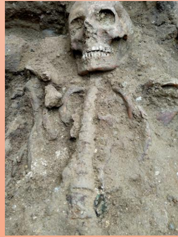
Resim 5: 4 Nolu İskeletin göğüs altında bulunan sikke

Boncukların üçü, genç ya da çocuk yaşta bir bireye ait olduğu tahmin edilen 5 numaralı iskeletin başı etrafında bulunmuştur. Boncuklar, mavi renkli camdan, yuvarlak formu ve