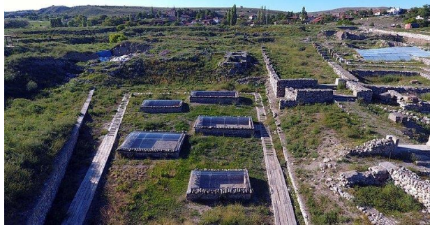
Resim 8: Alacahöyük Kral Mezarları ve Koruma- Sergileme Yöntemine Dair Görünüm

Anadolu coğrafyasında arkeolojik alan koruma ve sergilemenin tarihçesine bakıldığında, Prof. Dr. Halet Çambel'in Karatepe-Aslantaş Geç Hitit Kalesi'nde yapmış olduğu yerinde sergileme ve koruma çalışmaları bir öncül harekettir. Yerinde sergilemenin ve korumanın, sadece kültürel mirası korumakla sınırlı bir kavram olmadığını da yine bu çalışmalardan anlamaktayız. Bölgenin milli park ilan edilmesi, civar köylerin insanlarına burada çalışma alanlarının yaratılması, turizm anlamında çekiciliğin artması gibi konularda gelişme sağlanmıştır. Alan yönetimi, kültürel peyzaj, sürdürülebilir koruma gibi başlıklar da bunun takipçisi olmuş ve hem insanın, hem kültür mirasının hem de coğrafyanın toptan korunduğu müthiş bir bütüncül koruma anlayışı ortaya çıkmıştır 35