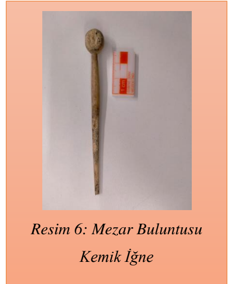
Resim 6: Mezar Buluntusu Kemik İğne

Yemiş Kapanı Meydanı'nda bulunan sanduka mezarın benzerleri Edirne ve yakın çevresindeki başka mezar örneklerden de bilinmektedir. Edirne iline bağlı Hasanağa, Doyran Köyleri ile Merkez ilçe Kevseç Balaban ve Meydan Mahallelerinde önceki yıllarda yürütülmüş olan kurtarma kazılarında da aynı tipolojiye uyan mezarlar bulunmuştur. Edirne İli, Merkez ilçeye bağlı Hasanağa köyü, Eskibağlık Mevkisi'nde yer alan ve tapuda 113 ada, 84 parselde Edirne Müzesi Müdürlüğü tarafından 2010 yılında yapılan kurtarma kazısı ile açığa çıkarılan mezar, gerek kullanılan malzemesi, gerekse tekne ve kapak taşlarının yerleştirilme biçimi ile Yemiş Kapanı Meydanı'ndaki mezar ile aynı özelliklere sahiptir. Hasanağa köyü sanduka mezarının, yığma toprağı tümüyle yok edilmiş bir tümülüse ait olduğu iddia edilmiştir 5