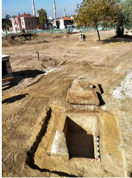
Resim 2: Kazı Başlangıcında Genel Görünüm

Sanduka mezarı örten kapak da yan duvarlarla aynı özellikteki taşlardanır. Orijinal yerinde tespit edilen iki kapak taşından doğu yandaki blok, üç parça halinde kırık olarak bulunmuştur. Birinci mezar kapağı 1,42 x 1,20 m ikinci mezar kapağı ise 1,47 x 1,12 m ölçülerindedir. Mezar teknesi dıştan 2,60 m x 1,46 m ölçülerindedir.