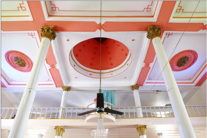
Resim 8- Irlamaz Köyü Camii. Harim tavanı.