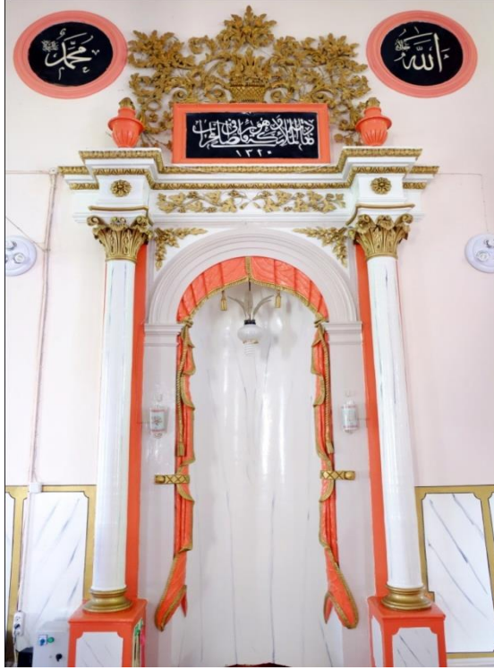
Resim 11- Irlamaz Köyü Camii. Mihrap.