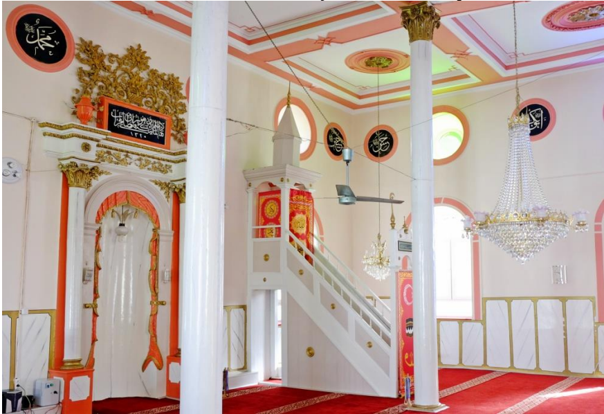
Resim 12- Irlamaz Köyü Camii. Mihrap ve minber.