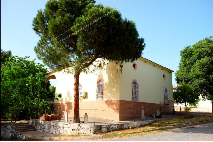
Resim 3- Irlamaz Köyü Camii. Güneybatıdan genel görünüm.