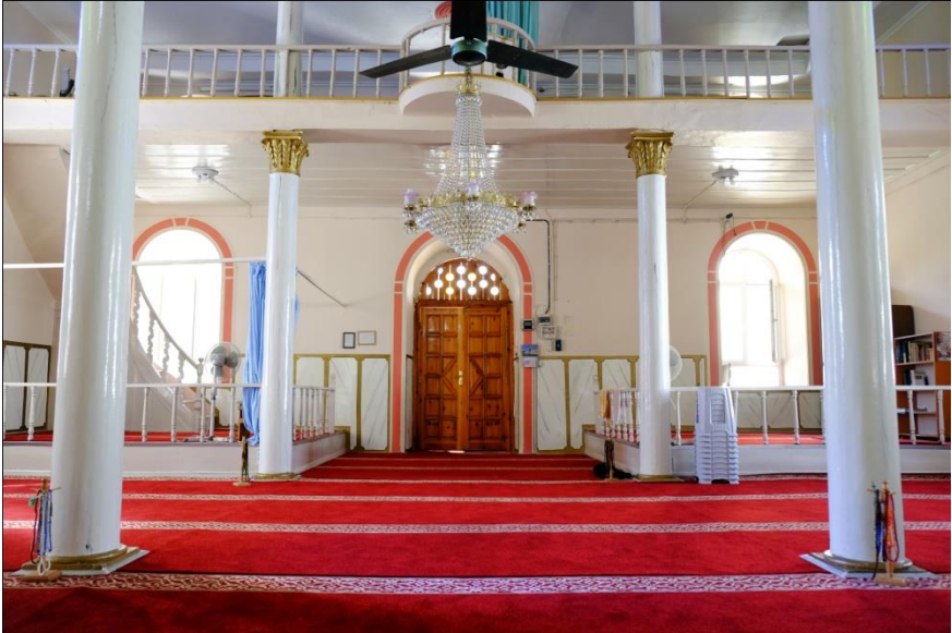
Resim 10- Irlamaz Köyü Camii. Harim kuzey duvarı.