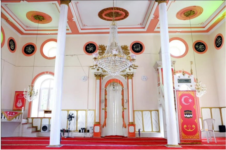
Resim 7- Irlamaz Köyü Camii. Harim güney duvarı.