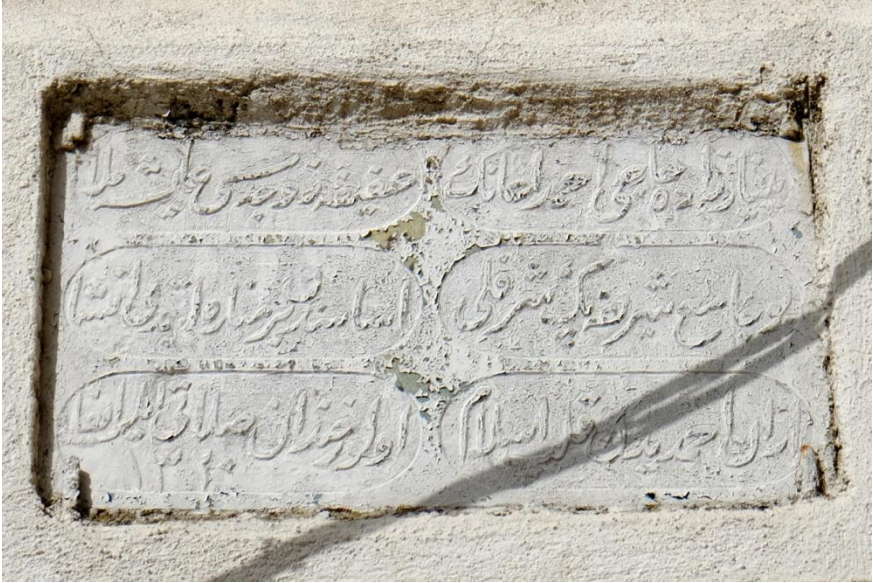
Resim 4- Irlamaz Köyü Camii. Minare inşa kitabesi.