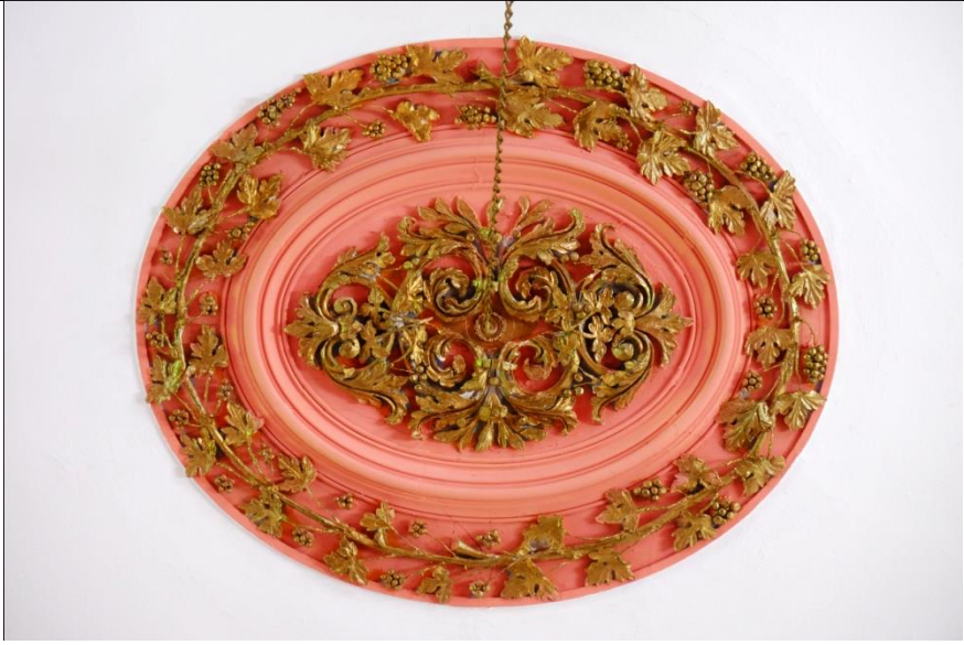
Resim 9- Irlamaz Köyü Camii. Harim tavanındaki alçı süslemeli göbek örneği.