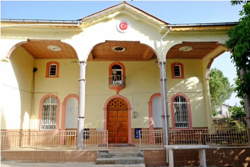
Resim 6- Irlamaz Köyü Camii. Kuzey cephesi.