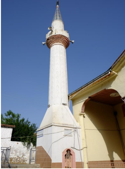
Resim 5- Irlamaz Köyü Camii. Minare.