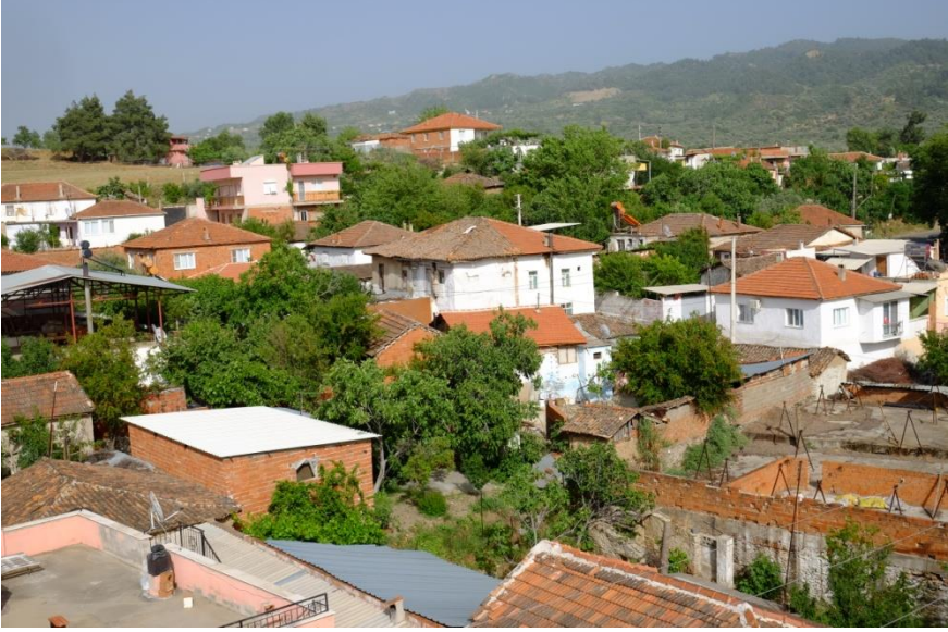
Resim 1- Irlamaz Köyü. Genel görünüm.