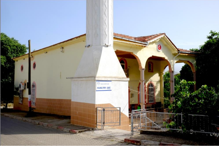
Resim 2- Irlamaz Köyü Camii. Kuzeydoğudan genel görünüm.