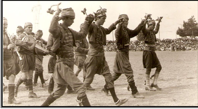
Resim 8: Bakras Karakeçililerinin Halk Oyunları Ekibi-Söğüt Şenlik Sahası (Ateş, 2001:8)

“Söğüt’e gelen Karakeçililer, cumartesi gecesı düzenlenen gece etkinliklerinde yakın ve uzak çevreden gelen tüm misafirlere karakeçili adetleri ile ilgili bir program sunarlardı. Bu adetler temsili olarak gerçekleştirdikleri kına gecesı, gelin yası, folklor gösterileri vb. etkinliklerden oluşurdu. Pazar sabahı ise hükümet konağı önünde şenliğe gelen tüm Yörükler toplanır, açılış konuşmaları yapıp Karakeçililer halk oyunlarını gösterilerini yaparlardı”.