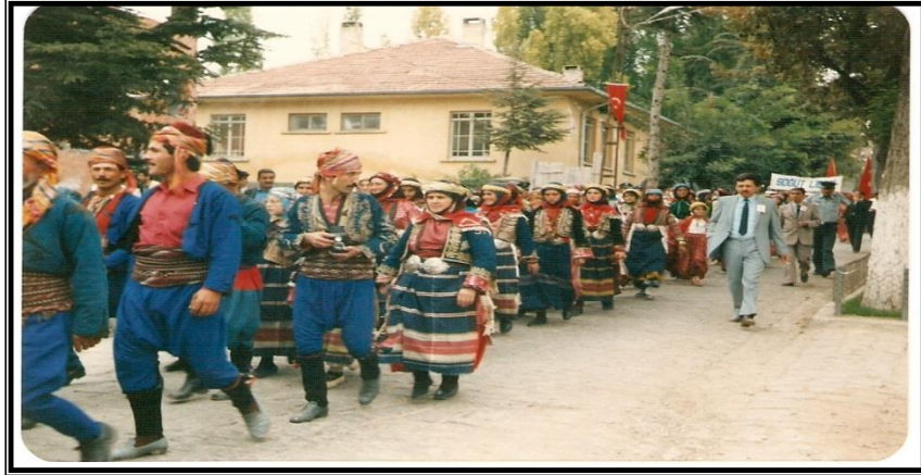
Resim 9: Bakras Karakeçililerinin Tören Alanından Ertuğrul Gazi Türbesine Yürüyüşleri (Ateş, 2001:9).

“Söğüt’e gelen Karakeçililer, cumartesi gecesı düzenlenen gece etkinliklerinde yakın ve uzak çevreden gelen tüm misafirlere karakeçili adetleri ile ilgili bir program sunarlardı. Bu adetler temsili olarak gerçekleştirdikleri kına gecesı, gelin yası, folklor gösterileri vb. etkinliklerden oluşurdu. Pazar sabahı ise hükümet konağı önünde şenliğe gelen tüm Yörükler toplanır, açılış konuşmaları yapıp Karakeçililer halk oyunlarını gösterilerini yaparlardı”.