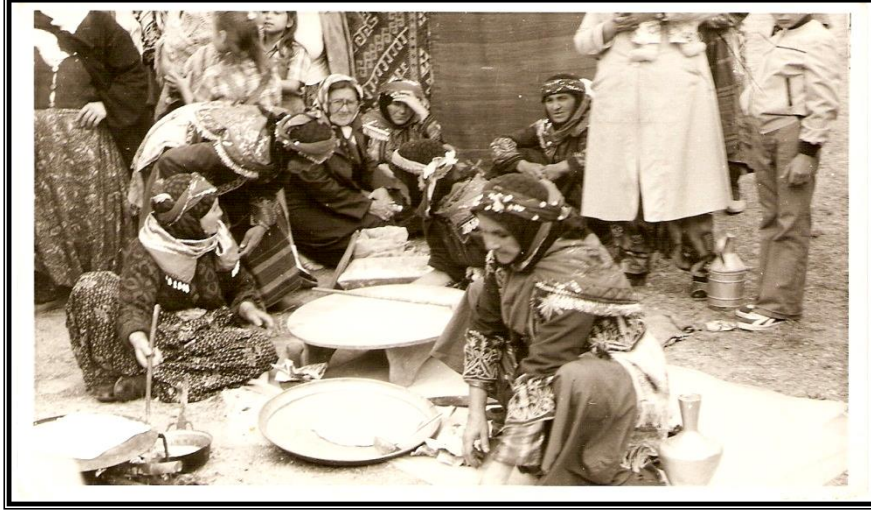
Resim 7: Günyurdu (Bakras) Karakeçililerine Mensup Yörüklerin Gözleme yapımı (Ateş, 2000:3).

Gözleme ve Etlı Bulgur Pilavı obanın deęişilmez menüsüdür. Gözleme ve pilav için köylülerden yardım toplanırdı. Her hane, bu şenlikler için bulgurunu ve ununu çok önceden hazırlardı.