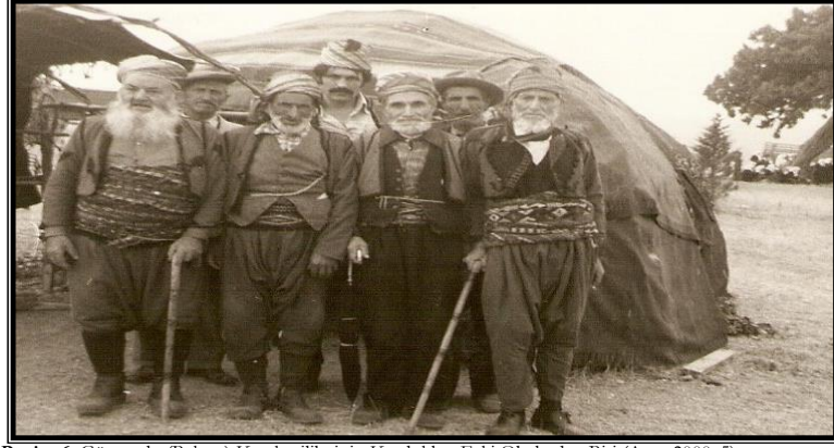
Resim 6: Günyurdu (Bakras) Karakeçililerinin Kurdukları Eski Obalardan Biri (Ateş, 2000, 5)

devam ettirmişlerdir. Hacı Bekir Bey ile tekrardan hatırlanan Ertuğrul Gazi türbesi ve belli bir zamana kadar sadece Günyurdu köyü yörükleri tarafından yapılagelmesi nedeniyle, bu köydeki Hacı Bekirler sülalesinin aşiret reisi Hacı Bekir'in devamı ya da çok yakınları oldukları muhtemeldir. Çünkü türbe ziyareti, Cumhuriyetin kurulmasından sonra da uzun yıllar sadece eski adıyla Bakras (Günyurdu) Yörükleri tarafından icra edilmiştir (Kaymak, 2001; 6).