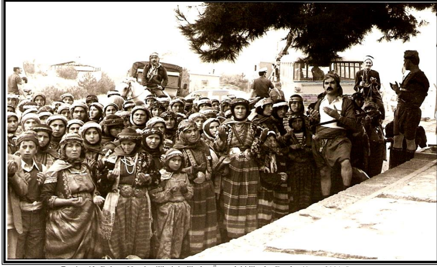
Resim 10: Bakras Karakeçililerinin Türbe Önündeki Toplu Duaları(Ateş, 2001:6)