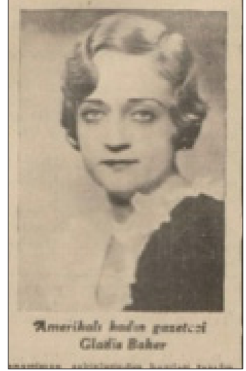
Resim 1. Cumhuriyet 21 Haziran 1935: 1

Balkan Antantı'nın (Entente Cordiale) kurulduğu dönemde Türkiye'nin Balkanlardaki nüfuz alanının genişlediği dış politika perspektifi, genel olarak Avrupa'ya bakıldığında revizyonizm tehlikesi konusunda uyarıları hatırlatan politikalarından da izlenmiştir. Böylece 1930'ların ortalarında