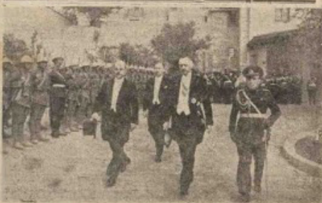
Yeni Çekoslovakya Elçisi, dün Atatürk'e güven mektubunu sunmuştu. Resmîmî, Elçinin hoşçe girişini gösteriyor.

"İmkân yok," dedi, "İmkân yok. Eğer harp çıkarsa, Amerikan milletler camiasında işgal ettiği yüksek mevki herhalde müteessir olacaktır. Coğrafî vaziyetleri ne olursa olsun milletler biribirini ne birçok rabatlarla bağlandırlar. "Atatürk dünyadaki milletleri bir apartmanın sakinleri telakki ediyor. Birleşik Amerika Cumhuriyetleri bu apartmanın en lüks dairelerinde oturmaktadır. Eğer apartman, sakinlerinden bazıları tarafından ateşe verilirse diğerlerini yanğının tesirinden kurtulmasına imkân yoktur. Harp için de aynı şey varittir. Birleşik Amerika Cumhuriyetlerinin bundan uzak kalmaları gayrikabildir. Atatürk şu sözleri ilâve etti: "Bundan başka Amerika büyük ve kuvvetli"