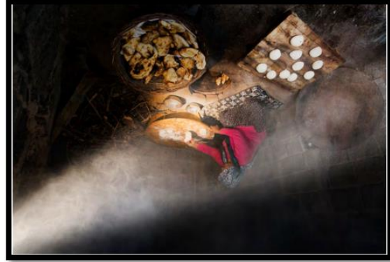
Şekil 7. Gilaburu (a) ve Tandır Ekmeği yapımı (b) (Bingöl, 2020b; Konyalı, 2020).

Şekil-7’de vadiye üretimi yapılan Gilaburu bitkisi ve tandır ekmeği üretimi görülmektedir. Vadi sakinleri tarafından yıllar boyunca aynı üretim araçları ile tandır tekniği kullanılmaktadır. Bu konuda K6. “Çok zengin bir kültürümüz var. Atalarımızda gördüklerimizi bizlerde yıllarca uyguladık. Önemli olan bunun kıymetini bilmek. Korumak ve yaşatmak. Ama sadece kendimiz içinde dünyaya da duyurmak gerekli bu kültürü.” Kayserinin doğusunda yer alan vadi temiz havası ile dikkat çekmektedir. Sanayi alanlarında uzak olması ve betonlaşmanın çok az boyutlarda olması vadi için son derece önemlidir. Katılımcılar tarafından bunun bir ayrıcalık olduğu vurgulanmaktadır. K7. “Birçok şehirde buldum. Yine de buraların kültürü, doğası bir başka, insan değerini bilmeli. Bizlerde bunu yaşatıyoruz.”