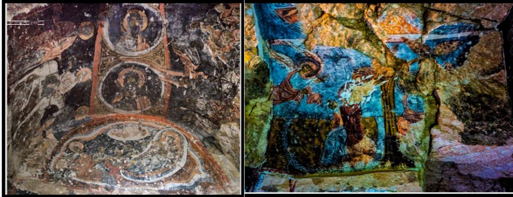
Şekil 4. Bağpınar Başeret Kilisesi (a), Doğu Kilise renkli duvarları (b) (Kural, 2020; Çakır, 2020a).

K5. "Birkaç ayın dışında (Kışın, Erciyes'te) faaliyetlerin olması elbette güzel. Ama yeterli mi zamanla göreceğiz. Daha çok kişinin kazanım sağlayacağı, alt yapı ve benzeri tesislerin yaygınlaştırılması gerekli, özellikle de reklamının iyi yapılmalıdır."