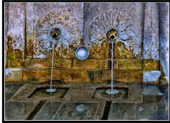
Şekil 5. Bağpınar Yukarı Köprü (a), Taş Süslemeli Çeşme (b) (Bingöl, 2020a; Çakır, 2020b).