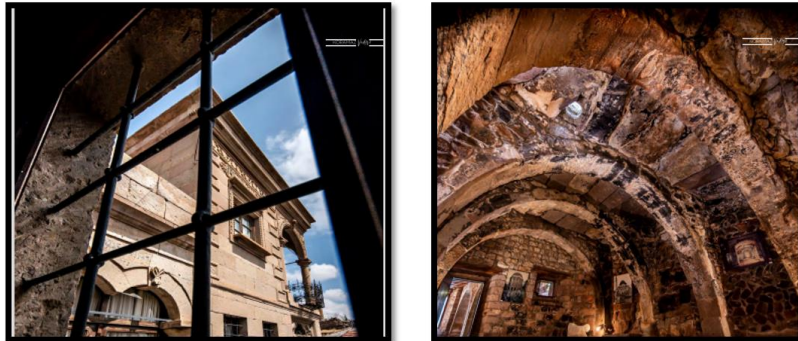
Şekil 3. Mimar Sinan Evi dış görünüm ve iç kemer görünümü (Ergin, 2020).