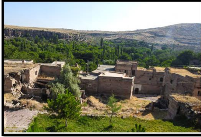
Şekil 6. Vekse Köyü Tarihi Rum Evleri Genel görünüm (Aral, 2020).

K4. “Üzüm bağlarımız, pekmezimiz, Arap aşısı yemeğimiz, sarmamız, kabak çiçeği dolmamız, gilaburu bitkimiz gibi birçok çeşidimiz var. Tandır ekmeğimiz gibi. Bunlar bizim kültürümüzün parçası bunları turistlere duyurmak lazım. Başkaları da bizlere kendi kültür özelliklerini duyurur, böylece köyümüzün kültürünü tanıtmış oluruz.”