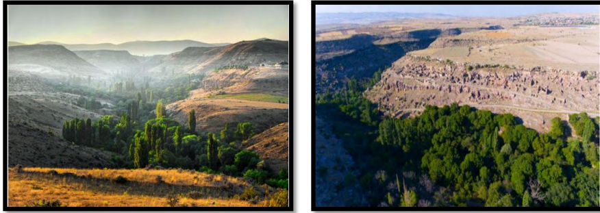
Şekil 2. Bağpınar (İsbıdın) (a), Vekse Köyleri Genel görünüm (b) (Kural, 2020; Akçay, 2020).