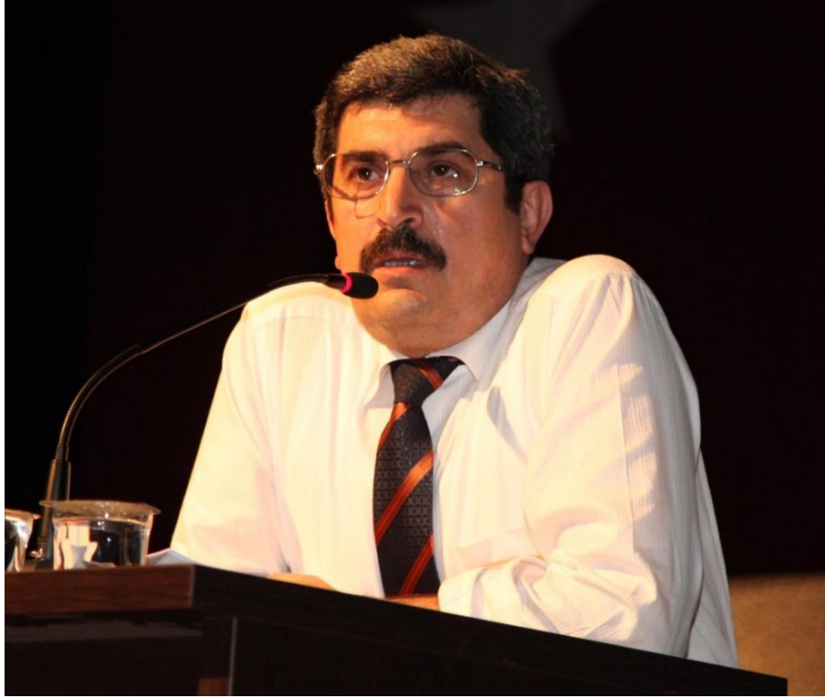
Foto 1: Prof. Dr. Vahit Türk'ün bir konferans sırasında çekilmiş görüntüsü

2000 yılında doçent, 2006 yılında profesör olan Vahit Türk evli ve İleriş, Metehan ve Alparslan adlarında üç erkek çocuk babasıdır.