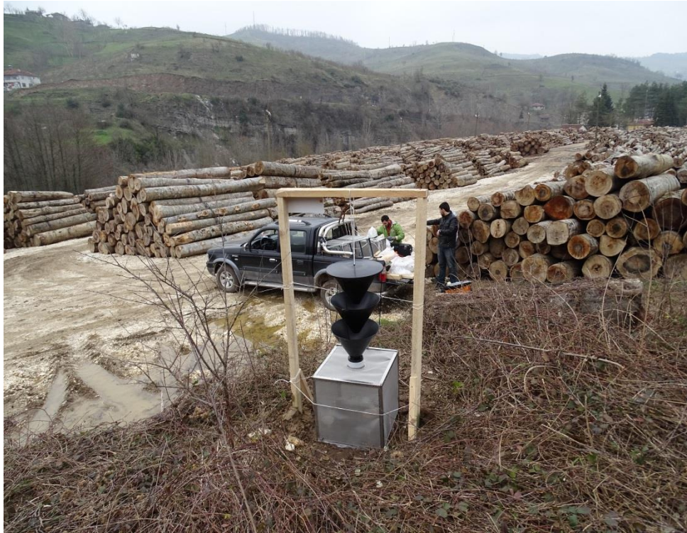
Şekil 3. Yeni geliştirilen böcek toplama kafes sisteminin kurulması

Hazırlanan odun blokları rutubetlerini muhafaza etmeleri için enine kesitleri sıvı parafin ile kaplanmıştır. Huniler ve kafesler naylon ipler ile iskelet sistemine bağlanmıştır. İskelet sisteminin üst köşesine yağmurdan etkilenmeyen uyarı levhası sabitlenmiştir. Son olarak, huni tuzak içerisine daha önceden belirlenmiş feromon ilaçları asılmıştır.