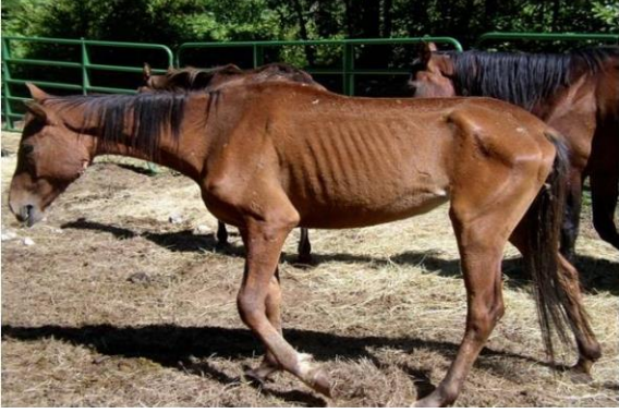
Şekil 3. Beden kondisyon puanı 1 (5). Figure 3. Body condition score 1 (5).

birkaç ayda gerçekleşebilir. İdman ve rasyondaki enerjinin azaltılması beden kondisyonunda dereceli azalışlara imkân vermektedir (28,29). Atların farklı beden kondisyonlarına ait puanlar Şekil 3-12'de sunulmuştur (5).