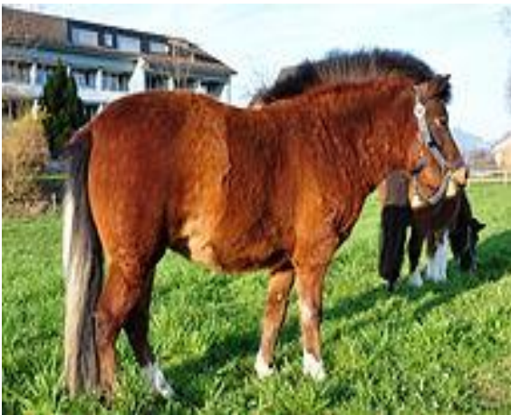
Şekil 11. Beden kondisyon puanı 9 (5). Figure 11. Body condition score 9 (5).