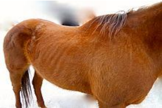
Şekil 5. Beden kondisyon puanı 3 (5). Figure 5. Body condition score 3 (5).