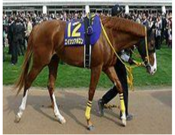
Şekil 7. Beden kondisyon puanı 5 (5). Figure 7. Body condition score 5 (5).