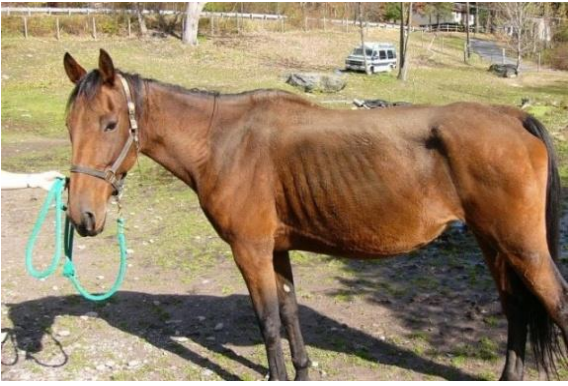
Şekil 4. Beden kondisyon puanı 2 (5). Figure 4. Body condition score 2 (5).