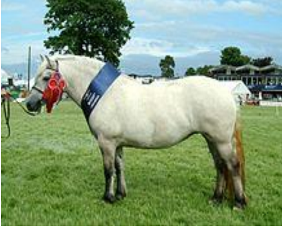
Şekil 9. Beden kondisyon puanı 7 (5). Figure 9. Body condition score 7 (5).