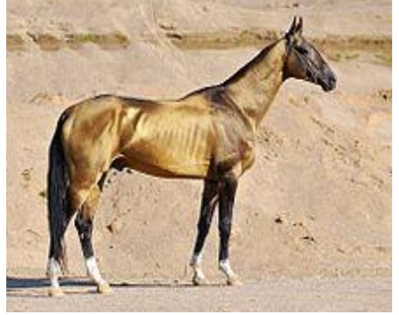
Şekil 6. Beden kondisyon puanı 4 (5). Figure 6. Body condition score 4 (5).