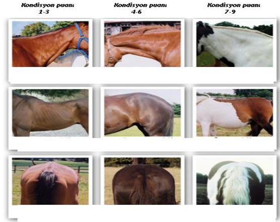
Şekil 12. Atlarda beden kondisyon puanlaması (5). Figure 12. Body condition scoring in horses (5).