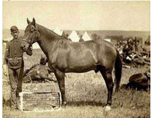
Şekil 8. Beden kondisyon puanı 6 (5). Figure 8. Body condition score 6 (5).