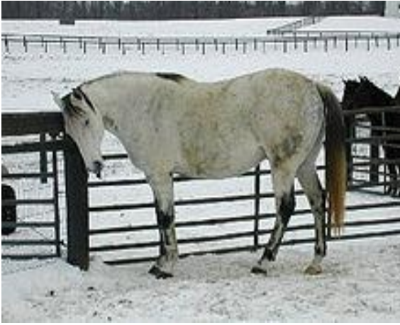
Şekil 10. Beden kondisyon puanı 8 (5). Figure 10. Body condition score 8 (5).