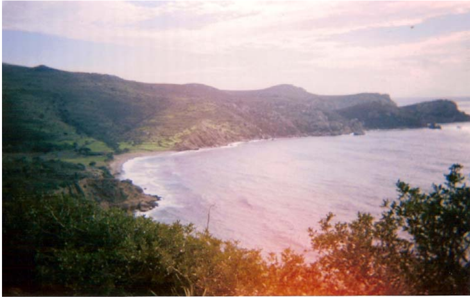
Şekil 6: Knidos antik şehrinden genel görünüm Figure 6: Panorama of Knidos

Tarihi çağlarda özellikle Ege ve Akdeniz'i kontrol edebilen bir mevkide bulunması itibariyle önemli bir ticaret şehri olan Knidos, bugün kalıntıları hâlâ var olan yaklaşık 5000 kişilik bir amfi tiyatroya sahiptir. Antik şehirlerde yer alan amfi