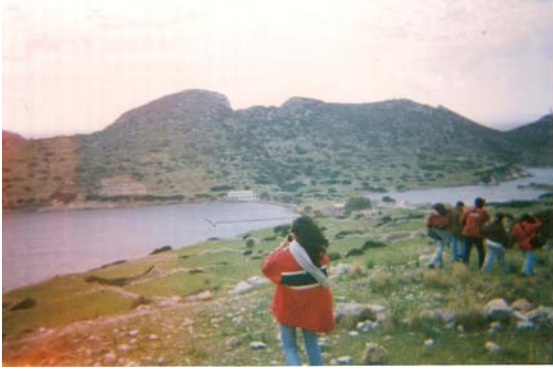
Şekil 3: Antik şehri anakaraya bağlayan boğaz Figure 3: Knidos's Isthmus

Aynı zamanda Ege ile Akdeniz'in birleşme noktasında yer alan Datça yarımadası tarih boyunca bölgeye yerleşmek isteyenler için son derece çekici bir merkez olmuştur. Bu nedenlerden dolayı Datça yarımadası pek çok kavim için yaşama alanı olarak tercih edilmiştir. Herhangi bir bölgenin nüfuslanması ve bu bölge dahilindeki yer altı ve yerüstü zenginliklerden faydalanılabilmesi, insanlar tarafından iskan edilebilmesiyle çok yakından alakalıdır (Göney, 1975:273).