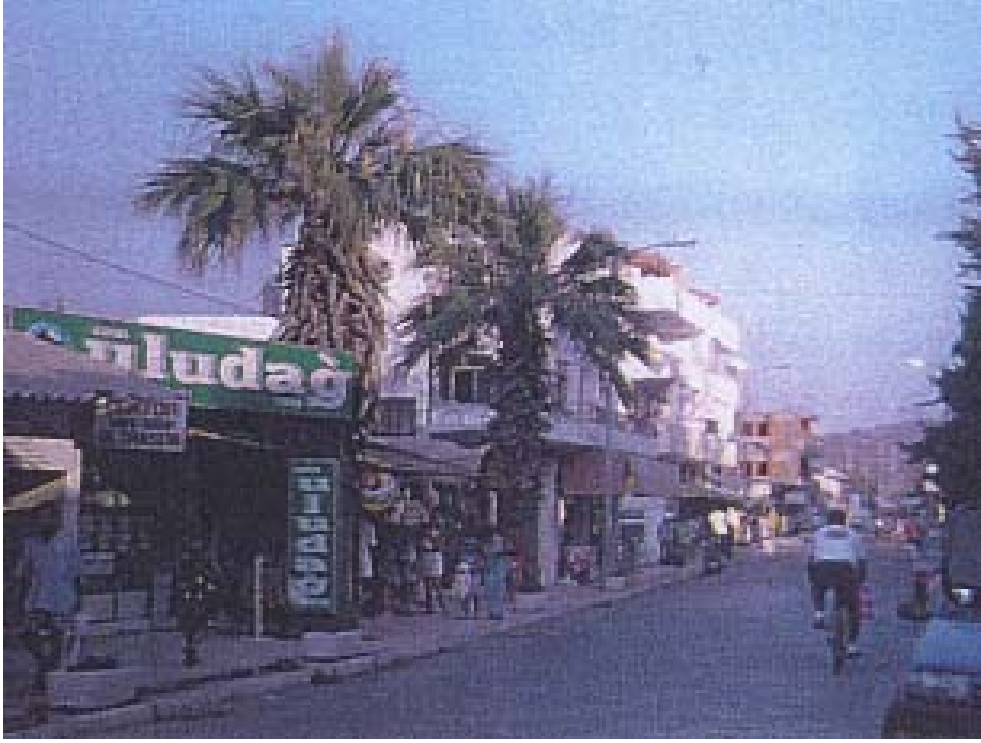
Şekil 15: Datça Şehri Atatürk Caddesi