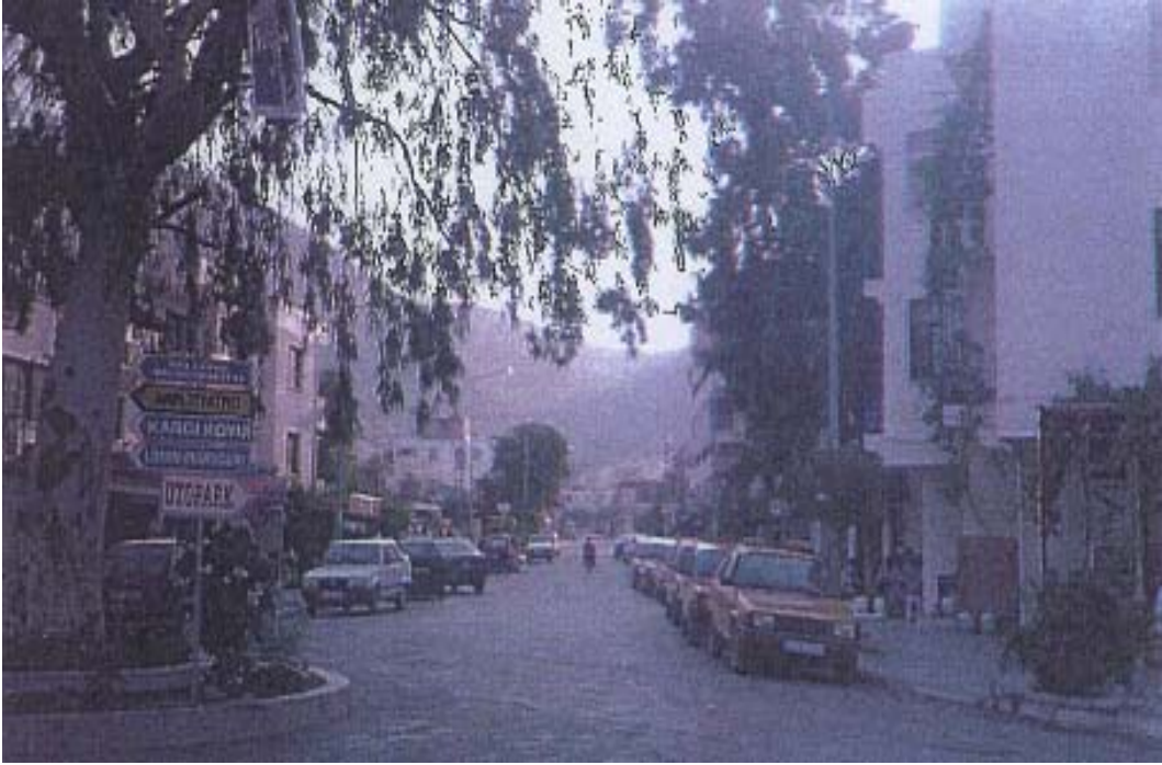
Şekil 12: Datça Şehri Ambarcı Caddesi Figure 12: Datça Ambarcı Street