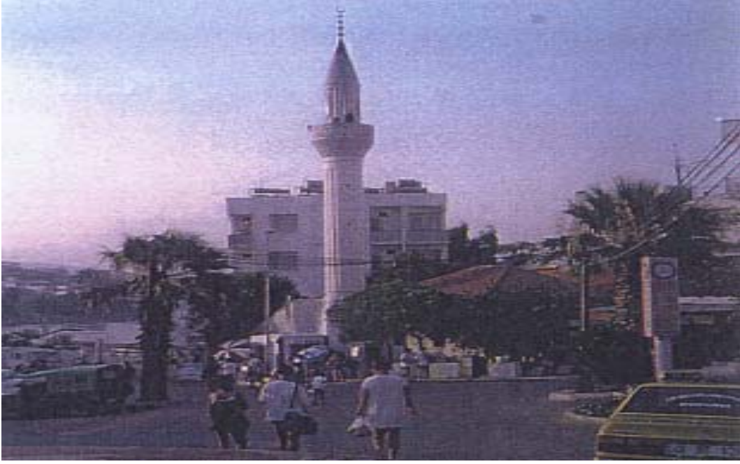
Őekil 9: Günümüz Datça Őehri genel görünümü: Őehir Meydanı ve Ulu Cami Figure 9: Datça Panorama: City's Square and Ulu Mosque