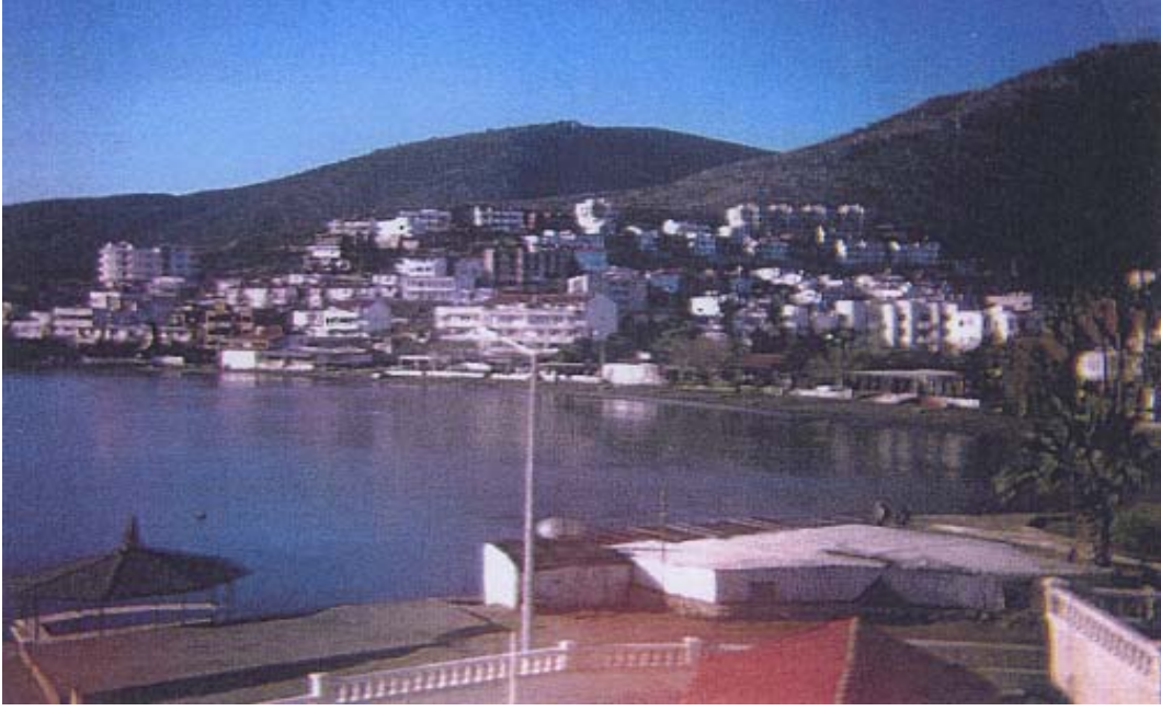
Őekil 13: Datça Őehrinin gũnũmũzdeki genel gŕrũnũmũ Figure 13: Panorama of Datça