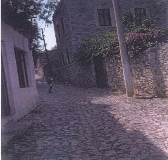
Şekil 8: Datça Şehrinin Nüvesi: Eski Datça Mahallesi

1040 yılında Selçuklu Devleti'nin kurulmasıyla birlikte Anadolu'ya akınlar başlamıştır. 1071 Malazgirt zaferinden sonra ise, Marmara ve Ege denizi kıyılarına kadar Reşadiye yarımadasının da içinde yer aldığı tüm Batı Anadolu'da Türk egemenliği hissedilmeye başlanmıştır. Batı Anadolu, Birinci Haçlı seferinde tekrar Bizanslıların eline geçmiştir. Böylece Batı Anadolu'da yaklaşık 200 yıl süren Bizans-Türk mücadelesi yaşanmıştır.