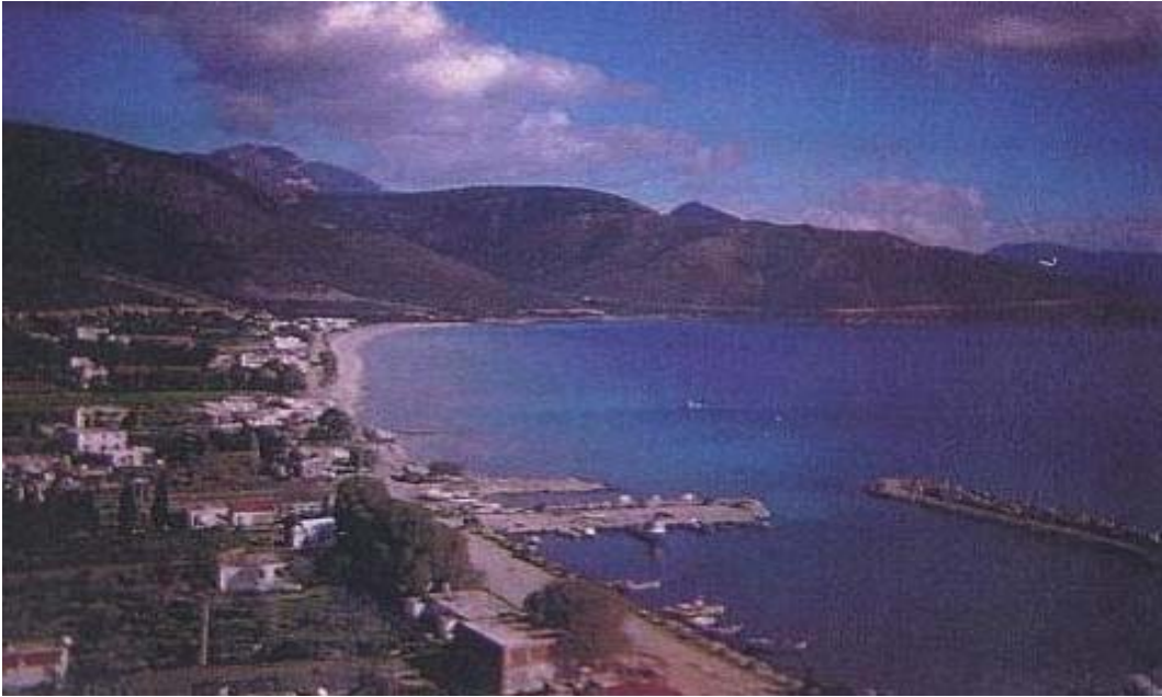
Őekil 10: Datça Őehri sahil ve balıkçı barınađı Figure 10: Datça coasts and fisher's shelter