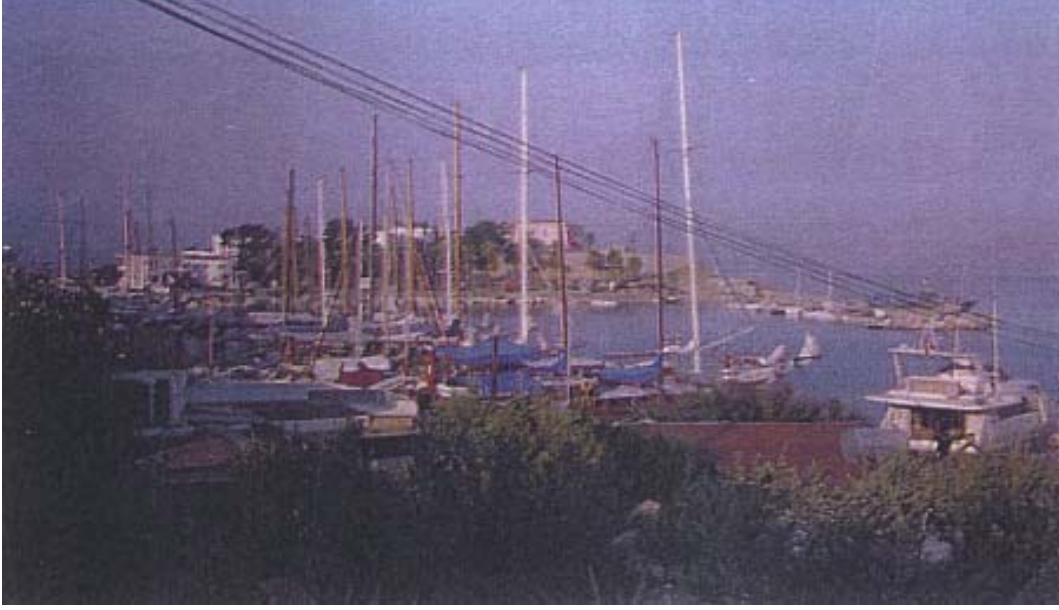
Şekil 11: Datça şehri yat limanı Figure 11: Datça's Marina