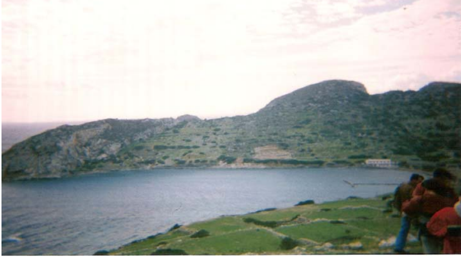
Şekil 2: Knidos antik şehrinin genel görünümü Figure 2: General view of Knidos