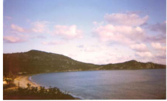
Şekil 4: Antik şehri anakaraya bağlayan boğaz ve Tekir Burnu Figure 4: Knidos's Isthmus and Tekir Cape

önemli özelliği Ege ve Akdeniz'in adeta birleşme noktasında olmasıdır (Şekil 3 ve 4).