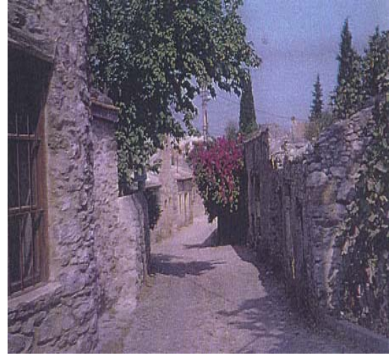
Şekil 7: Datça Şehrinin Nüvesi: Reşadiye Mahallesi

İskender'in ölümüyle birlikte Knidos Romalıların eline geçmiştir. Ancak bu geçiş harpsiz gerçekleştiği için şehir tahrip edilmemiştir. Roma döneminde, konumu itibarıyla Anadolu ve Doğu Akdeniz'i kontrol altında tutan Knidos, önem kazanan şehirlerden biri olmuştur. 395 yılında Roma İmparatorluğu'nun ikiye ayrılmasıyla Knidos Doğu Roma yani Bizans toprakları içinde yer almıştır.