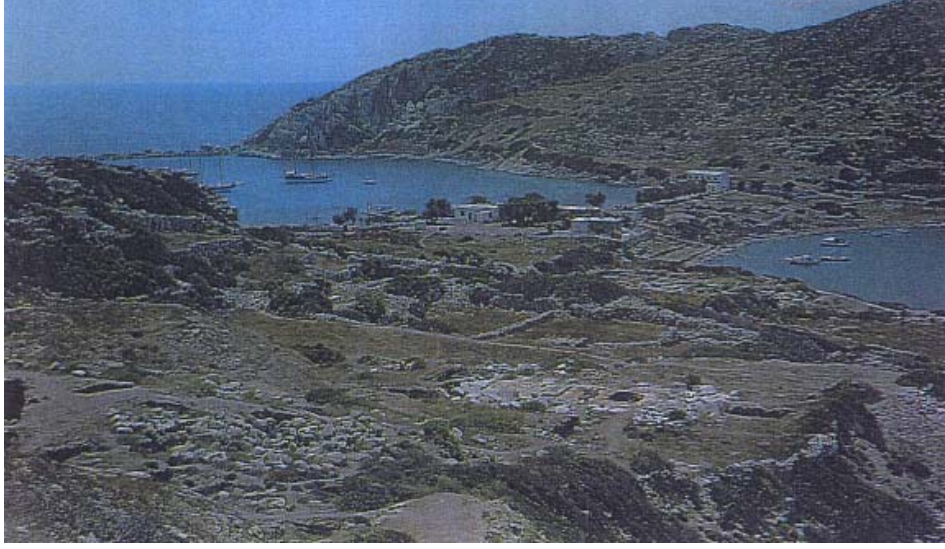
Şekil 5: Knidos'un askeri ve ticari amaçla kullanılan limanları Figure 5: Military and commercial harbours Knidos