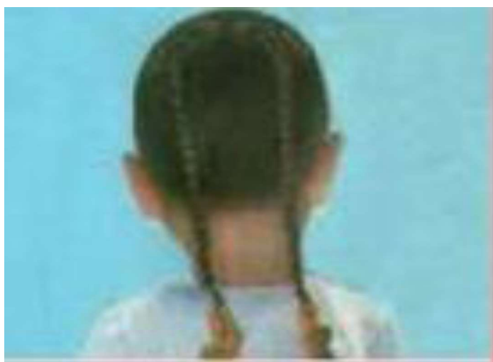
2-сурет. Қыз балаға қойылатын тұлым шаш.

Орталық Азия елдерінде кең тараған ұғым. Кекілге ұқсас қазақтарда кежім қою (желке шашы) деген де ғұрып болған. Баланың желке тұсына бірден көзге түсетін етіп қойылатын қысқа шашты осылай атайды. Кезінде, кежім шашы – ата-анасынан айырылып, жетім қалған сәбилерге қойылыпты. Балаға «кежім қою» ғұрпы – өзгелер сол баланың жетім екенін бірден аңғарып, ерекше қамқорлықпен қарасын, жетімге ешкім тиіспесін деген жақсы ниеттен бастау алады екен. Бұл шашты ер балалар ересек болғанға шейін де қойып жүре беретін болған.