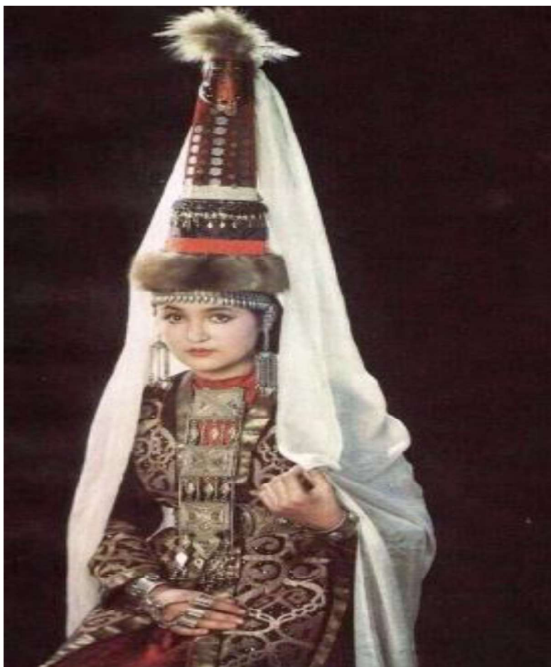
3-сурет. Сәукеле киген қазақ қызы.

өз жұртынан кетіп, күйеу жұртқа жеткенге шейінгі киіп баратын сәнді бас киіміне жатады. Сәукеле дайын болған кезеңде қыздың жеңгелері күйеу жігіттен арнайы сүйінші сұрататып, одан байғазысын алған. Ұзатылған қыз сәукелені бір жылға шейін киіп жүрген. Балалы болған соң сәукелені шешіп оның орнына кимешек киген.