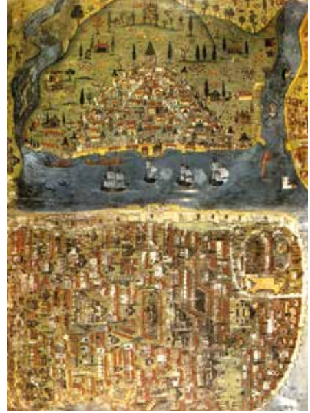
Şekil 2 Matrakçı Nasuh: Beyan-ı Sefer-i Irakeyn (16. y.y.). İstanbul manzarası = Vue d'Istanbul (16e siecle).

Kasımpaşa, 15. yüzyıldan itibaren kıyıda tersane ve çeşitli endüstri yapıları, iç kesimlerde ise yerleşim yerleri olacak şekilde gelişmiştir. Ayverdi'ye göre, Kasımpaşa'da Fatih devri sonunda