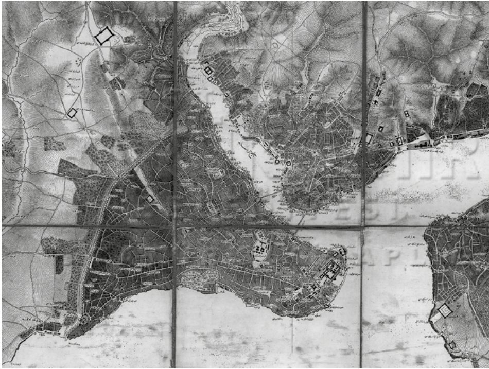
Şekil 8 Daru'l-hilafetü'l-aliye ve civarı haritası/Moltke. İBB Atatürk Kitaplığı, Haritalar, Depo, Hrt_000041.

1839 tarihli Moltke haritası incelendiğinde, Kasımpaşa Senti'nin sahil bölgesinde tersane yapılarının yanında modern kışla, mühendishane gibi yapıların inşa edilmeye başlandığı ve yukarı kesimlerde yerleşim yoğunluğunun arttığı gözlenmektedir (şek. 8). Ayrıca bu yüzyılda yapılan Galata ve Unkapanı köprülerinin de deniz ulaşımına bir alternatif olarak inşa edilmiş olduğu ve iki yakayı birbirine bağladığı okunmaktadır.