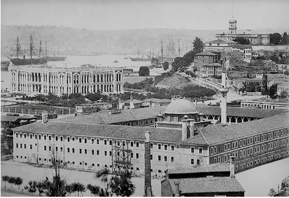
Şekil 12 Kalyoncu Kışlası ve Bahriye Nezâreti - Kalyoncu Barracks and Ministry of Navy.

En son Cezayirli Hasan Paşa Konağı satın alınarak, burada 400 öğrencinin eğitilmesine uygun bir Deniz Mühendishanesi yapısı inşa edilmiştir (şek. 13). 49 Bu yapı 1851 yılına kadar kullanılmış, 1853 yılında Bahriye Merkez Hastanesi'ne dönüştürülmüştür.