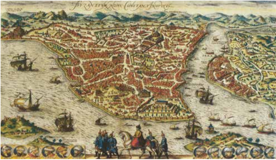
Şekil 5 Giovanni Andrea Vavassore tarafından üretilen 1520 tarihli İstanbul haritası. https://sehirplanlama.ibt.istanbul/beyoglu-arsivi-haritalar/ .

I. Selim döneminde yaptırılan gözlerin sayısı Kanuni zamanında artırılmış, ambarlar, mahzenler eklenmiş ve Haliç'teki tersane geliştirilmiştir. 16 Çelebi, Kanuni döneminde tersaneye baruthane kulesi, yetmiş kaptan mahzenleri, kürekhaneye, yedi adet mahzen ve yeni bir divanhane eklendiğinden bahsetmektedir. 17