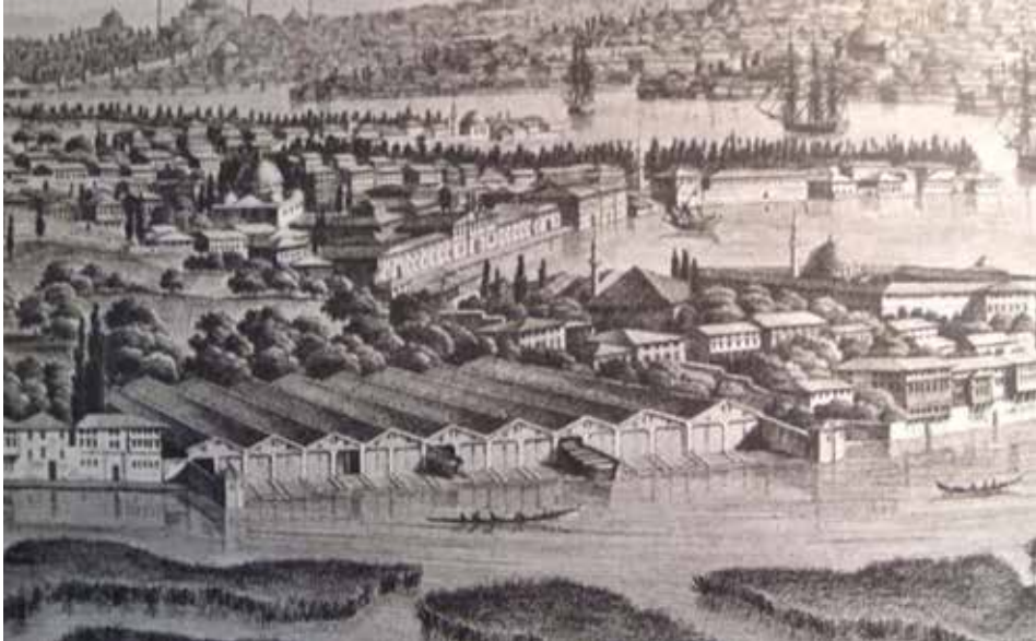
Şekil 10 Sütlüce'de tersane gözleri. Neclâ Arslan, Gravür ve Seyahatnamelerde İstanbul (18. Yüzyıl Sonu ve 19. Yüzyıl) (İstanbul: İstanbul Büyükşehir Belediyesi Kültür İşleri Daire Başkanlığı, 1992).

Bu dönemde tersanede, buhar gücü ile çalışan yeni makina atölyeleri ve imalathaneler açılmıştır. Haddehane, Demirhane, Bıçkılıhane bu dönemde yapılan işletmelerdir. 46 Yeni yapılan eklemelerle tersane kıyı şeridi boyunca Hasköy'e doğru büyümüş, Haliç'in güney kıyısında dahi tersaneye ait atölye yapıları yer almıştır. Melling'in gravürlerinde Ayvansaray ve Sütlüce sahillerinde yer alan küçük tersane yapılarını gözlemek mümkündür (şek. 10).