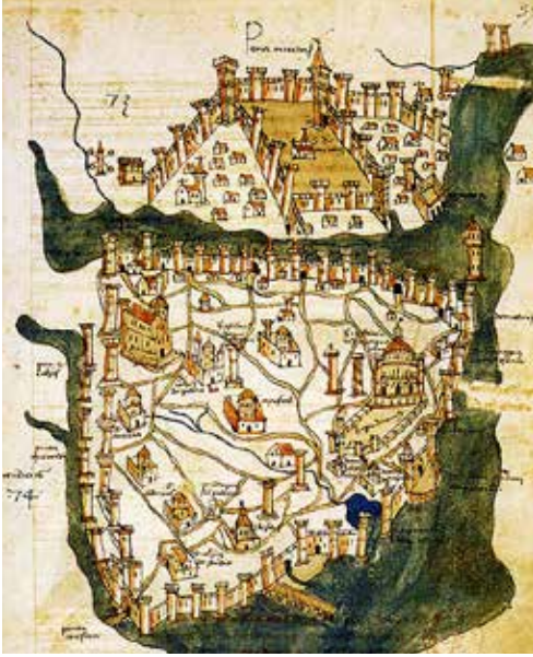
Şekil 1 Cristoforo Buondelmonti tarafından 1420'lerde çizilmiş İstanbul'un en eski haritası.

Haliç'in kuzey yakasında bulunan Kasımpaşa, Galata Surları'ndan başlayarak Hasköy'e kadar, Taksim yönünde ise Şişhane'ye kadar uzanmaktadır. Bizans döneminde, bölgenin adı Pegai'dir ve bölgede saray, kilise ve tersane bulunmaktadır (şek.1) 2 . Evliyâ Çelebi, Kasımpaşa'nın fetihten önce Ayalonka adı ile anılan bir manastır alanı olduğunu, fetih sonrası bu bölgenin Müslüman mezarlığı haline getirildiğini söylemektedir 3 . Fetihden sonra Fatih, Kasımpaşa Deresi'nin Haliç ile birleştiği bölgede birkaç gözden oluşan bir tersane, bir mescit ve bir divanhane yaptırmıştır. Matrakçı Nasuh'a ait 16. yüzyıl İstanbul gravüründe semtin Haliç kıyılarına eklenmiş tersane yapıları görülmektedir (şek. 2). Fatih, aynı dönemde Tophane-i Amire'nin de ilk adımlarını atmış, Osmanlı'nın çok önemli iki askeri sanayi kurumunu yaratmıştır 4 .