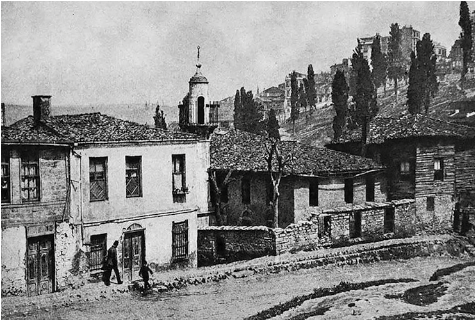
Şekil 17 Kasımpaşa kaldırımları 55 .