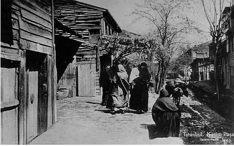
Şekil 15 Kasımpaşa Deresi 51 .

19. yüzyılın ikinci yarısında, Altıncı Daire'nin kurulduğu yıllarda, Şişli'ye doğru büyüyen Galata ve Beyoğlu civarında, bu büyümeye uygun bir altyapı kurulamamıştır. Altıncı Daire'nin sorumluluğunda olan alanlarda temizlik ve kanalizasyon hizmetleri yetersiz kalmaktadır. Bunun üzerine Altıncı Daire, 1859 yılında, "Sokaklara Dair Nizamname" adında, temizlik usullerine de değinen bir rapor hazırlamıştır. Bu rapora göre, her gün belirli saatte çöpler çöp arabaları ile toplanacak, her hane ve dükkân kapısının önü temiz tutulacak, lağım yolları inşa edilecek, sokak satıcıları bir yerde uzun süre duraklayamayacak, su olukları sokağa kadar uzatılmayacak, tamir amaçlı dahi olsa izinsiz kaldırım taşları yerlerinden çıkarılmayacak (şek. 17), pis sular lağıma akıtılacaktır. 52