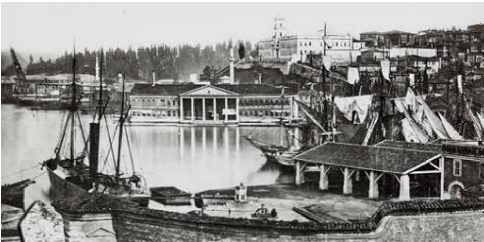
Şekil 13 Kasımpaşa / Claude-Marie Ferrier Fotoğrafı / 1850'ler. http://www.eskiistanbul.net/resimler/kasimpasa-claude-marie-ferrier-fotografi-1850ler.jpg .

Tanzimat'ın ilanından sonra ise bahriyede islahat hareketlerine girilmiş, 1845 yılında Bahriye Meclisi kurulmuştur. Ardından 1867'de kaptan paşalık müessesesi lağvedilerek yerine Bahriye Nezareti kurulmuş, 1869 yılında ise bugün Kuzey Deniz Hava Sahası Komutanlığı olarak kullanılan kâgir Bahriye Nezareti binası inşa edilmiştir (şek. 14).