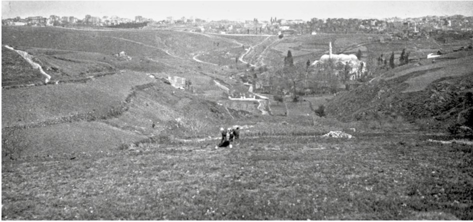
Şekil 3 Piyâle Paşa Camii ve çevresi, XIX. yüzyıl. 7

16. yüzyılda Kanuni'nin, Kasım Paşa, Piyale Paşa, Ferhad Paşa ve Ayas Paşa'yı bölgeyi imar etmeleri için görevlendirmesi sonucu bölgede çok sayıda konut, cami, medrese, tekke yapıları inşa edilmiştir. Semt adını bölgenin düzenlenmesi ve gelişmesi için çalışan Güzelce Kasım Paşa'dan almıştır. Bu dönemde, Sakız fatihi Piyale Paşa Kasımpaşa'nın üstlerinde bir külliye inşa ettirmiştir. Piyale Paşa Külliyesi, cami, medrese ve tekleden oluşmaktadır fakat cami bir saatlik mesafede olduğundan cemaati azdır. Piyale Paşa buna çözüm olarak, tersaneden camiye kadar bir kanal açtırarak kayıklarla ulaşımı sağlamış ve cami cemaatinin kalabalıklaşmasını sağlamıştır. Ancak Piyale Paşa'nın ölümünden sonra bakım çalışmaları yapılmadığından bu kanal dolmuş, kayıkların girip çıkması mümkün olmamıştır. 6 Açılan kanalla imara elverişli bir alan haline getirilmeye çalışılan bu alan, zamanla terk edilmiş, yerini kırlara ve bostanlara bırakmıştır (şek. 3).