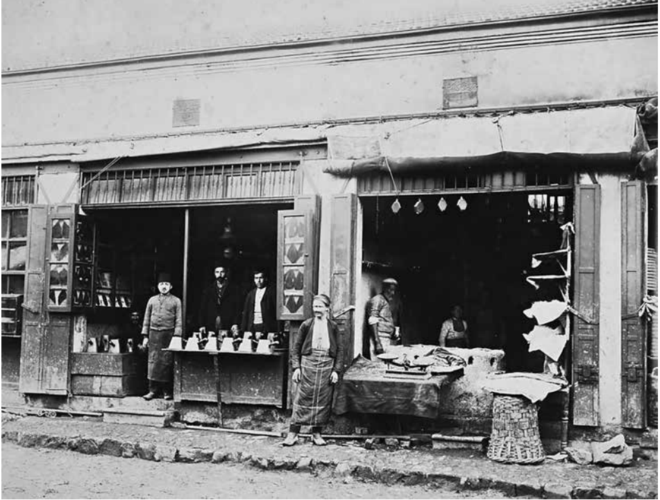
Şekil 7 Kasımpaşa Kışla Meydanı'nda dükkânlar.

Çelebi, Kasımpaşa'da 3.060 dükkân bulunduğunu, özellikle debbağlar esnafının çok kalabalık olduğundan bahsetmektedir (şek. 7). Kasımpaşa deresinin iki tarafında baştanbaşa dükkânlar bulunmakta ve köprüler aracılığıyla bağlantı sağlanmaktadır. 38 Ordunun ve İstanbul halkının deri ihtiyacı Kasımpaşa'nın da aralarında bulunduğu Eyüp, Tophane, Üsküdar, Yedikule semtlerinde bulunan debbağhanelerden karşılanmaktadır. Buralar ikişer üçer katlı binalardan oluşmaktadır ve her semtte on beş, yirmi dükkân vardır. Her dükkân bir usta idaresinde olup, ayrıca kalfa, çırak ve işçiler bulunmakta ve bu kişiler şafakla beraber işe başlayıp akşama kadar çalışmaktadır. 39 Kasımpaşa'da Ziba ve Hacıhüsrev mahallelerinde yerleşik düzene geçmiş çingeneler yaşamaktadır. Evliyâ Çelebi, Çingenelerin II. Mehmet tarafından İstanbul'a getirilip yerleştirildiğinden