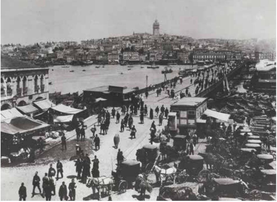
Şekil 9 Guillaume Berggren tarafından 1890 yılında çekilen Galata Köprüsü fotoğrafı.

ve Pera önemli ölçüde gelişmemiştir. Unkapanı ve Azapkapı arasında yapılan köprüden sonra, Galata'nın artan nüfusu ve gelişen ticari faaliyetler sebebiyle Eminönü Karaköy arasına 1845'te II. Mahmud'un eşi Bezmiâlem Valide Sultan tarafından, 18 yıl boyunca hizmet verecek olan ahşap bir köprü yaptırılmıştır. 41 Galata ve Unkapanı köprüleri zaman içerisinde yenilenmiş ve farklı taşıyıcı sistemlerle yeniden yapılmıştır (şek. 9).