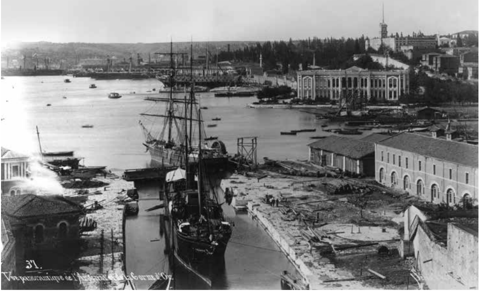
Şekil 11 Sébah ve Joaillier'in gözünden Haliç Tersanesi'nden Kasımpaşa ve Haliç'in görünümü. https://archives.saltresearch.org/handle/123456789/194322 .

malzeme ambarları, havuzları, kışlaları, yelken dikim kürek yapım atölyeleri, dökümhanesi, cami, mektep, hamam, hatta zindanlarıyla Tersane-i Amire büyük bir denizcilik merkezidir (şek. 11). Haliç, aynı zamanda saray çevresinin ve zenginlerin sayfiye bölgesi olma özelliğine sahip olsa da, 19. yüzyılın sonlarına doğru büyük kışla ve sanayi yapılarının belirmesi, tersanenin kıyı şeridi boyunca genişlemesi, bu bölgede sanayi fonksiyonunun ağır bastığını göstermektedir.