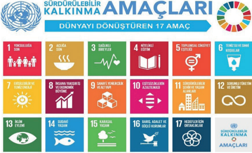
Şekil 2: Sürdürülebilir Kalkınma Amaçları

ler Genel Kurulunun A/RES/70/1 sayılı kararı ile 25 Eylül 2015'te kabul edilen ve 193 ülke tarafından taahhüde bağlanan Gündem, on yedi adet sürdürülebilir kalkınma amacı ve bunlara bağlı 169 hedeften oluşmaktadır (Şekil 2).