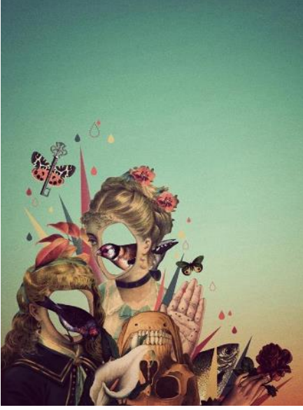
Şekil 4