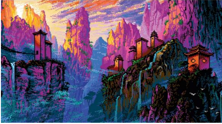
Şekil 6: Sanatçı Matej Jan