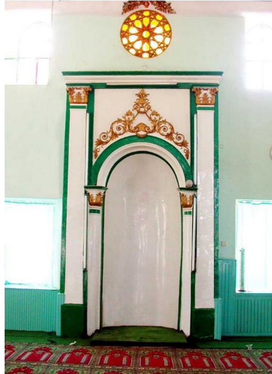
Şekil 13. Yalvaç Devlethan Camisi Mihrabı (Yalvaç Belediyesi 2022).

Caminin iç mekânında göze çarpan en önemli süsleme öğeleri güney duvarda karşımıza çıkmaktadır. Anadolu'da 18. ve 19. yüzyılda inşa edilmiş camilerde sıkça karşılaştığımız bu süslemeler, Barok Dönemi özelliği taşımakta olup bölgedeki diğer camilerde de benzer süslemelerle karşılaşılmaktadır. Yakın çevredeki camiler incelendiğinde Yalvaç Devlethan Camisi (18. yy.) (Çok, 2010, 54) mihrap süsleme özellikleri bakımından büyük ölçüde benzerlik göstermektedir (Şekil 13).