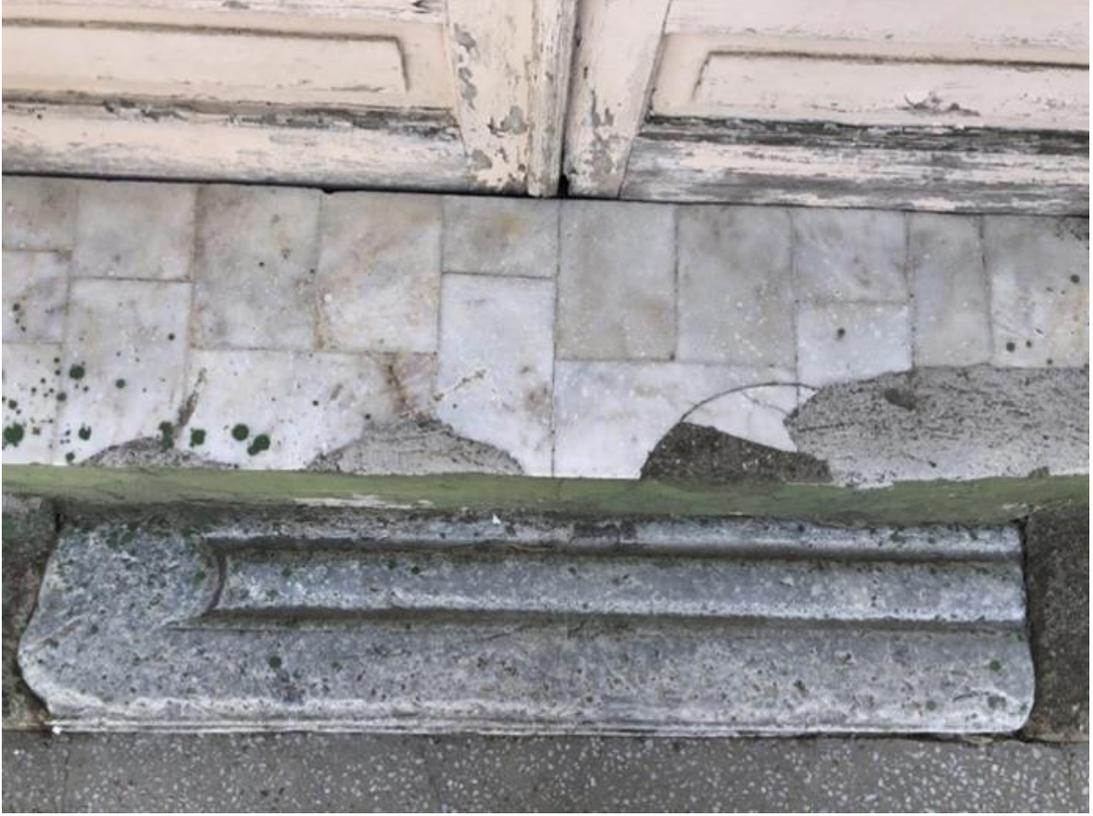
Şekil 5: Şeyhler Camisi'nin harime giriş kapısı eşliğindeki devşirme taş Figure 5: The spolia stone on the threshold of the entrance gate of the Şeyhler Mosque

Harime, camekân bölümünün ortadaki çift kanatlı kapısından geçilmektedir. Yamuk dikdörtgen planlı olan harimin üzeri ahşap düz dam şeklinde düzenlenmiştir. Harim duvarlarının tamamı bej renge boyanmış olup harimin batı ve kuzey cepheleri, süsleme açısından yalın tutulmuştur (Şekil 6). Harimin doğu duvarına iki adet dikdörtgen formlu üst kot penceresi açılmıştır. Batı duvarda ise aynı özelliğe sahip sadece bir adet üst kot penceresi yer almaktadır. Pencerenin hemen kuzeyine dikdörtgen formlu, basık kemerli minareye giriş kapısı konumlandırılmıştır. Kapının kuzeyinde ise bir adet 0.40 m. derinliğinde, 0.70 m. genişliğinde niş bulunmaktadır (Şekil 7). Aynı cephenin zemin kotunda, kadınlar mahfiline çıkış merdivenin hemen altında, bir adet dolap nişi yer almaktadır. Caminin eski imamı olan Abdullah Çimen Hoca, dolap kapağına not düşmüştür. Dolap kapağına yazılmış olan not, caminin geçirdiği değişiklikler hakkında bilgi vermektedir. 30.09.1987 tarihinde yazılmış olan nota göre; son cemaat girişi kapısı sonradan açılmış ve bu mekân sonradan oluşturulmuştur. İhtiyat doğrultusunda abdestlik ve rüzgarlık eklenmiştir. Ayrıca kadınlar mahfiline çıkan merdiven ve mahfil döşemesi yenilenmiş, son cemaat yeri bölücü ile ayrıldığı anlaşılmaktadır (Şekil 8).