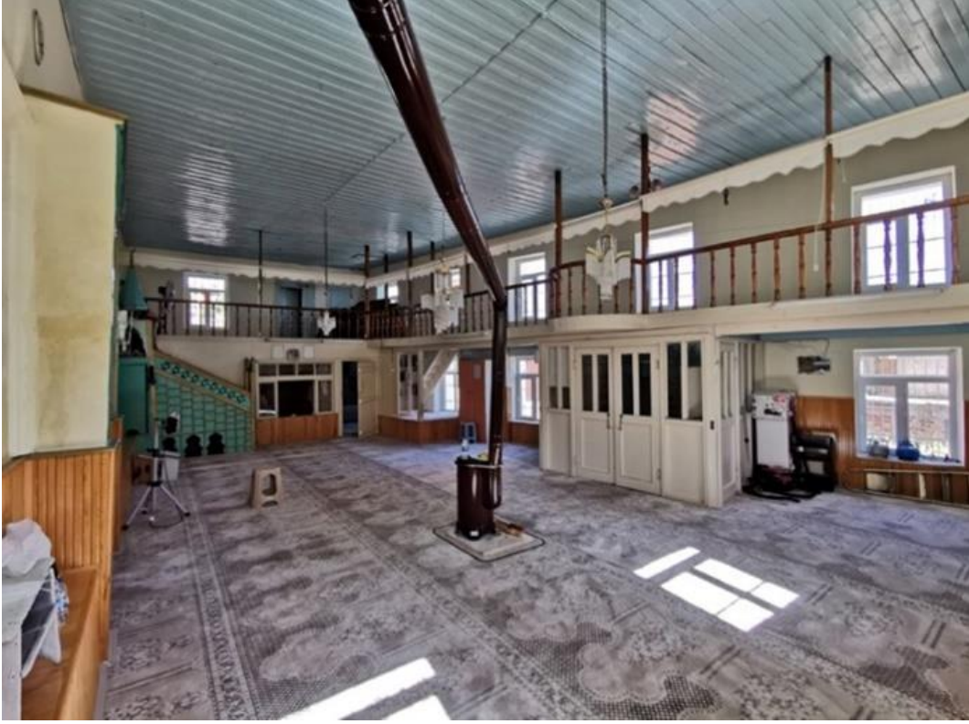
Şekil 6: Şeyhler Camisi harim mekânı zemini ahşap ve halı kaplaması (Hekart Mimarlık'tan) Figure 6: Şeyhler Mosque sanctuary floor is wooden and carpeted (from Hekart Architecture)