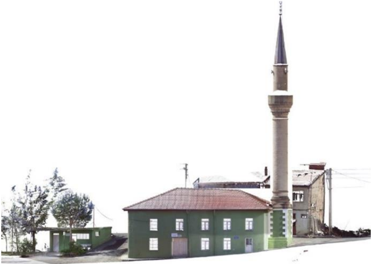
Şekil 1. Şeyhler Camisi genel görünüm

örtünün içten toprak düz damlı, dıştan ise kırma çatılı olarak inşa edildiği yöre halkı tarafından söylenmektedir. Yapının çatı strüktürü incelendiğinde de bu bilgi doğrulanmaktadır. Ayrıca yakın çevredeki Hıdır Çelebi Camisi'nin de ilk inşasında üzeri toprak dam ile örtülü olduğu ileri sürülmektedir (Duymaz, 2009, 200) (Şekil 1).