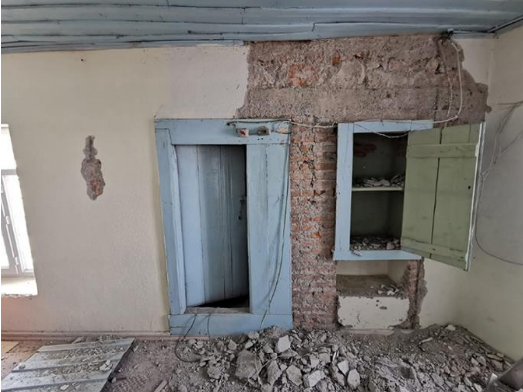
Şekil 7: Şeyhler Camisi minareye giriş kapısı (Hekart Mimarlık'tan) Figure 7: Şeyhler Mosque entrance gate to the minaret (from Hekart Architecture)