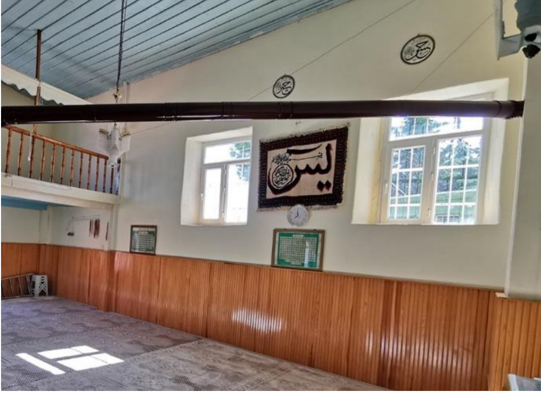
Şekil 9. Şeyhler Camisi harim doğu duvarı (Hekart Mimarlık'tan) Figure 9. Şeyhler Mosque sanctuary east wall (from Hekart Architecture)