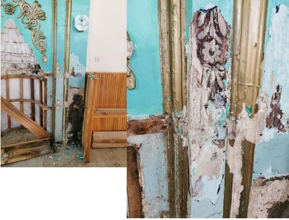
Şekil 11. Şeyhler Camisi mihrap süslemelerinden detaylar (Hekart Mimarlık’tan)

sonrasında, mihrabın dış hatları ile kaval silmelerin arasında kahverengi zemin üzerine bej renkte, birim motifte yaprak ve çiçek bezemelerinin olduğu kalem işi süslemeler tespit edilmiştir (Şekil 11). Anadolu’da 19.yüzyılda inşa edilmiş camilerde sıkça karşılaştığımız bu süslemeler, Barok Dönemi özelliği taşımaktadır (Arık, 1976; Renda, 1977). Mihrabın hemen batısında yer alan minber orijinal değildir.