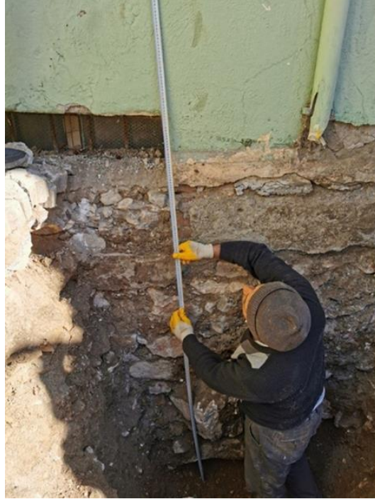
Şekil 4: Şeyhler Camisi batı cephesi yol kotu altında kalan pencere (Hekart Mimarlık'tan)

pencere, daha sonra kapıya dönüştürülmüştür. Yapının sağır tutulmuş olan güney cephesi dar bir sokağa bakmaktadır ve arazideki eğimden dolayı yapı, bu cepheden tek katlı olarak algılanmaktadır. Zemin kat toprak altında kalmaktadır. Minarenin yer aldığı batı cephede ise minarenin güneyine, diğer cephedekilerle benzer özelliklere sahip iki kademeli birer adet pencere açılmıştır. Alt kademedeki pencere yol çalışmasından dolayı kot altında kalmıştır (Şekil 4). Camin batı cephesinin hafif kuzeyine konumlandırılan minare orijinal değildir. Doğu cephenin hafif güneyine kaydırılmış iki adet dikdörtgen formlu üst kot penceresi yer almaktadır.