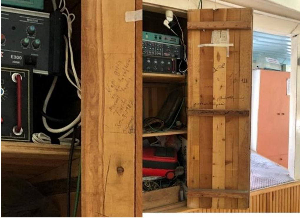
Şekil 8. Şeyhler Camisi kapak dolaplarındaki kitabeler (Hekart Mimarlık'tan)