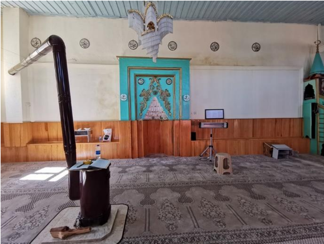
Şekil 10. Şeyhler Camisi harim güney duvarı (Hekart Mimarlık'tan) Figure 10. Şeyhler Mosque sanctuary south wall (from Hekart Architecture)