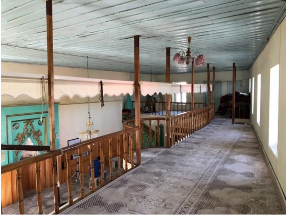
Şekil 12. Şeyhler Camisi kadınlar mahfilinden genel görünüm (Hekart Mimarlık'tan)

Figure 12. General view from Şeyhler Mosque women's gathering place (from Hekart Architecture)