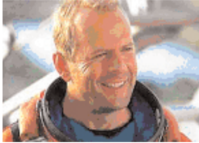
Şekil 8: "Armageddon" Harry Stamper karakteri.

Dizisel eksenindeki ilk karşıtlık yaşam ve ölümdür. Yaşamı kurtarma misyonu için, dünyadaki en iyi petrolcü bulunur (Bakınız: Şekil 8 Harry Stamper).