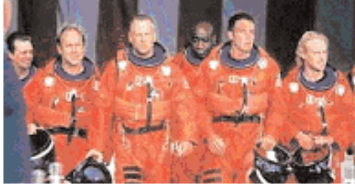
Şekil 11: "Armageddon" astronotlar.

"Armageddon"da slogan olarak, eril nitelikli "For all mankind" kullanılır. "Mankind" insanoğulları ya da erkekler anlamındadır. Bu durumda toplumda birincil konuma erkek cinsi, ikincil konuma da "öteki" adı altında toplanabilecek kadınlar, siyahlar, eşcinseller, kızıldirililer v.d. girmektedir.