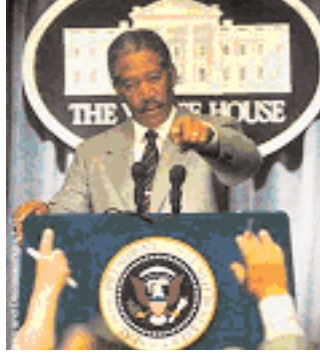
Şekil 12: "Deep Impact" siyah ABD Başkanı.

"Deep Impact" filminde Başkan bir siyahtır (Bakınız: Şekil 12),