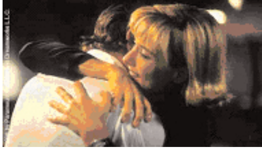
Şekil 7: "Deep Impact" baba ve kızın barışması.

Filmde bu karar, Jeny tarafından verilir ve çocuğu olan çalışan kadının hayatını kurtarmak için kendini feda eder. Böylelikle ailenin önemi, yalnız olmayı tercih eden kadın karakter tarafından da onanır ki bu karakterin yalnızlığı tercih etmesinin sebebi, kendi ailesinin babası yüzünden dağılması ve bundan dolayı duyduğu acı, nefret ve üzüntüdür.