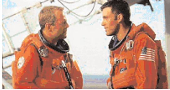
Şekil 13: "Armageddon" baba-oğul figürü.

Çin atasözüne göre kadının üç erdemi babaya itaat, kocaya itaat, oğula itaattir (Leoff, 1994:33). Finalde kızının sevdiği erkeğinin dönmesi uğruna kendini feda eden bir baba figürü vardır. Önemli olan soyun devamıdır.