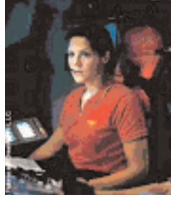
Şekil 10: "Deep Impact" filmindeki kadın astronot.

Kadın astronot uzay mekiğini kontrol edenlerden birisidir (Bakınız: Şekil 10).