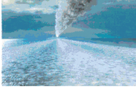
Şekil 2: Dünyanın sınırlarını geçmiş "Asteroid" tehlikesi.

kaygıları işaret eden bir imge olarak ele alınacaktır (Bakınız: Şekil 2).