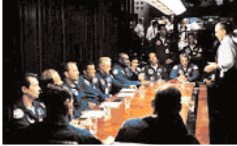
Şekil 14: "Armageddon" ve teknoloji.

"Armageddon", erkeklere atfedilen teknolojik fetişizmin toplu bir gösterimidir (Teknoloji/doğa karşıtlığı) (Bakınız: Şekil 14).