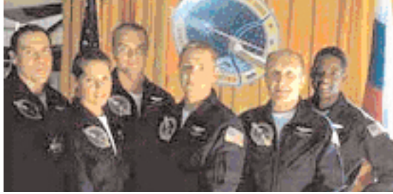
Şekil 9: "Deep Impact" uzay mekiği mürettebatı.

Yönetmen kadın olmasına rağmen, filmi ataerkil sistemden bağımsız düşünmek ve soyutlamak mümkün değildir. Örneğin "mesih" uzay mekiği ile uzaya giden astronotlar 4 beyaz erkek, 1 beyaz kadın ve 1 siyah erkekten oluşur (Bakınız: Şekil 9).