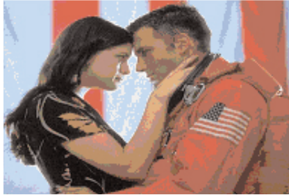
Şekil 4: "Armageddon".

"Armageddon" filminde de genç beyaz bir çift filmin sonunda evlenir (Bakınız: Şekil 4).