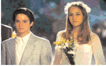
Şekil 3: "Deep Impact".

hiçbir şey içermemektedir (Roloff ve Seeblen 1995:99). Kıyamet gününün sonrasında hayatta kalan mitik kahraman ve üç beş kişi, yeni oluşmaya başlayan sağlıklı, mutlu ve temiz "öncü toplumun" çekirdeğini oluşturur. Aslında kıyamet günü, yarattığı korku ve felaketin yanında, gereksiz ve fazla olanı da bir temizleme süreci içinde yok eder (Batur 1998:47). Amerikan mitolojisinin ideali, ancak şimdi başlamış olan öncü-toplumdur. Bu tür başlangıç toplumları bilim kurgu türü için olumlu toplum imajları oluştururlar(Roloff ve Seeblen 1995:99). "Deep Impact" filminde de kıyamet sonrası yaşama şansına sahip olanlar genç beyazlardan oluşan çekirdek ailedir (Bakınız: Şekil 3).