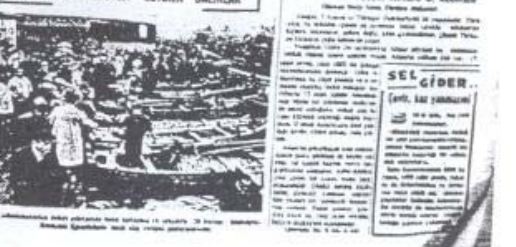
İSTANBULU MUZLUK GETİREN BALIKLAR. İstanbul'da muzuluk getiren balıklar. İstanbul'da muzuluk getiren balıklar.

AMERIKAN GÖZÜLE TÜRK KOTU AMERIKAN GÖZÜLE TÜRK KOTU. AMERIKAN GÖZÜLE TÜRK KOTU. AMERIKAN GÖZÜLE TÜRK KOTU.