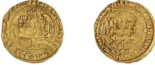
Resim: Sultan Tuğrul Bey adına 447 (1055-1056) yılında Errecân’da bastırılan bir sikke 61