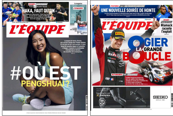
Şekil 5. Tenis ve Ralli Spor Dallarının Kapağa Yer Aldığı Sayı Örnekleri

L'Equipe'in kapağında ana spor dalı dışında, sayfanın üst bölümünde 2 spor dalına ait haber anonsları da bulunmaktadır. Farklı spor dallarını içeren bu haber anonslarından bir tanesi mutlaka fotoğrafla desteklenirken, diğeri fotoğrafsız sadece anons başlığıyla yer almaktadır (Şekil No:5). Bu haber anonslarında da futbol (30), diğer spor dallarının önünde açık ara lider durumdadır. İncelemenin gerçekleştiği zaman diliminde futbol dışında 7 farklı spor dalı haber anonslarına dahil edilmiştir. Futboldan sonra anonslarda en çok kullanılan spor dalı ragbi (15) olmuştur. Bu iki spor dalı dışında, 6 farklı spor dalına (Basketbol, Formula 1, Tenis, Hentbol, Yelken ve Biatlon) daha yer verilmiştir.