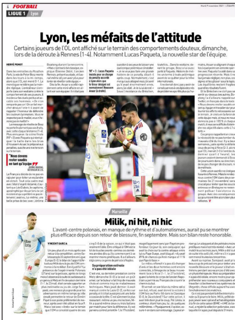
Şekil 3. 9 Kasım 2021 tarihli L'Equipe'in 4.sayfası

L'Equipe'in sayfalarında spor dallarına ayrılan yerlerin tespiti yapılırken, Fransız spor gazetesinin sayfa düzeni (mizanpaj) de incelenmiştir. L'Equipe'in sayfalarındaki haberlerin çoğunlukla 5 sütun üzerinden verildiği tespit edilmiştir (Şekil No:3). Sayfalarda bir ya da iki haber ağırlıktayken, bunlardan biri büyük, diğeri küçük boyutlardadır. Sayfalardaki büyük haberler 4000 ila 6000 vuruştan oluşurken, gazete sayfasının alt kısmında ya da yan tarafından küçük haberler 1.000 ila 2.000 vuruşluktur. Gazete sayfalarında yazının sayfaya egemen olduğu, fotoğraf kullanımının 1 ya da 2 ile sınırlı kaldığı görülmüştür. Görsel malzeme olarak fotoğraflar dışında gazete sayfalarında haberlerin içeriğine uygun grafiklere de yer verildiği görülmüştür.