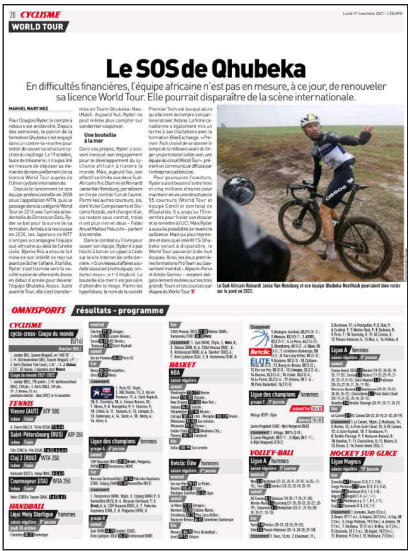
Şekil 4. Müsabaka Sonuçları (Sol) ve Spor Dallarından Kısa Haberleri (Sağ) İçeren Sayfa Örnekleri

Şekil 4'te kısa haberlerin ve müsabaka sonuçlarının L'Equipe'te nasıl sunulduğuna dair sayfa örnekleri sunulmaktadır. Sol taraftaki sayfada, müsabaka sonuçlarının verildiği bölüm sayfanın alt tarafında gözükcek şekilde bir düzenleme yapılmıştır. Sağ taraftaki sayfada ise spor dallarından verilen kısa haberler görülmektedir.