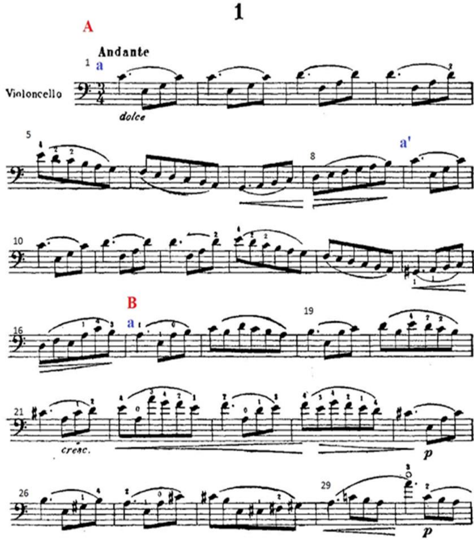
Şekil 1. Resim (Figure 1. Image)