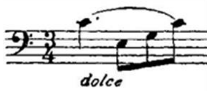
Şekil 7. Resim (Figure 7. Image)

Aşağıda Sebastian Lee Op. 113 1 numaralı Do majör etütün incelenmesi ile elde edilen sonuçlar yer almaktadır: