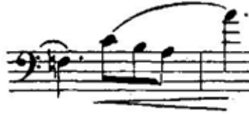
Şekil 6. Resim (Figure 6. Image)

Teknik Özellikleri: Etütte bu figürden toplam 16 ölçü bulunmaktadır. Etüdün %22'sini oluşturan bu figür, 5-6-8-13-14-16-18-20-22-24-28-35-45-52-53-55. ölçülerde karşımıza çıkar. Figürün bulunduğu her ölçü tek baş içerisinde yazılmıştır. Figür, inici ve çıkıcı ses dizileri olarak yazıldığı gibi, notalar arasında atlamalar kullanılarak da oluşturulmuştur. Figür 6, etüdün tamamında, figür 4'ün bittiği sesin bir üst sesinden başlamaktadır. 3/4 'lük ölçüde Do Majör ve Re minör gam ve arpej çalışmaları yapılabilir. Dizi seslerinin temizliğini sağlamak için, boş tellerle ilişkilendirme yapılması önerilir.