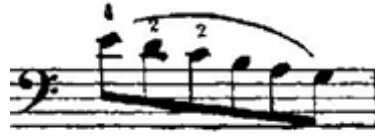
Şekil 5. Resim (Figure 5. Image)

Teknik Özellikleri: Etütte bu figürden toplam 16 ölçü bulunmaktadır. Etüdün %22'sini oluşturan bu figür, 5-6-8-13-14-16-18-20-22-24-28-35-45-52-53-55. ölçülerde karşımıza çıkar. Figürün bulunduğu her ölçü tek baş içerisinde yazılmıştır. Figür, inici ve çıkıcı ses dizileri olarak yazıldığı gibi, notalar arasında atlamalar kullanılarak da oluşturulmuştur. Figür 6, etüdün tamamında, figür 4'ün bittiği sesin bir üst sesinden başlamaktadır. 3/4 'lük ölçüde Do Majör ve Re minör gam ve arpej çalışmaları yapılabilir. Dizi seslerinin temizliğini sağlamak için, boş tellerle ilişkilendirme yapılması önerilir.