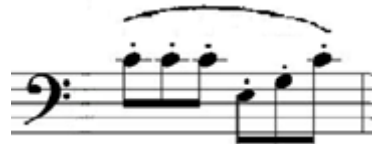
Şekil 4. Resim (Figure 4. Image)

Teknik Özellikleri: Etütte bu ölçüdeki figürden 40 adet bulunmaktadır. Etüt genelinde en çok yüzdeye sahip olan figürdür. Figür, noktalı dörtlük ve üç tane sekizlik notanın bir bağ içerisinde yazımından oluşur. Bu figür etüdün %56'sını oluşturmaktadır. Figürün bulunduğu ölçü numaraları; 1-2-3-4-7-9-10-11-12-15-17-19-21-23-25-26-27-36-37-38-39-40-41-48-49-50-51-54-56-57-58-59-60-61-62-63-64-65-66-67'dir. 15-17-19-21-23-54-58-59-63. ölçüler dışında bu figür uzun ses ve arpej olarak yazılmıştır. Figürün bulunduğu her ölçü tek bağ içerisinde yazılmıştır. Etütte, ritim gruplarının yazılışı sebebiyle 3/4 'lük ölçünün 6/8'lik ölçü olarak algılanmaması için, çalışmaya başlamadan önce etüdün 3/4'lük olduğu düşünülüp, ilk iki ölçünün bu düşünceyle solfejinin yapılması önerilir. Bütün yayda 6 tane sekizlik notayı eşit duyurmak için, yayın tamamını altı eşit parçaya bölerek "bağlı staccato" çalışması yapılabilir.