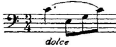
Şekil 3. Etüt no: 1, 1. Ölçü (Figure 3. Etude no: 1, 1. Measure)

S.Lee Op.113 nolu metodun 1 numaralı etüdü (Şekil 3-4-5-6) ölçü bazında incelenmiştir.