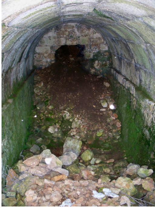
(Lev. 5) Tonoz çatıyla örtülü oda mezar.