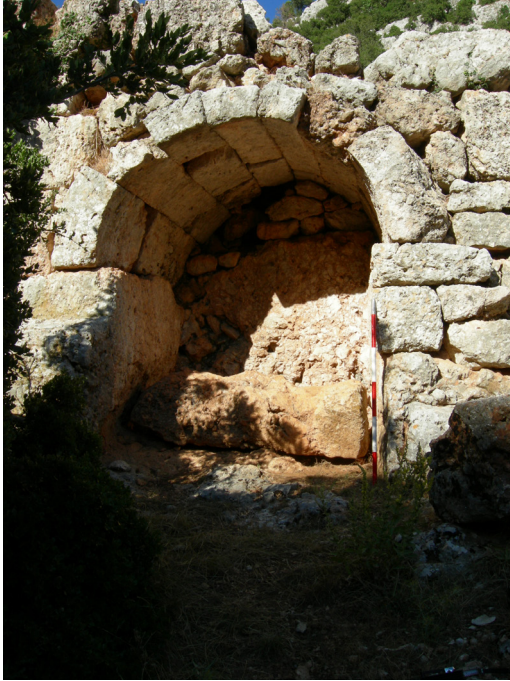
(Lev. 2) Polygonal örgülü duvarda kuzey - güney doğrultulu mezar.