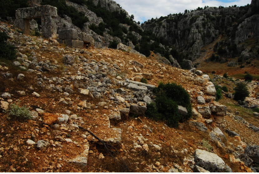
(Lev. 3) Atriumun taban döşemesi.