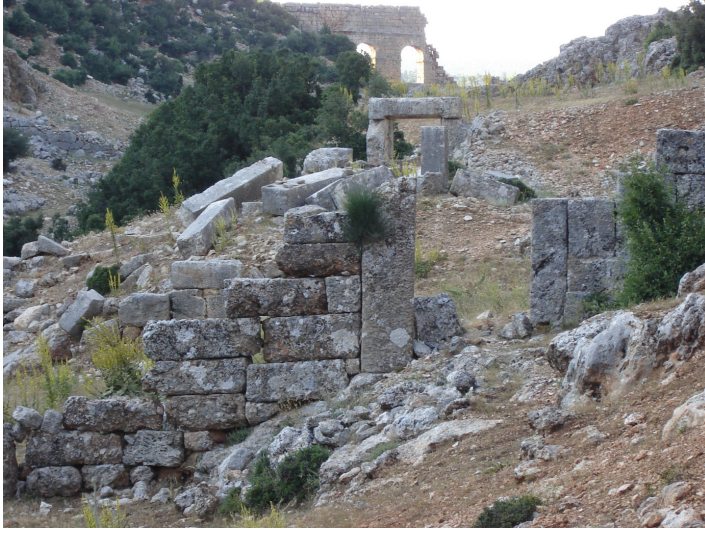
(Lev. 1) Manastır'ın güney ve karşısındaki doğu girişi.