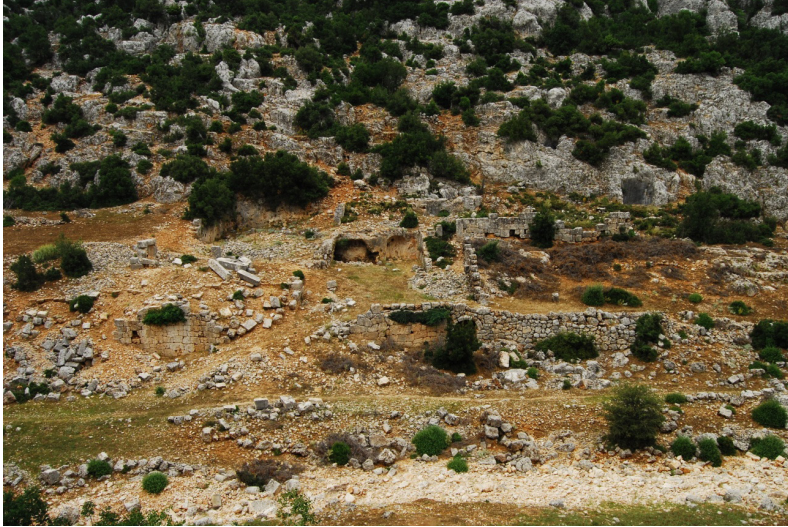
(Lev. 6) Olba Akropolis inden manastırın görünümü.