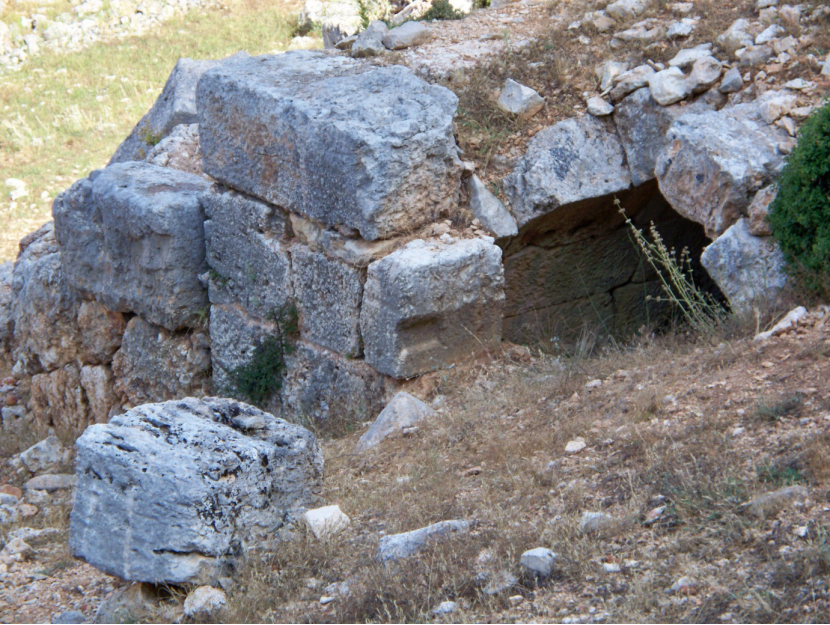
(Lev. 4) Tonoz çatıyla örtülü oda mezarın dıştan görünümü.