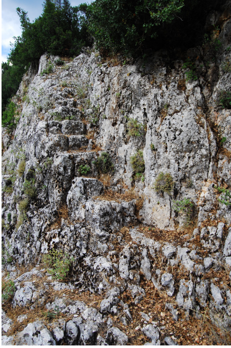
(Lev. 7) Manastırdan sarnıça ıkılan merdiven.