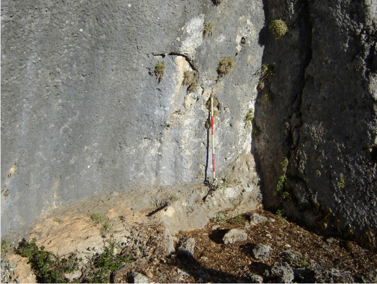
(Lev. 8) Manastırın gney blmnde yer alan Őapel.