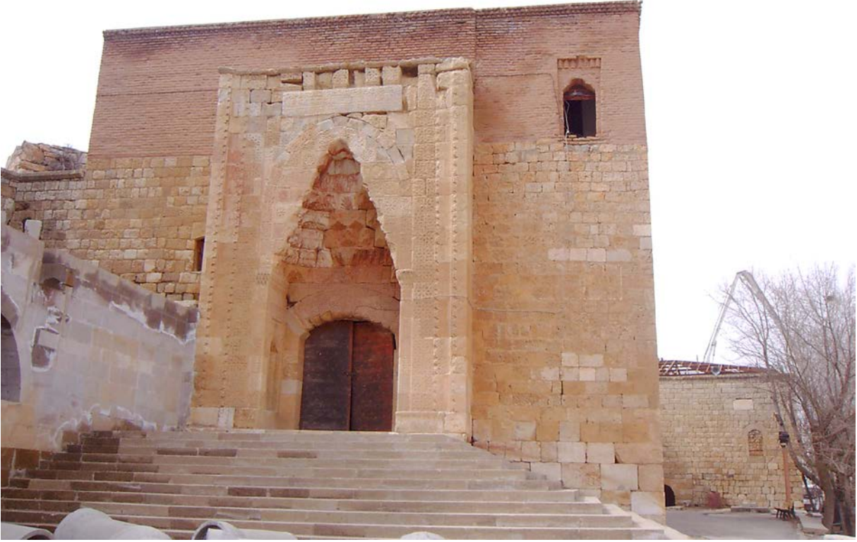
Ek 2: Hacı Bektâş Velî'nin erbain çıkardığı Afşin Ashabü'l-Kehf Külliyesi