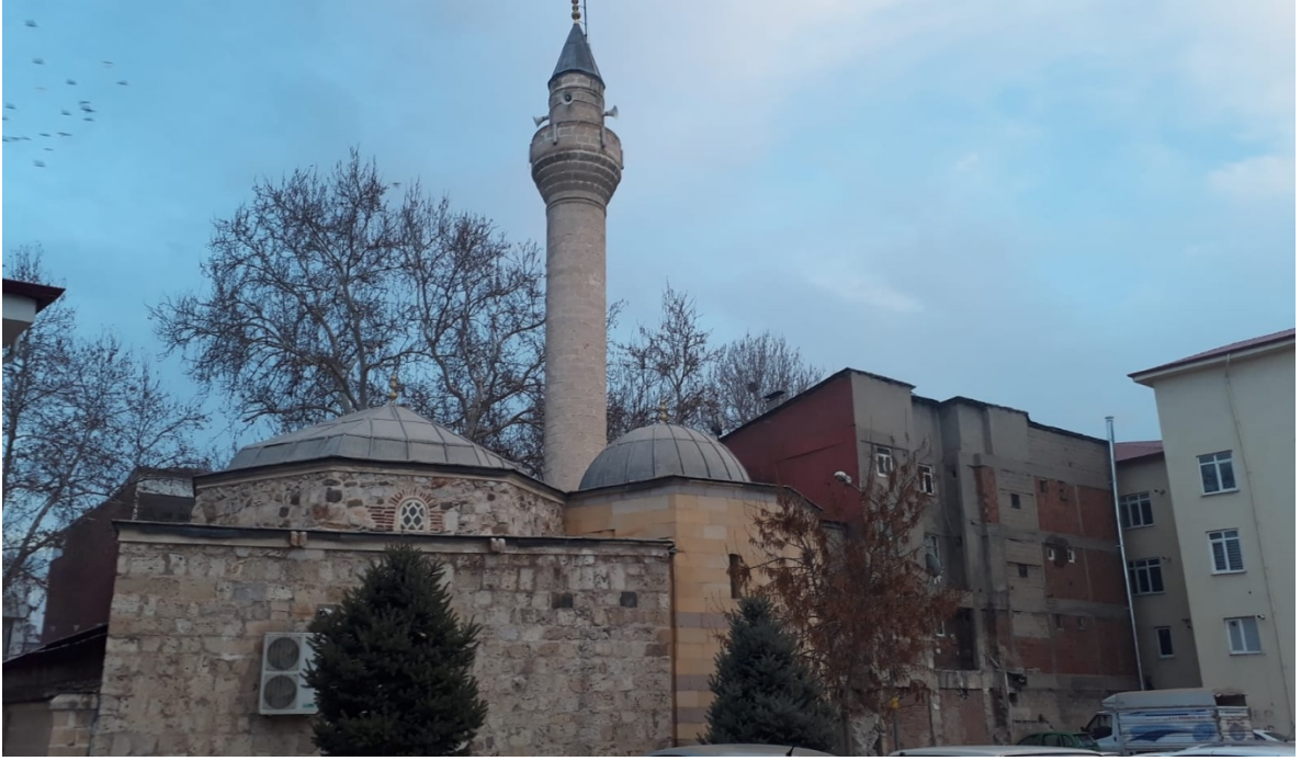
Ek 3: Elbistan Ümmet Baba/Babaîyye Camii