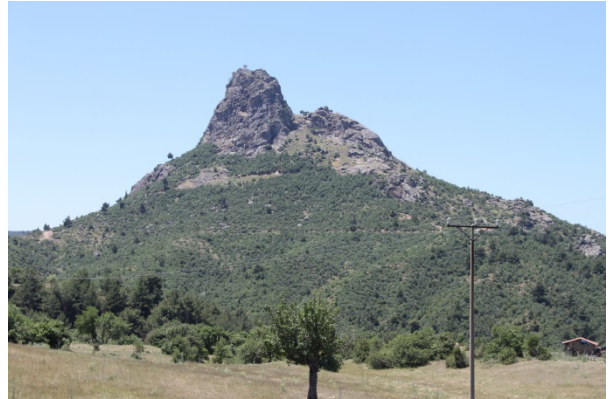
Foto 6- Kayacık yerleşiminin çeşitli sporlara olanak sunan doğal yapısı Photograph 6- Natural structure of Kayacık that offers opportunities for different sports.