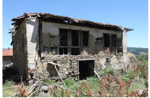
Foto 4- Eski Rum kilisesinin günümüzdeki görünümü Photograph 4- Today's view of Ancient Greek Church.

Beldeden 1922 sonrasında, 30 Ocak 1923'de imzalanan "Yunan ve Türk Halklarının Mübadelesi'ne İlişkin Sözleşme ve Protokol" bağlamında (Bozdağlıoğlu, 2014) Türk – Yunan Nüfus Mübadelesi'ne göre ayrılan Rum nüfusa ait kilise, değişikliklere uğrayarak dört konut niteliğine bürünmüştür. Yapının özgün durumuna getirilerek toplumsal amaçlı kültür merkezi olarak restore edilmesi, yerleşimde farklı kültürlerin yaşadığına tanıklık edecek ve toplumsal aktivitelerin artmasına olanak sağlayacak bir mekân kazanılacaktır.