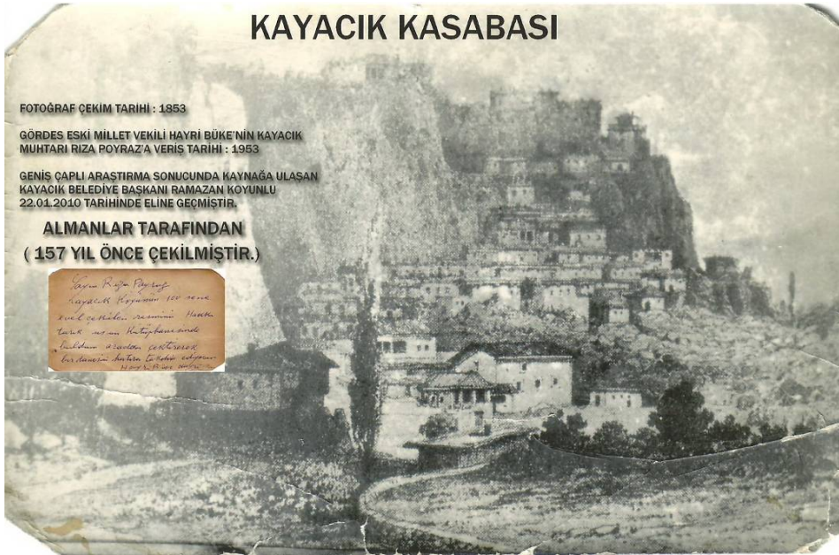
Foto 2- Geçmişte Kayacık kasabası (1853). Photograph 2- Kayacık town in the past (1853).