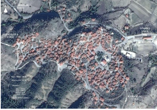
Şekil: 2 – Kayacık yerleşiminin havadan görünümü.

Eğimli alana uygun olarak konumlanmış Kayacık'ın organik sokak dokusu, alt katları depo ve ahır gibi hizmet mekânlarına sahip, genellikle iki katlı ve kiremit kaplı kırma çatılı evlerden oluşan görüntüsü, kırsal kültürel kimliğini yansıtmaktadır (Şekil: 2).