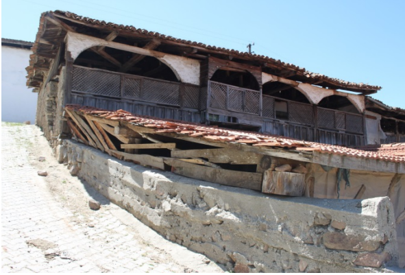
Foto 3- Kayacık'ta 1851 parseldeki dış sofalı ev Photograph 3- House with an outer sofa on 1851 parcel in Kayacık.

Kayacık, sade ama çarpıcı bir güzellik yansıtan evleri, yer yer daralıp, saçaklarla kısmen kapanarak yarı açık bir mekân kimliğine bürünen dar sokakları ile kırsal yaşamın okunabileceği farklı bir dünya sunar. Kayacık yerleşimindeki geleneksel evler, dış sofalı ve iç sofalı düzende olup, dış sofalılarda sofa açık ya da kapalıdır. Özellikle görülen 22 evden içine girilebilen 16'sından beşi açık, beşi kapalı dış sofalı, altısı ise iç sofalıdır (Foto: 3).