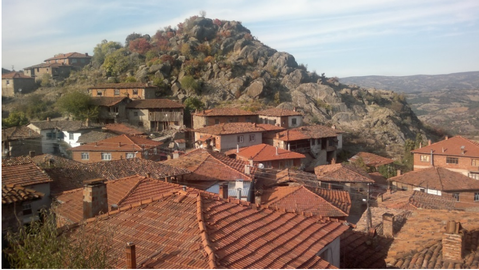
Foto 1- Kayacık beldesi ve kuzeybatıdaki sarp kayalıklar Photograph 1 - Kayacık and cliffs on northwest.

Yerleşimin güneyindeki Kayacık Tepesi'nde ise, "Ambar Kayası" olarak bilinen, halk arasında ise "Kraliçe Mezarı" denilen kaya mezarı bulunmaktadır (Roosevelt, 2009).