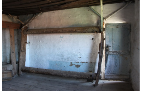
Foto 5- Kayacık evlerinden birinde yer alan günümüzde kullanılmayan dokuma tezgâhının kalan bölümü Photograph 5- Remaining part of a loom which is no longer used in a Kayacık house.

dağcılık ve yamaç paraşütü etkinlikleri de gerçekleştirilmekteydi. Yerleşimin dağcılık ve yamaç paraşütü için son derece uygun doğal çevreye sahip olduğu dikkate alınarak bu tür etkinliklerin planlı bir şekilde gerçekleştirilmesi için gerekli düzenlemeler yapılmalıdır.