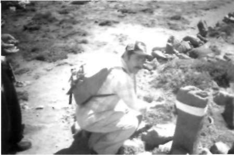
Resim 2: Çiçek Baba mezardan toprak alan bir ziyaretçi.