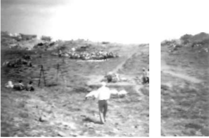
Resim 1: Çiçek Baba yatın ve namaz sonrası dua eden ziyaretçiler.