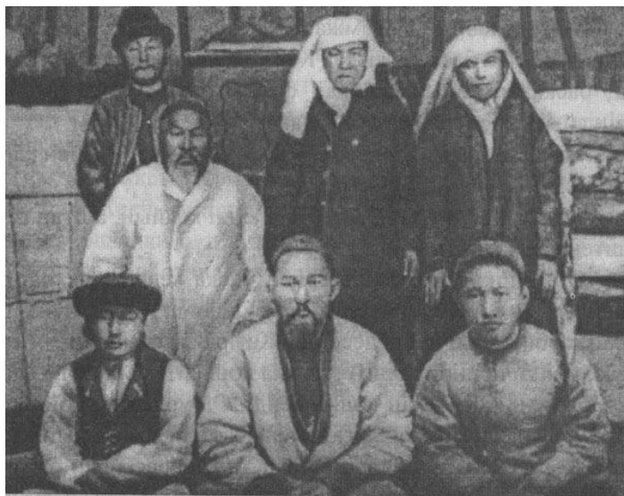
Абайдың 1903 жылғы түскен фотосуреті.

Абай образын ашуда суретшілер портрет, пейзаж және тұрмыстық жанр мүмкіндіктерін молынан қолданған. Бейнелеу өнерінде Абай образын жасауға негіз болған дерек көздері ақынның екі фотосуреті. Біріншісі – 1896 жылы Семейде фотограф Н.Г. Кузнецов түсірген Абайдың ұлдары Ақылбай және Төреғұлмен түскен көлемі 13x9 см фотосуреті [3, 5 б.]. Суретті М. Әуезов 1941 ж. 6 ақпанда Семейдегі Абай мұражайына тапсырған. Екіншісі – 1903 ж. 1 қаңтарда Жидебайдағы үйінің ішінде түскен фотосурет, көлемі 23x13 см. Бұл фотосурет Алматыдағы М. Әуезов мұражайында сақталған.