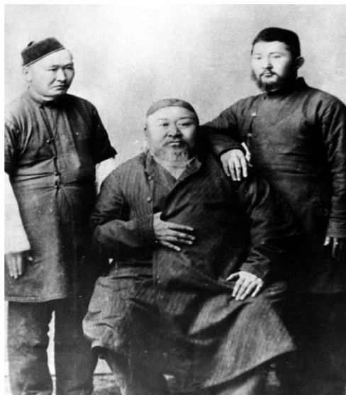
Абайдың 1896 жылы түскен фотосуреті.

Көптеген суретшілер бейнелеу өнеріндегі Абай шығармалары станоктық қондырғылық және монументалдық тұрғыда көрінуімен ерекше көркемдік өлшем үлгісін көрсетеді. Қазақстан суретшілері Абай образын жасауда бейнелеудің графика, кескіндеме, мүсін, қолданбалы өнер, дизайн салаларын қамтыған. Егер бейнелеу өнеріндегі Абай образын зерттеуге оның шығармаларының көркемдік өлшем бірліктерін анықтау проблемасын қосатын болсақ біздің зерттеудің көкейкестілігі онан да арта түседі. Себебі бейнелеу өнеріндегі Абай образын зерттеу үшін оның нақты көркемдік деңгейлерін өлшеу қажет. Қандай мониторинг жасасақ та бізге ең алдымен өлшемдер деңгейін анықтау мақсаты бірінші кезекте тұрады [4, 23 б.].