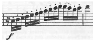
Şekil 3. Allegro bölümü, ölçü 153.