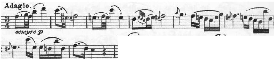
Şekil 31. Adagio bölümü, ölçü 1-8.