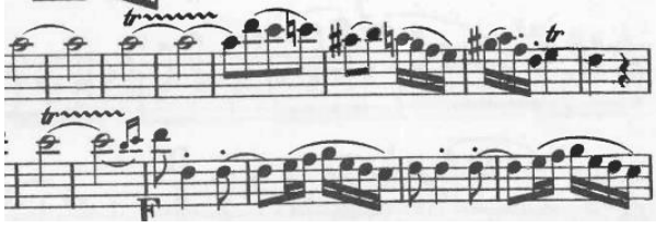
Şekil 17. Rondo bölümü, ölçü 210, 211, 214.