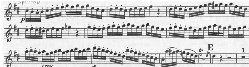
Şekil 9. Allegro bölümü, ölçü 115 – 123 arası.

Flütte çift dil tekniği özellikle hızlı çalınması gereken pasajlarda, tek dilin yetersiz olduğu durumlarda kullanılan bir tekniktir. Tek dilde dil hamlesi parçanın karakterine göre tu, tü veya du, dü şeklinde uygulanırken çift dilde ise iki dil hamlesi olarak, pasajın hızı ve yapısına göre tu-ku, tü-kü, du-gu veya dü-gü şeklinde uygulanır. Üzerinde uzun bir çalışma gerektiren bu teknik, eser ya da etüt içinde gelen hızlı pasajların seslendirilmesini kolaylaştırır. Çift dilde her ne kadar iki dil hamlesi olsa da dinlerken tek dille çalınıyormuş etkisi uyandırmalıdır. Birinci ve üçüncü bölümün hızlı temposu dolayısıyla özellikle on altılık pasajlarda çift dil tekniğinin kullanımı görülmektedir.