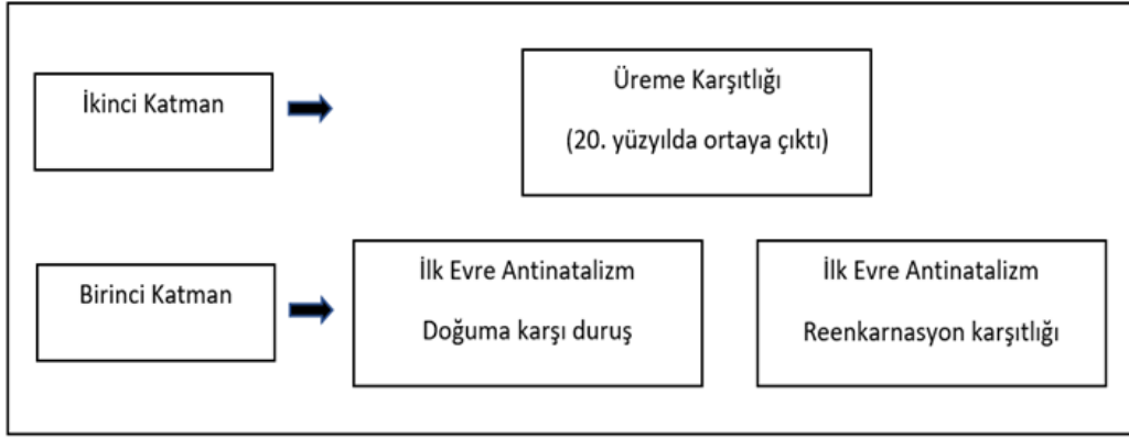
Şekil 1. Morioka'nın antinatalistik düşünce modellemesi (Morioka, 2021, s. 4).

statüdeki kesimlerin aile planlaması konusundaki farklı tutum ve davranış örüntülerini açıklamakta yetersiz kalmaktadır (Rao, 1994).