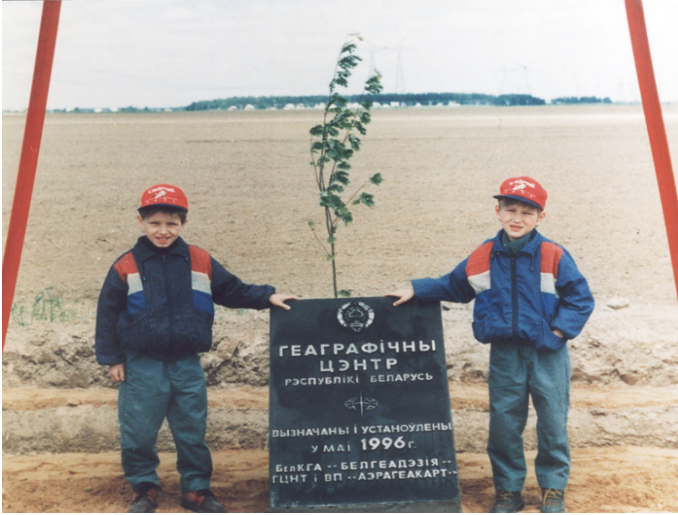
Foto 1: Puhoviç Rayonu (ilçesindeki) Antonovo köyü yakınında yer alan ve Belarus'un merkezini gösteren sembolik anıt.

kentidir. Ayrıca Minsk, ülkenin idari açıdan bağımsız ve hiç bir oblasta bağlı olmayan tek kentidir. 10