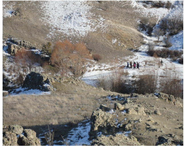
Şekil 2. Kızılcahamam-Çamlıdere jeoparkı doğa izlem ve doğa yürüyüşlerinden bir görünüm