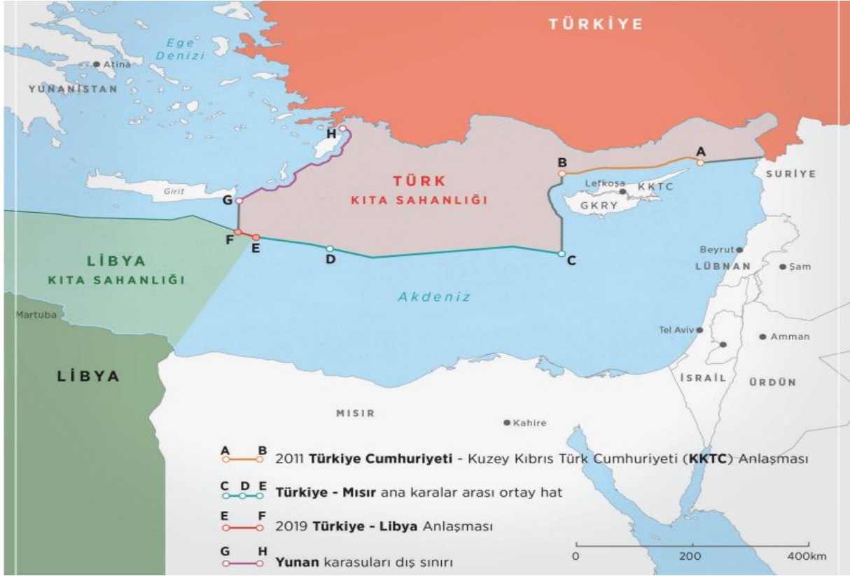
Şekil 2: Doğu Akdeniz Kıyıdaş Ülkeler ve Türkiye-Libya Kıta Sahaneliği