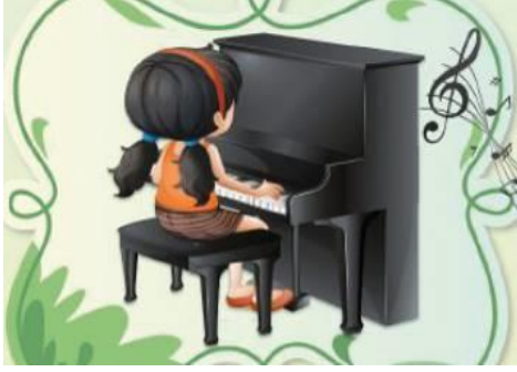
Resim 7. Piyano Çalan Kız (3. Sınıf İngilizce Ders Kitabı s.71)