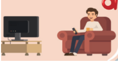
Resim 3. TV İzleyen Erkek (3. Sınıf İngilizce Ders Kitabı s. 72)

Tablo 3 incelendiğinde, aile içi rollerde kadınların erkeklerle kıyaslandığında daha fazla sayıda yer aldığı görülmektedir. Kadınlar anne figürü olarak yemek hazırlarken veya mutfakta, çocuklarla dışarıda zaman geçirirken, çocukları uyuturken, çocukları okula gönderirken, çocuklarla ev içinde ilgilenirken resmedilmiştir. Baba rolündeki erkekler ise en çok çocuklarla dışarıda zaman geçirirken, çocuklarla ev içinde ilgilenirken, TV izlerken ve araba tamiri yaparken kitaplarda yer almaktadır. Anne rolündeki kadınlar yalnızca bir görselde çalışan bir birey gösterilirken, baba rolündeki erkeklerin üç ayrı yerde takım elbiseli ve çalışan bireyler olarak resmedildiği görülmektedir. Aşağıda, kitaplardaki görsellerden örneklere yer verilmiştir.