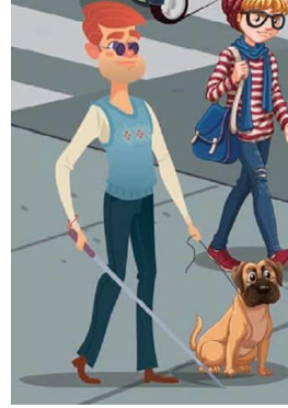
Resim 13. Görme Engelli Birey (4. Sınıf İngilizce Ders Kitabı s. 105)