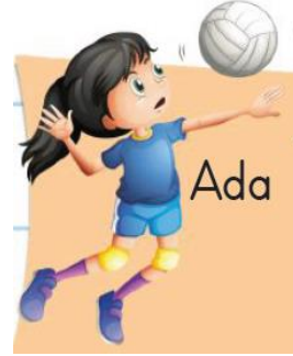
Resim 6. Voleybol Oynayan Kız (3. Sınıf İngilizce Ders Kitabı s. 55)

Tablo 5'te ilkökul İngilizce ders kitaplarındaki görsellerde kız ve erkeklerin oynadıkları oyunlar ve oyuncaklar ile yaptıkları aktivitelerin cinsiyete göre dağılımına ilişkin bulgulara yer verilmiştir.