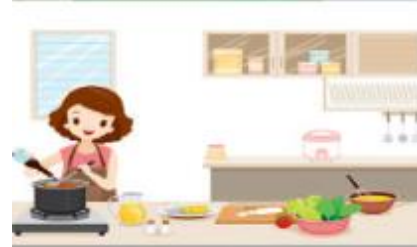
Resim 4. Yemek Yapan Kadın (3. Sınıf İngilizce Ders Kitabı s. 105)

Tablo 4'te ilkokul İngilizce ders kitaplarındaki görsellerde yer alan kadın ve erkeklerin yaptıkları sporlara ilişkin bulgulara yer verilmiştir.