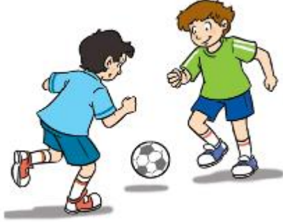
Resim 5. Futbol Oynayan Erkekler (2. sınıf İngilizce Ders Kitabı s. 11)

Tablo 4 incelendiğinde, görsellerde spor yapan erkeklere daha fazla yer verildiği görülmektedir. Özellikle futbol, basketbol, hentbol, judo, hokey sporlarında erkek görsellerinin kadınlara oranla sayıca üstün olduğu aşikârdır. Tırmanma, tenis ve yüzme sporlarında kadın ve erkeklere ait eşit sayıda görselin olduğu, voleybolda ise yalnızca bir kadına ait görselin olduğu görülmektedir. Futbol ve basketbol oynarken resmedilen kadın sayısı yok denecek kadar azdır. Aşağıda, kitaplardaki görsellerden örnekler yer almaktadır.