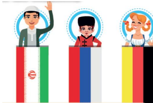
Resim 9. Farklı Milletlerden Çocuklar ve Ülkelerinin Bayrakları (4. Sınıf İngilizce Ders Kitabı s. 29)

Tablo 6'da görüldüğü üzere, 2. sınıf düzeyindeki kitaplarda çeşitli milletlere ve kültürlere ait herhangi bir öğeye yer verilmemiş, 3. sınıf düzeyinde yalnızca iki yerde siyah tenli bireyler yer almıştır. 4. sınıf kitabında Nationality isimli bir ünite olduğundan, bu üniteye Asyalı ve Uzak Doğulu 6 birey, Avrupa'nın çeşitli ülkelerinden 12 birey ve farklı kültürlere ait yedi farklı yemek ders kitaplarında yerini almıştır. Ayrıca, Fransa, Japonya, Britanya, Amerika Birleşik Devletleri, Rusya, Türkiye, Almanya, Çin Halk Cumhuriyeti, İran, Pakistan ve İspanya dâhil olmak üzere 11 farklı ülkenin bayrağı 4. sınıf İngilizce ders kitabında bulunmaktadır. Aşağıda, kitaplardaki görsellerden örneklere yer verilmiştir.