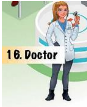
Resim 1. Kadın Doktor (4. Sınıf İngilizce Ders Kitabı s. 81)

Tablo 2’de görüldüğü üzere tüm sınıf düzeylerindeki İngilizce kitaplarında kadınlar 54 kez ve erkekler 55 kez olmak üzere toplam 109 kez, 21 farklı meslekte resmedilmiştir. Bu görsellerden 8’i 2. sınıf kitabında, 15’i 3. sınıf kitabında, 86’sı ise 4. sınıf kitabında yer almaktadır. 4. sınıflarda görsel sayısının bariz bir şekilde fazla olmasının sebebi, Meslekler adında bir üniteye öğretim programı içeriğinde yer verilmesidir. Tablo bütünüyle incelendiğinde, kadınların en çok öğretmen, doktor, hemşire, şarkıcı, dansçı, spiker, mesleklerinde; erkeklerin ise polis, şef, iş insanı, hizmetli, pilot, şoför, makinist, itfaiyeci, postacı, garson, güvenlik görevlisi ve mühendis mesleklerinde olduğu görülmektedir. Aşağıda, kitaplardaki görsellerden örneklere yer verilmiştir.