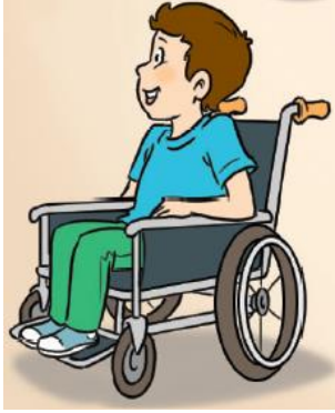
Resim 12. Bedensel Engelli Birey (2. Sınıf İngilizce Ders Kitabı s. 10)

Tablo 8’de görüldüğü üzere, 2. sınıf İngilizce kitabında yalnızca bir yerde tekerlekli sandalyedeki bedensel engelli bir bireye, 3. sınıf düzeyinde bir bedensel engelli bir de görme engelli olmak üzere toplam iki bireye, 4. sınıf düzeyinde ise bir bedensel engelli, iki yerde de görme engelli bireylere yer verilmiştir. Aşağıda, kitaplardaki görsellerden örnekler yer almaktadır.