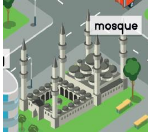
Resim 11. Cami (2. Sınıf İngilizce Ders Kitabı s. 117)