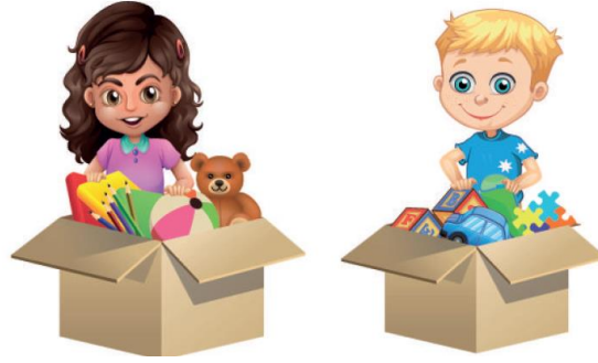
Resim 8. Oyuncaklarıyla Kız ve Erkek Çocuk (4. Sınıf İngilizce Ders Kitabı s. 44)