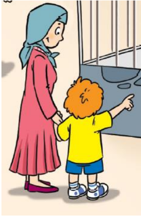
Resim 10. Başörtülü Kadın (2. Sınıf İngilizce Ders Kitabı s. 10)

Tablo 7 incelendiğinde, tüm eğitim sınıf düzeylerindeki kitaplarda yalnızca İslam dinine ait ögelere yer verildiği, Hristiyanlık, Yahudilik, Hint ve Uzak Doğu kökenli dinlere inanan herhangi bir bireye veya bu dine ait herhangi bir simgeye yer verilmediği görülmektedir. 2. sınıf kitabında İslam dinine mensup dört başörtülü kadın birey, 3. sınıfta İslam dinine mensup olduğu varsayılan iki başörtülü kadın birey ve dört ayrı yerde cami ve minareler, 4. sınıf kitabında ise bir yerde başında takke olan İranlı bir Müslüman erkek çocuk, altı ayrı yerde ise başörtülü kadın bireyler bulunmaktadır. Aşağıda, kitaplardaki görsellerden örnekler yer almaktadır.