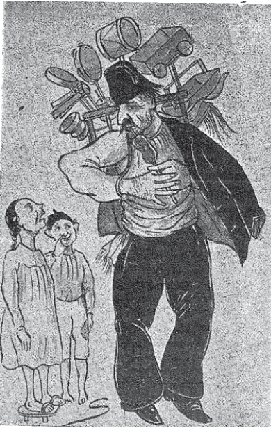
Resim 4: Sermet Muhtar Alus tarafından Tarih Hazinesi için çizilmiştir.

19. yüzyılda seyahatname, hatırat ve süreli yayımlarla artan kaynak çeşitliliğiyle Eyüp oyuncaklarına dair daha fazla bilgi edinilebilmektedir. Yazdığı masallarıyla ünü Danimarka dışına yayılan Hans Christian Andersen’in 1841 yılı başlarında geldiği İstanbul’da Züleyha adında bir çocuğun elinde gördüğü at şeklindeki bir