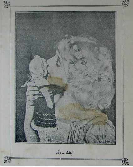
Resim 6: Oyuncak bebeğine sevgi gösteren bir çocuk.

hakkıdır kaidesine işlerlik kazandırdığı vurgulanır. Ancak özellikle amaca uygun oyuncaklar seçilmesi, zehirli olma ihtimali bulunan yeşil ve kırmızı renklilerden uzak durulması uyarısı yapılarak ailelerin bu konuda dikkatli olması istenir 91 .