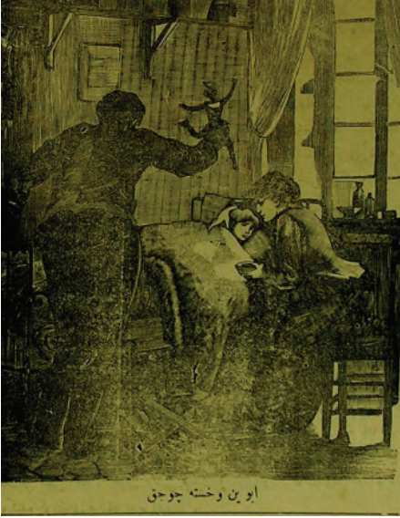
Resim 5: Hasta çocuklarıyla ilgilenen bir aile.

Defteri adlı dergi, sözü edilen yılda dönemin çocuklarına oynadıkları millî oyun ve oyuncaklarımızı sorup gelen cevapları yayınlıyarak bugüne çok değerli bilgiler bırakmıştır. Çocukların oynadığı oyunlar listesinden oyun nesnesi ve oyuncaklar ayrımını yapmak, her bir oyunun nasıl oynandığını bilmek pek kolay değildir. Ayrıca millî oyuncaklarımız başlığı altında verilen bazı oyuncaklar, oyunlar listesinde de görülmektedir. Bir fikir olması açısından uzun oyun listesi içerisinde oyuncak veya oyun nesnesi olarak değerlendirilebilecek olanlar şunlardır: ip atlama, uçurtma, aşık, beş taş, bebek, tahterevallı, ceviz, çelik çomak, çember çevirme, topaç, top, fincan, yüzük, kaydırak, kukla, kızak. Gelen cevaplara göre çocukların oynadığı millî oyuncaklar şunlardır: ok- aşık kemiği, uçurtma, bal mumu ördek, cirit, çelik çomak, çember, dürlüce (ağaç dalından düdüük), davul, def, zurna, sapan, topaç, tabanca, zıpzıp, kalkan, kaniş?, kırbaç, kızak, kargı, kaval, kement, güz, mızrak . Eyüp oyuncaklarından da beşik, kursaklı düdüük, hacıyatmaz, kocakarı zırlıtısı, aynalı testi ve çocuk arabasıyla oynadıkları görülmektedir 70 .