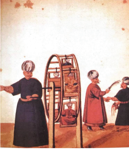
Resim 2: 16. yüzyıla ait bir dönme dolap.