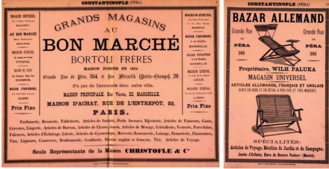
Resim 1: Bon Marché ve Bazar Allemand ilanı.

eden ülkeler olarak oyuncak pazarına hâkimdi 30 . Avrupa, oyuncakçılık sahasında ki gelişmişliğini göstermek için sergiler ve yarışmalar da düzenlerdi 31 .