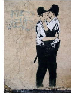
Resim 2. Banksy, Kissing Coppers ,

Banksy kişisel motivasyon kaynakları ile ürettiği yaratıcı ve farkındalık yaratan tasarımlarıyla ilk olarak açık kamusal alanlarda ya da daha açık olarak sokaklarda kendi hikâyesini yaratmıştır. Bu anlamda açık kamusal alanlarda sanatçının koyduğu kurallar ve olasılıklar dahilinde ya da öncülüğünü yaptığı anonim toplumsallık anlarıyla gerçekleşen çok anlamlı ve yoruma açık pek çok