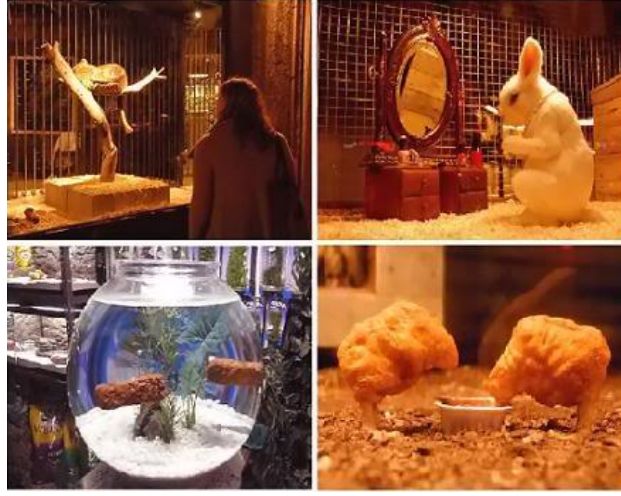
Resim 7. Banksy, The Village Pet Store and Charcoal Grill (Köydeki Evcil Hayvan Dükkanı ve Kömür Izgara), 2008, Newyork.

Bu bakış açısıyla Banksy'nin çalışmaları için kullandığı kapalı kamusal alanların bir kısmı genellikle seçtiği imge ya da nesnelerin örtük anlamlarını açığa çıkararak onları verilmek istenen mesajı pekiştirmek ve anlamı güçlendirmek üzere sanatçı tarafından çoğunlukla geçici olarak kurgulanırken, diğer kısmı alışveriş merkezleri, galeriler, müzeler gibi varolan kurumlardan oluşmaktadır. Örneğin, canlı hayvan boyamalarından sıkılmış Amerikalılar için 2008'de New York'ta sergiyle aynı adı taşıyan The Village Pet Store and Charcoal Grill (Köydeki Evcil Hayvan Dükkanı ve Kömür Izgara) (Res.7) adlı satış yapılmayan bir dükkanda, evcil hayvan dükkanlarına ve fastfood geleneğine göndermeler yaptığı alışılmışın dışında alternatif bir sergi açmıştır. Kanserli Tweety, İnci Kolyeli Robot Tavşan, Maymun Pornosu İzleyen Maymun gibi izleyiciyi rahatsız eden ürpertici bir gerçekliğe sahip işlerden oluşan bu animatronik sergiyi Banksy evcil hayvanlarla ilgilendikleri kadar sanatla ilgilenmeyen New Yorklular için düzenlediğini belirtmiş ve eklemiştir: “Çalışmamın çok ciddi, felsefi bir yanı da var. Hayvanlarla olan ilişkimizi, endüstriyel tarımın etikleri ve sürdürülebilirliğini sorgulayan sanatsal bir çalışma yapmak istedim ama ortaya şarkı söyleyen tavuk köfteleri çıktı” (futuristika.org, 2008).