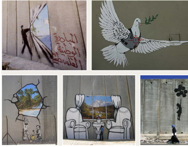
Resim 4. Banksy'nin İsrail-Filistin duvarına yaptığı "Tatil Enstanteneleri" resimlerinden örnekler, 2005.

yandan bu iyi niyetli girişim, yöneticiler tarafından onaylanan Banksy'nin vandallığı ve bu onaylanmış karakteri üzerinden onun çalışmasının anlam ve içerikten yoksun kılınması ve onu sadece estetik değer atfedilen sempatik bir nesneye dönüştürme fikrini de temin etmekte gibi görünmektedir. Daha basit olarak Banksy vandallığı onaylandığında gerilla sanatçı sıfatından uzaklaşmaktadır.