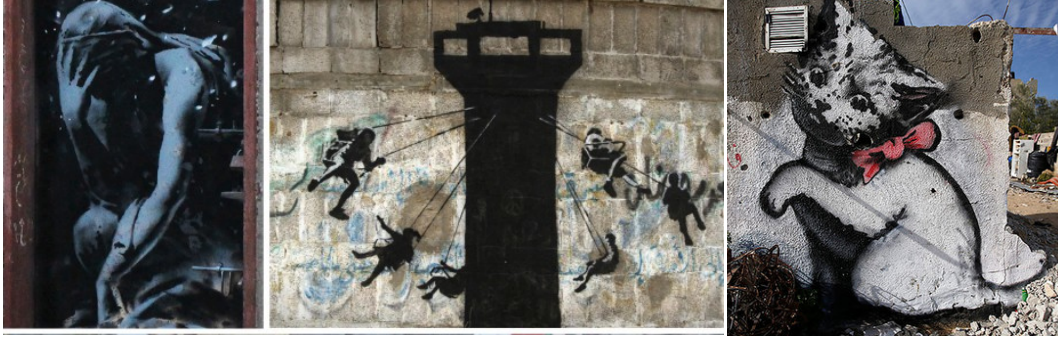
Resim 5. Banksy'nin Gazze'ye Yaptığı Resimler.

Bu videoda da Banksy bu imgeyi muhtemelen yine göz ardı edilen büyük bir sorunu çarpıcı ve görünür kılmak için kullanmıştır.