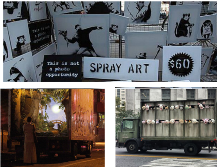
Resim 6. Banksy, Better Out Than In (Dışarıyı İçeriden İyidir) projesi kapsamında gerçekleştirdiği interaktif işler. 2013, New York.

Eğer Banksy illegal sanatı için suç ortakları aramıyorsa o halde en azından bu ilksel ve tepkisel neden her fırsatta kendini bir anti-kapitalist olarak tanımlayan sanatçı için de geçerlidir. Sanatını katılımcı bir pratiğe dönüştürdüğü anlarda ise Banksy bu ve diğer tüm yasadışı eylemleriyle polisin başını en çok ağrıtan sanatçılardan biri olmuştur. Çünkü, polisin müdahale ettiği insanların savunması son derece nettir: “Duvarda Kraliyet logosunu görünce, o ibarenin gerçek olduğunu düşünmüştük” (Mursaoğlu, 2008).