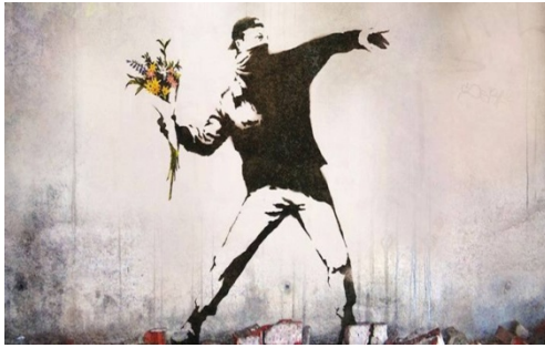
Resim 1. Banksy, Flower Chucker (Çiçek Fırlatan)

Banksy grafitiden enstalasyona, heykelden videoya kadar farklı sanat disiplinlerinin ya da tekniklerinin ayırıcı vurgularını kullanarak referans ettiği konular, mekânlar ve anı belleği ile kendi mitini yaratmayı başarmış bir sanatçıdır. Kuşkusuz bu başarısında temel toplumsal duyarlılık alanlarını titizlikle incelemesi ve kolay anlaşılır bir dil kullanarak büyük heterojen bir kitleye hitap edebilmesinin büyük payı vardır. Bu kitleye ise mesajını farklı estetik kodlar aracılığıyla bağlamı saptırma yoluyla aktarırken çok çeşitli kamusal alanlar kullanmıştır.