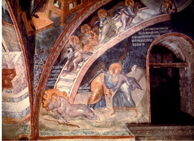
Görsel 4: Kariye Müzesinde duvar resmi, Yakub’un rüyası, merdiven imgesi (erken Hristiyanlık dönemi 4.-6. Yy.).

Merdivenin göğe yükselme aracı olarak düşünülmesi eskilere dayanmaktadır. Merdiven sembolüne Urartu kültüründe, eski Mısırlılarda ve pek çok kültürde rastlanmakta ve sembolik olarak hemen hemen aynı anlama gelmektedir. Yakub’un rüyasında gördüğü göğe değen merdiven Hristiyanlığın çok erken dönemlerinde yapılmış olan Kariye Müzesinde tasvir edilmiştir.