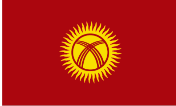
Görsel 3: Otağ sembolünü taşıyan Kırgız bayrağı

Görülmektedir ki kozmoloji anlayışı içinde evren, mekân(otağ) ile maddi temeller üzerine inşa edilmekte, Türkler gökyüzüne dair manevi düşüncelerini maddi hayatlarına yansıtmaktadırlar. Yüksek, dikey, yüce ulu ile özdeşleştirilmiş, bu merkez simgeciliği hayatlarına yansımıştır. Yaşadıkları otağlarını göğe benzetmeleri, Otağın tepesindeki pencere (tüllük) Kırgız bayrağı dini inançların sosyal hayata etkisini açık bir şekilde göstermektedir.