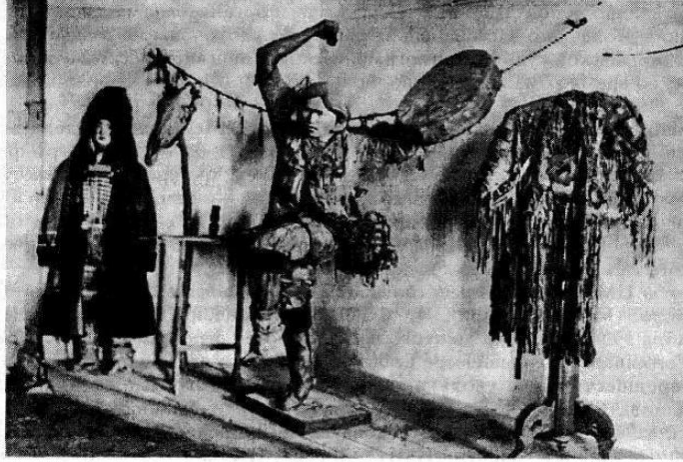
Görsel 1: Kuş figürüne benzerliği ile öne çıkan (sağda) şaman giysisi (manyak)

dikkat çekmektedir. Dikkatlice incelenirse Şamanizm'in tüm sistemini, şamancıl mitler ve teknikler kadar saydamlıkla açığa çıkaracağını belirtmektedir [14, s.195].