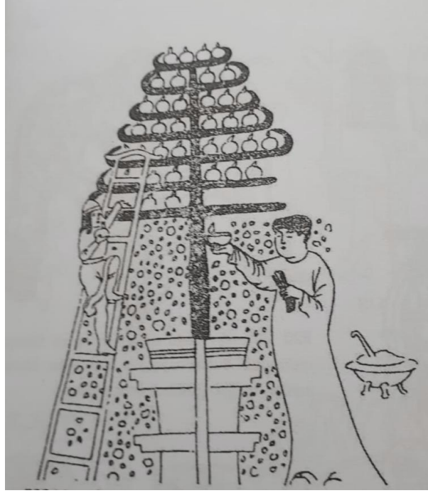
Görsel 5: Mottuk tapınağının bir Uygur duvar resmi.

Türk sanatında İslam'a geçişle resimle tasvir geleneğinden uzaklaşmış, bitkisel, hayvansal figürler ve geometrik formlar ön plana çıkmıştır. Bu nedenle ikonolojik yöntemde zorluklar bulunmaktadır. İslam sonrası dönemde Türk sanatında tasvir içeren eserlere mimari eserlerin bezemelerinde, çini ve minyatür sanatı gibi alanlar dikkat çekmektedir. Diğer bir alan da dokumalardır. Türk dokumalarında özellikle stilize figürler, anlam bütünlüğü oluşturabilen kompozisyonlarla karşımıza çıkmaktadır.