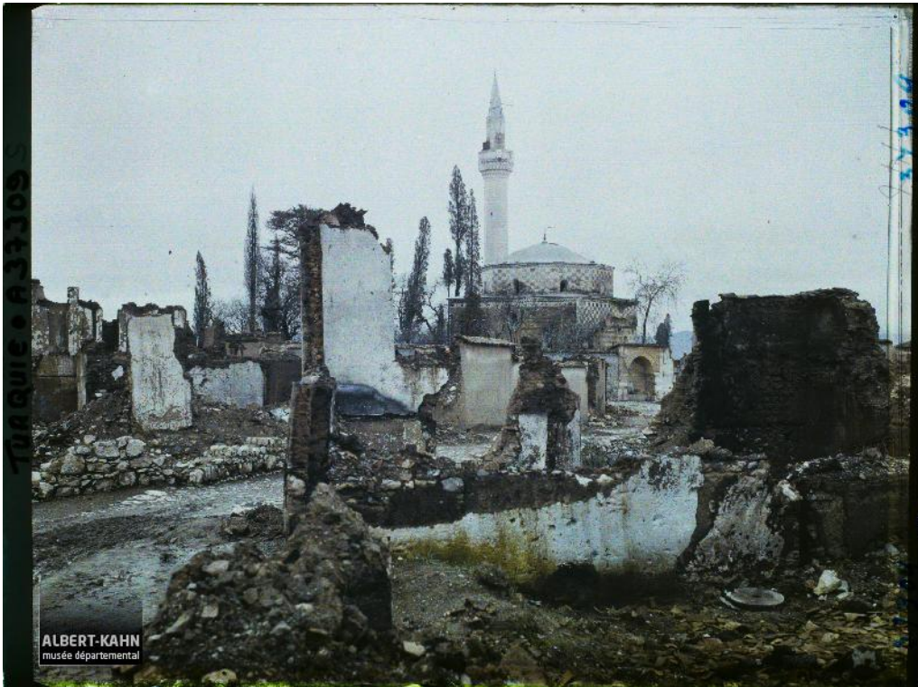
Foto 2: Manisa Hüseyin Ağa Camii ve çevresi, 11 Ocak 1923, Frédéric Gadmer

saatlerinden itibaren başlamıştır. Şehirde yangınla eş zamanlı olarak yaşanan, ilişkili başka olaylar da vardır. Günlerdir ardı arkası gelmeyen, cephe yönünden İzmir'e akan Yunan askerleri ve Rum göçmenler, Manisalılarda yeterince tedirginlik yaratmıştı. 5-6 Eylül gecesi Yangın Taburlarının hazırlıkları sürerken, Yunan ordusu ve göçmenlerin geçişi de sürüyordu. Müslüman halk ise, çaresizlik içinde uykusuz sabahlıyordu. Yunan ordusu ve Rum göçmenler çarşıdan geçerken işyerlerini yağmalamaya da başlamışlardı. 6 Eylül sabahı çarşıda silah sesleri ve yağmalamalar artınca, halk evlerini terk ederek dağa doğru kaçmaya başlamıştı. Geceyi Ulu Cami'de geçiren halkın da dağa sığınmalarına karar verildi. Aynı saatlerde şehirden silah ve bomba sesleri yükselmeye başlamıştı. Aynı zamanda şehrin farklı yerlerinde de yangınlar çıkarılmıştı. Evinden çıkan halk, dere boyu yolları izleyerek dağa tırmanmaya başlamıştı. Nihayet, şehrin merkezi durumundaki çarşı yanmaya, alevler sokakları takip edencesine yayılmaya başlamıştı. Şehirde yağma, katliam ve yangın adeta birbiriyle yarışır hale gelmişti. Bunlara engel olmaya çalışanlar da yok değildi, fakat çoğunun hayatına mal oluyordu (Yörükoğlu, 2002, 122-128). Aynı Ali mahallesinde Ahmet oğlu Bekir Çavuş, her türlü tehlikeyi göze alarak, üç gün üç gece direnmiş ve bir kolunu kaybetmişti (BCA, 30-10-0-0/MUAMELAT GENEL MÜDÜRLÜĞÜ, 133-953-1-3/1-2).