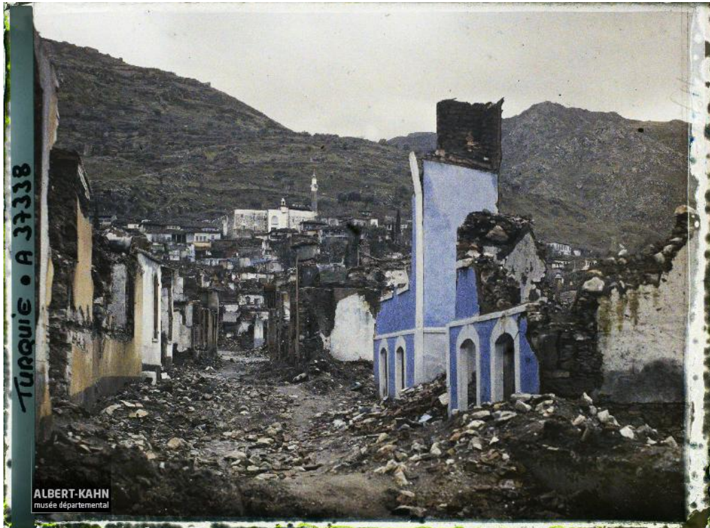
Foto 1: Manisa şehir merkezinden Ulu Cami, 11 Ocak 1923, Frédéric Gadmer

Cumhuriyet Arşivi'nde bulunan ve yangın mağdurlarına ait olan 40 adet beyannameden 18 tanesinde, yangın tehlikesi dolayısıyla evlerin terk edildiği tarih verilmektedir. Buna göre üç aile 4 Eylül'de, dokuz aile 5 Eylül'de, iki aile 6 Eylül'de ve üç aile 7 Eylül'de ve bir aile 8 Eylül'de evlerini terk etmişlerdir (BCA, 272-0-0-12/MUHACİRİN, 40-40-4/5; 40-40-2/1-6,8-10,13-15,17,21,24,28,31). 4 ve 5 Eylül'de henüz yangın olmamakla beraber, evlerin terk edilmesinden, yangın tehlikesinin hissedilir boyutlara ulaştığı anlaşılıyor. 6 ve 7 Eylül'de ise yangın başlamış ve sürmektedir. Evini terk eden 40 aileden bir kısmı dağa, bir kısmı ovaya veya bağa, bir kısmı çevre köylere, bir kısmı da İzmir'e sığınmıştır.