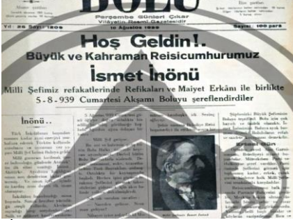
“İnönü’nün Bolu’yu ziyaretine ilişkin haber”, Bolu , S: 1209, 10 Ağustos 1939, s.1.