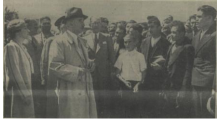
“İnönü, Yeniçağa halkıyla konuşurken”, Ulus , 8 Ağustos 1939, s. 7.