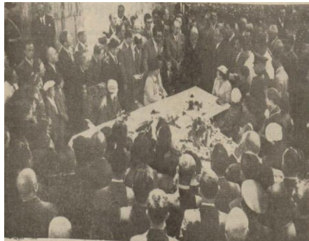
“İnönü’nün Gerede-Esentepe’de halk ile temasları”, Ulus , 8 Ağustos 1939, s. 6.