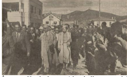
İnönü, Kızılcahamam’da halk arasında”, Akşam , S: 7471, 9 Ağustos 1939, s. 1.