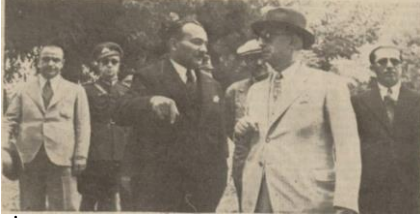
“İnönü, Bolu Valisi Naci Kıcıman’dan izahat alırken”, Akşam , S: 7471, 9 Ağustos 1939, s.6.