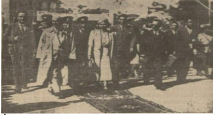
“İnönü Beypazarı’nda”, Akşam , S: 7470, 8 Ağustos 1939, s.1.