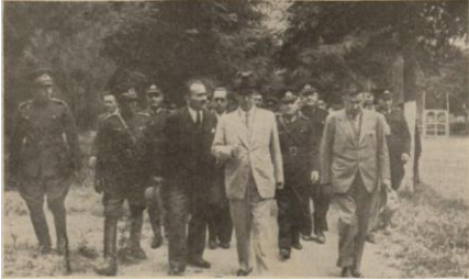
“İnönü, Bolu’da Askerî Mahfelin bahçesinde”, Ulus , 8 Ağustos 1939, s. 6.