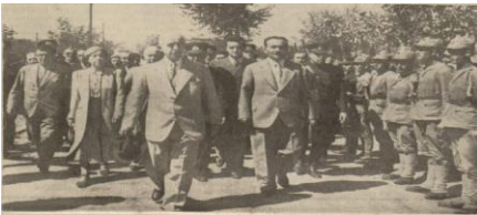
“İnönü’nün Bolu’dan hareketi sırasında askerî kıtayı teftişi”, Tan , S: 1445, 9 Ağustos 1939, s. 1.