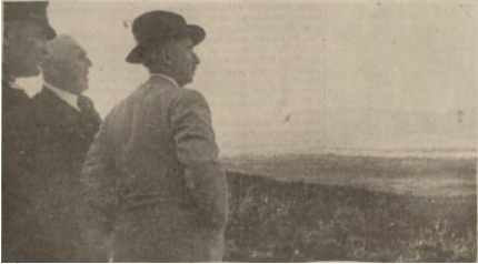
“İnönü, Bolu ovasına bakarken”, Ulus , 8 Ağustos 1939, s. 7.