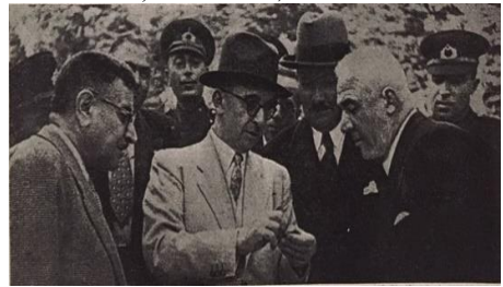
“İnönü, Bolu’da orman yolunda belediye reisi ile yaprakları incelerken”, Doküman , S: 2, 1939, s. 60.