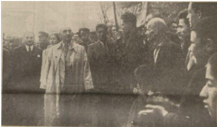
“İnönü’nün Bolu’da halk tarafından karşılanması”, Ulus , 8 Ağustos 1939, s. 7.