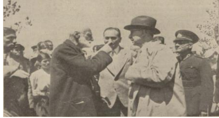
“Yeniçağa’da bir köylü cumhur reisine taleplerini bildiriyor”, Cumhuriyet , S: 5475, 9 Ağustos 1939, s. 1.