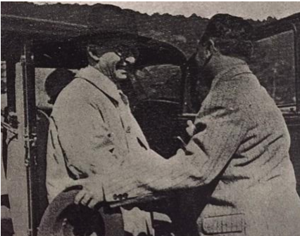
İnönü’nün Bolu vilayeti hududunda Bolu Valisi ile vedalaşması, Doküman , S: 2, 1939, s. 60.