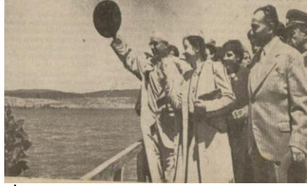
“İnönü, Yeniçağa halkını selamlarken”, Ulus , 8 Ağustos 1939, s. 1.