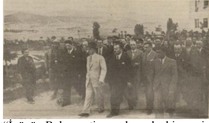
“İnönü, Bolu parti meydanında bir gezinti sırasında”, Ulus , 8 Ağustos 1939, s. 6.