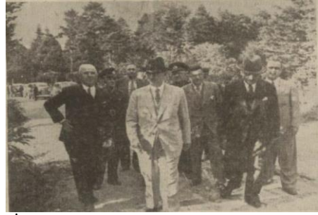
“İnönü, Bolu ormanlarında bir gezintide”, Ulus , 8 Ağustos 1939, s. 8.