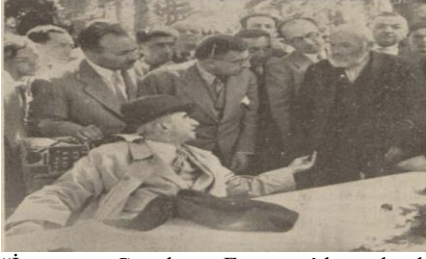
“İnönü, Gerede Esentepe’de köylü elbiselerini inceliyor”, Cumhuriyet , S: 5475, 9 Ağustos 1939, s. 1.