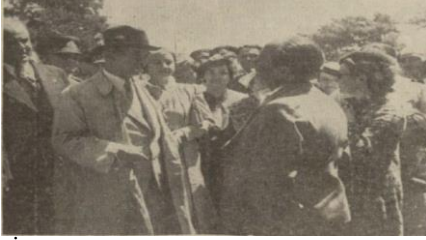
“İnönü, Esentepe’de kamp kuran Ankara-lılarla”, Ulus , 8 Ağustos 1939, s. 8.