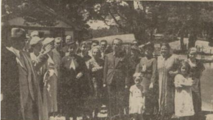
“İnönü, Gerede’de halk arasında”, Ulus , 8 Ağustos 1939, s. 7.