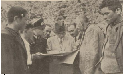
“İnönü, Seben ormanlarında bir köylünün yol talebini harita üstünde inceliyor”, Cumhuriyet , S: 5475, 9 Ağustos 1939, s. 1.