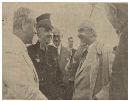
“İnönü’nün Ankara’da karşılanması”, Cumhuriyet , S: 5475, 9 Ağustos 1939, s. 7.