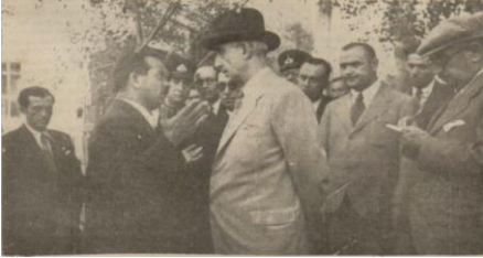
“İnönü, Bolu’da bir kereste tacirinin taleplerini dinliyor”, Ulus , 8 Ağustos 1939, s. 6.