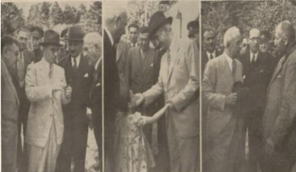
“İnönü’nün Bolu seyahatinden izlenimler: 1.Bolu ormanlarında incelemeler, 2. Küçük bir çocukla konuşurken, 3. Bir köylü ile hasbihal”, İkdam , S: 23300, 9 Ağustos 1939, s. 3; Ayrıca bkz. Son Posta , S: 3243, 9 Ağustos 1939, s. 1.