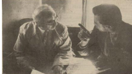
“İnönü, Kızılcahamam’da Ankara Nafia Müdürü’nden yollar hakkında izahat alıyor”, Ulus , 8 Ağustos 1939, s. 6.