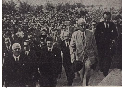
“İnönü, Bolu Halkevi’ne girerken”, Ulus , 8 Ağustos 1939, s.7.