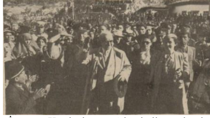
“İnönü, Kızılcahamam’da halkı selamlar-ken”, Ulus , 8 Ağustos 1939, s. 6.