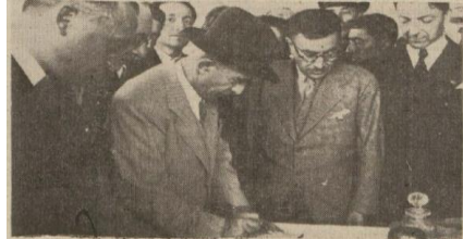
“İnönü, Bolu Halkevi hatıra defterini imzalarken”, Ulus , 8 Ağustos 1939, s.7.