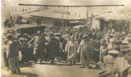
“İnönü’nün eşi Mevhibe Hanım ile Mudurnu’yu ziyareti”, Mudurnulular Derneği Bülteni , S: 10, Kasım 2017, s. 31.