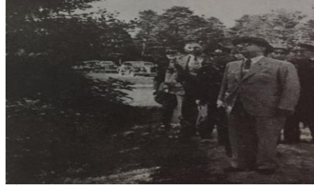
“İnönü, Bolu ormanlarında incelemelerde bulunurken”, Bolu Gezisi , s. 1.