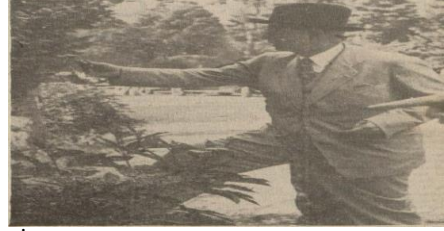
“İnönü, Bolu ormanlarında incelemelerde bulunurken”, Ulus , 8 Ağustos 1939, s. 7.