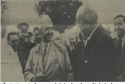
“İnönü, Ankara girişinde kendisini karşılayan Başvekil Doktor Refik Saydam ve vekillerle konuşuyor”, Ulus , 8 Ağustos 1939, s. 1.