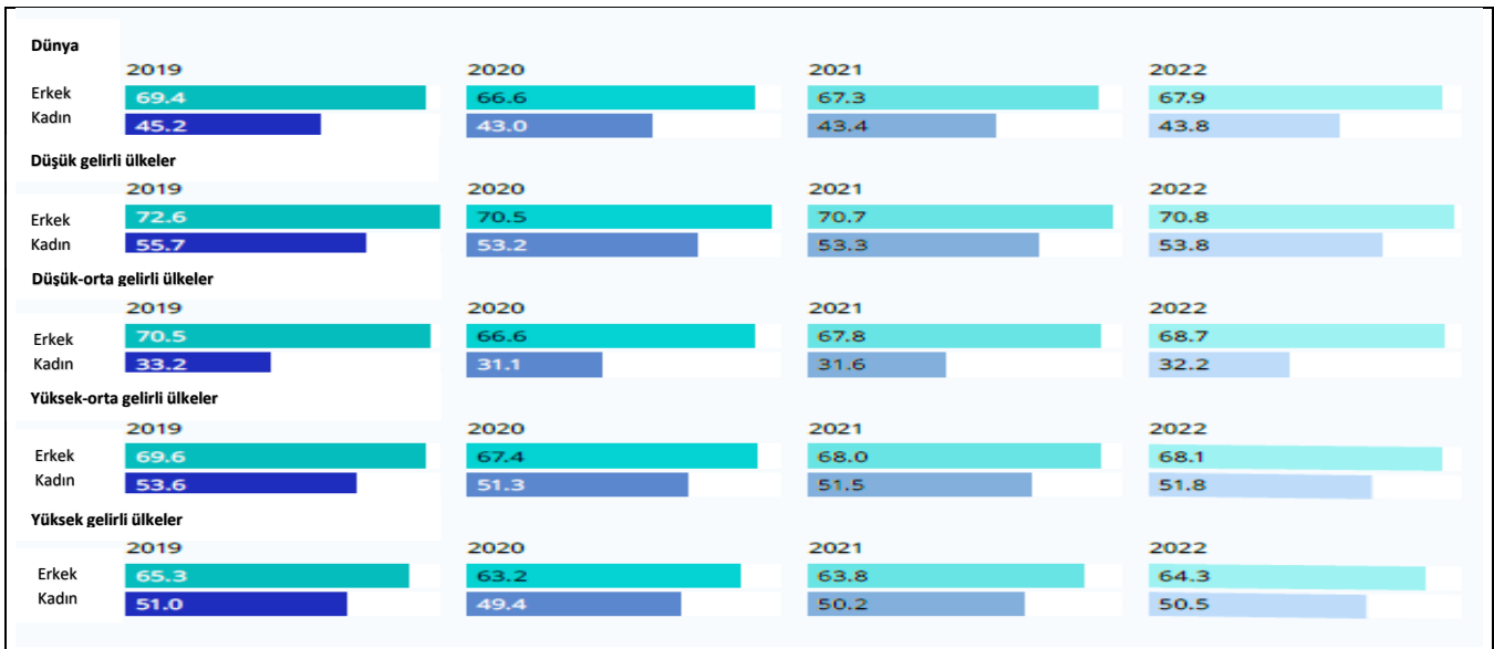
Şekil 1: Cinsiyete ve Ülke Gelir Gruplarına Göre İstihdam (Nüfus Oranı, %), 2019-2022

Kaynak: ILO, World Employment and Social Outlook: Trends 2022, s.25.