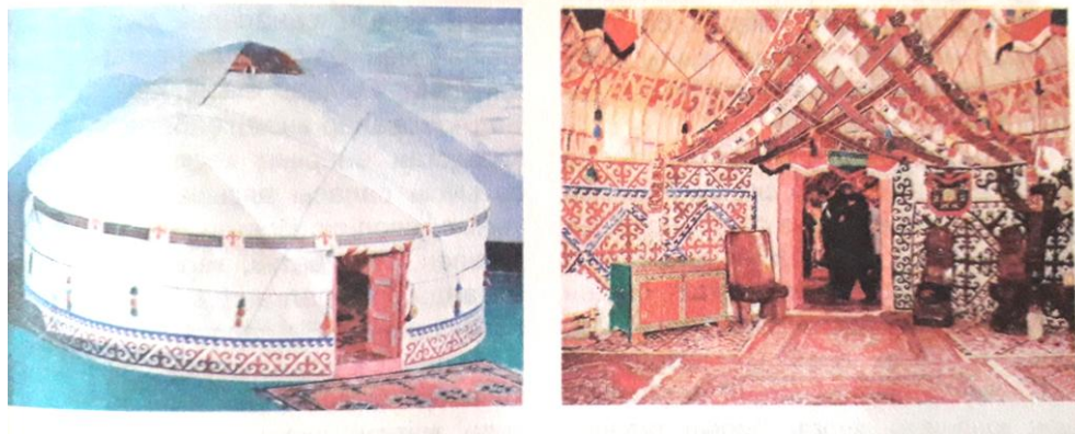
Сурет-2. Қазақ сәндік-қолданбалы өнерінің туындысы - киіз үй көріністері.

Халқымыздың көркемөнер шығармашылығы еліміздің рухани-тарихи әлемін, ұлттық бейнесін, өмір тіршілігін бейнелейді. Дана халқымыздың сәндік-қолданбалы өнерінің әрбір даму сатылары өзіндік ерекшеліктерімен айқындалған. Қазақ қолөнеріндегі әртүрлі түр-түс халықтың болмысын, өмірге деген көзқарасын, өршіл рухын, танымын айғақтайды [14, 10-б.].