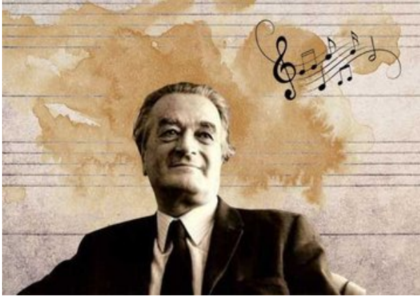
Görsel 6. Ahmet Adnan Saygun (Anonim, 2020)

Cumhuriyetin ilk yıllarında devletin müzik politikası Batı müziği ağırlıklı bir yapıdadır. Müzik anlayışını gerçekleştirebilmek amacıyla yapılan bir dizi çalışmadan birisi de Batı müziğinin inceliklerini öğrenmeleri amacıyla yurt dışına öğrenci göndermek olmuştur. 1925-1928 yılları arasında Milli Eğitim Bakanlığı açmış olduğu sınavlarda başarılı olan çok sayıda öğrenciyi yurt dışına göndermiştir. Sonraki yıllarda da bu durum devam etmiştir. Bu isimlerden bazıları şunlardır: Ulvi Cemal Erkin, Ahmet Adnan Saygun, Hasan Ferit Alnar, Cezmi Erinç, Fuat Koray, Halil Bedii Yönetken (Akkaş, 2015, s. 102; Uçan, 1994 s. 4).