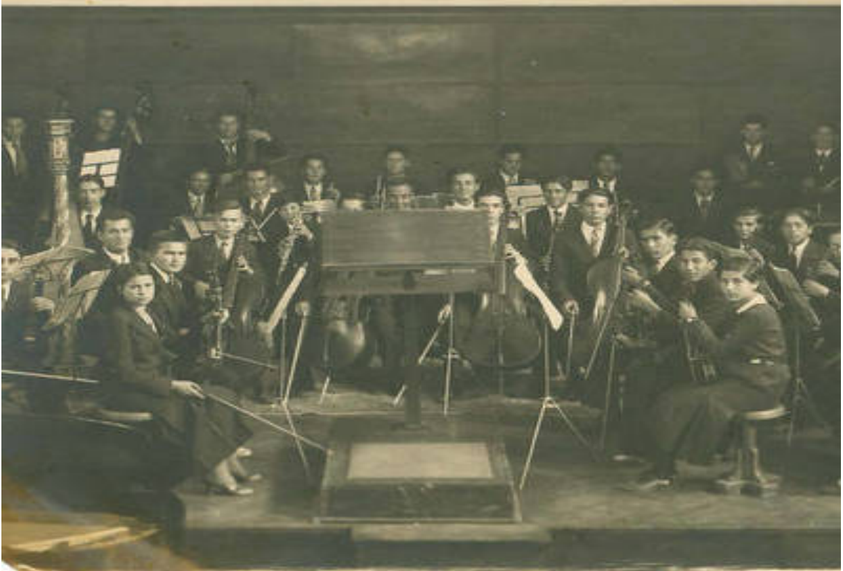
Görsel 5. Musiki Muallim Mektebinde orkestra çalışması (Anonim, t.y.)

1 Kasım 1924 tarihinde müzik öğretmeni yetiştirmek amacıyla kurulmuştur. Eğitim ağırlıklı olarak Batı müziği temeline dayalıdır. Osman Zeki Üngör müdürlüğünü üstlenmiş, okulda eğitim veren öğretmenler kadrosu Riyaseti Cumhuriyet Filarmonik Orkestrasının üyeleri oluşturmuştur. Musiki Muallim Mektebinin diğer amacı da sanatçı yetiştirmek olmuştur. Musiki Muallim Mektebi 1938-39 öğretim yılında Gazi Orta Muallim Mektebi ve Terbiye Enstitüsüne aktarılmış, daha sonra da Gazi Orta Öğretmen ve Terbiye Enstitüsü Müzik Şubesi adını almıştır (Gökçedağ, 2007, s. 114).