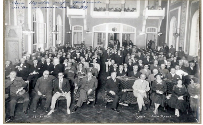
Görsel 8. Türkiye Cumhuriyeti'nin ilk operası: Özsoy Operası (Kaplan, 2021)