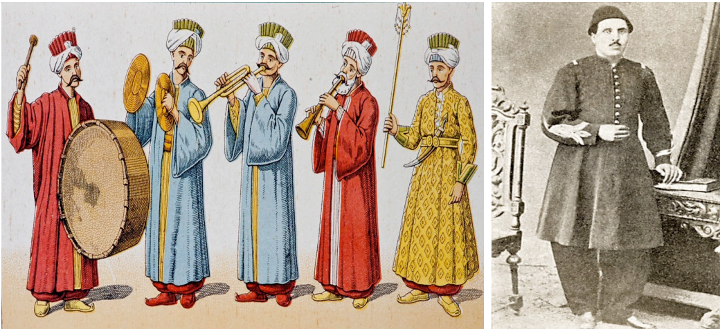
Görsel 1. Mehteran kıyafetlerini gösteren bir resim (Özcan, 2003, s. 28)

Mehterin Türk tarihindeki geçmişi Hunlar dönemine kadar uzanmaktadır. O dönemdeki adına "Tuğ Takımı" denilmekte vurmalı ve üflemleri çalgılardan oluşmaktaydı. Yücel (2019), Tabılhane ve ardından askeri müzik eğitimi için kurulan Mehterhane-i Hümayûn ve Musika-i Hümayûn'un Osmanlı Devleti'nin askeri müzik ihtiyaçlarının karşılanması için geliştirilmiş olduğunu aktarmaktadır (ss. 10-11). Türk tarihinde müzik, yaşamın her halinde kendine yer