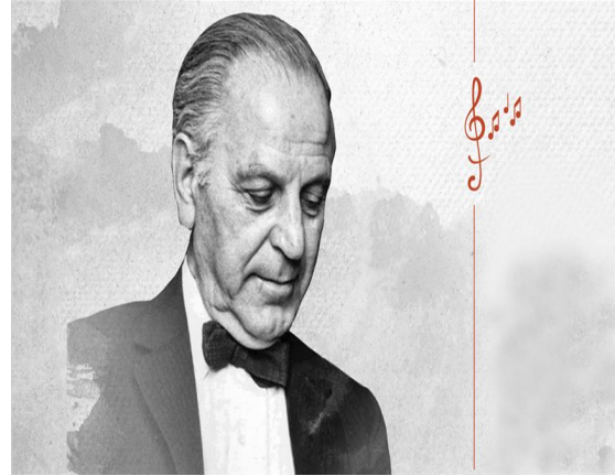
Görsel 7. Ulvi Cemal Erkin (Şeref, 2020)