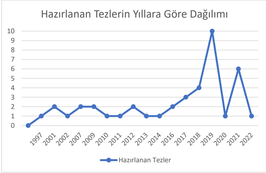
Grafik 1. Hazırlanan Tezlerin Yıllara Göre Dağılımı

Tezlerin yıllarına yönelik yapılan incelemede 1 tezin (%2,43) 1997, 2 tezin (%4,87) 2001, 1 tezin (%2,43) 2002, 2 tezin (%4,87) 2007, 2 tezin (%4,87) 2009, 1 tezin (%2,43) 2010, 1 tezin (%2,43) 2011, 2 tezin (%4,87) 2012, 1 tezin (%2,43) 2013, 1 tezin (%2,43) 2014, 2 tezin (%4,87) 2016, 4 tezin (%7,31) 2017, 4 tezin (%9,75) 2018, 10 tezin (%24,39) 2019, 1 tezin (%2,43) 2020, 6 tezin (%14,63) 2021, ve 1 tezin (%2,43)) ise 2022 yıllarında hazırlandığı tespit edilmiştir. Tezlerin türlerinin yıllara göre dağılımı ise aşağıdaki Grafik' te gösterilmektedir.